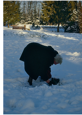
Gravafsnit for ukendte på Vejle Nordre Kirkegård. Der sættes lys og de antændes lige op til jul. Foto: Forfatteren, 1995

Til disse nye anlæg kom med tiden, dvs. igennem 1900-tallet