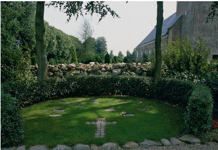
Hækomkranset gravafsnit for "ukendte", anlagt som navneplader i plæne ca. 1991. Det brostensbelagte kors angiver indholdet.