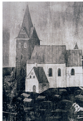
Ballum Kirkegård før ca. 1850. På tuegravene synes de store ligsten nærmest at balancere for at finde hvile. I Øst- og Vestsønderjylland var den type gravlæggelser ikke sjældne. Derimod var de græssende får et hverdagssyn.

En hovedsag for tuegravene, der ikke kun blev opsat en gang for alle, men løbende måtte vedligeholdes, var således at de skulle virke som et varigt gravminde, og i en del tilfælde også som en markering af en "livslang" gravstedsplads for ejendommen. Når de strakte sig over hele graven, skyldes det hensynet til den endnu sovende beboer, hvorfra intet skulle kunne fjernes eller tilføjes, hvad der i begge tilfælde gav anledning til gengangeri. For at gøre denne befæstelse af gravstedet endnu mere sikker, kunne man anvende ligsten, som vi kender dem inde fra kirken, eller desuden kraftige træstokke, ligtræer, eller måske noget endnu sværere. Gennemgående lod den type gravmærker sig let udsmykke, som regel med en enkel navneindskrift, der muligvis anråber om den evige frelse, eller simplere blot med et bomærke og en påskrift om, hvem stedet tilhører i næste led. Selv om det var ude på kirkegården betegnede disse befæstede tuer ofte læn-