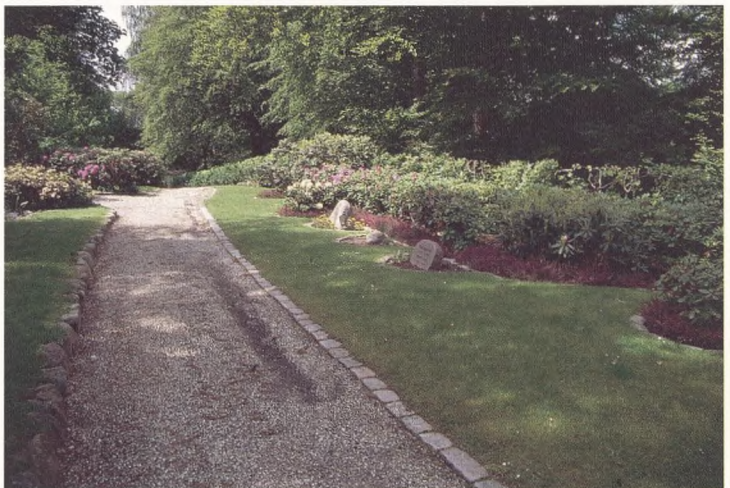
Afdeling 105.

Gravstederne er beliggende i græs ind til rododendronbede-