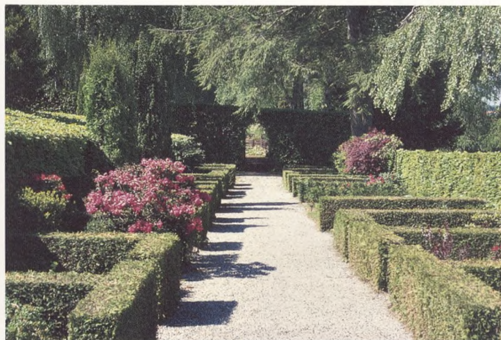
Afdeling 108 og 113.

Afdelingen benyttes udelukkende til begravelse af børn.