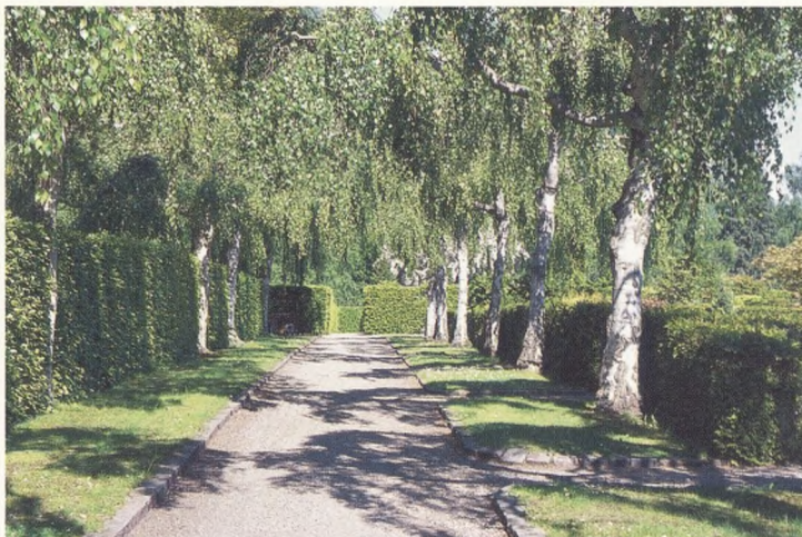
En af kirkegårdens alléer.

målet med haveforeningen ophører i 2009, hvorefter arealet vil blive anvendt dels til en udvidelse af parkeringsarealet dels til 2 kirkegårdsafdelinger.