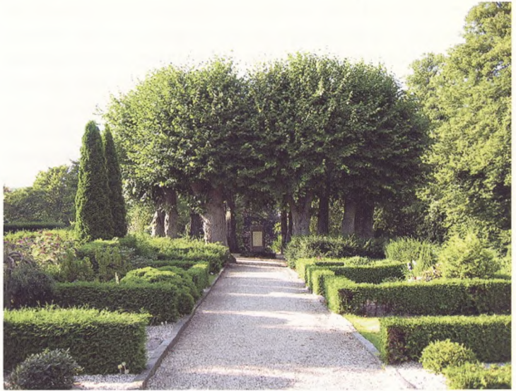
Afdeling 102, set mod nord med 1864 mindesmærket.

lingen havde i løbet af årene udviklet sig til mere skov end kirkegård, og var efterhånden et sted ingen ønskede gravsteder. I 1989 påbegyndtes derfor en total udskiftning af beplantningen.