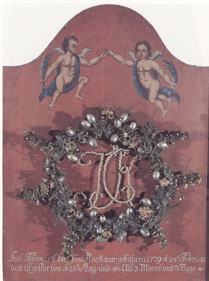
Mindetavle over en tre måneders dreng død 1779 i Kolstrup ved Aabenraa. Tavlen danner baggrund for den sejrskrone, der havde smykket kisten. Tilhører Aabenraa Museum.

Ved årtusindskiftet, hvor det naturvidenskabelige verdensbillede forlængst er knæsat, udvides opfattelsen af, hvornår barnet er et fuldgyldigt menneske, stadig. Man kan gå flere stadier bagud i fostertilstanden og dog give et sådant barn en ordentlig begravelse i indviet jord. Grænsen drages ikke længere ved det fuldbårne barn. Det er hensynet til forældrenes og andre næres sorgbearbejdning, der er afgørende, og at selv dødfødte eller for tidligt fødte kan opfattes som elskede, umistelige personer, fremgår af en del dødsannoncer og af initiativer til at oprette gravsteder for aborter. Når disse små