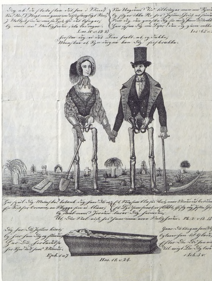
Det sidste opslag i en serie folde-ud-billeder fra 1850'erne viser, at selv det smukke unge par står med deres knokkelben på gravens rand. De bør besinde sig på deres dødelighed og ikke hengive sig blindt til livets lyst og last.

Forklaringerne er søgt i trosgrundlaget: i opbruddet fra det gudhengivne, skæbnetro verdensbillede, som i løbet af 1800-tallet blev afløst af det rationelle og objektivitetssøgende, naturvidenskabelige verdensbillede. Opbruddet er uløseligt knyttet til lige så drastiske ændringer af de sociale og økonomiske strukturer. De blev indvarslet i slutningen af 1700-årene af den franske revolution og den frembrydende industrialisme. Dermed blev den enkelte gradvist løsrevet fra de tætte lokale bånd til slægt, naboskab og lav og fra det hierarkiske standssamfund. Han blev fri til at efterstræbe idealerne om demokrati, selvbestemmelse og ansvarlighed, mens de gamle