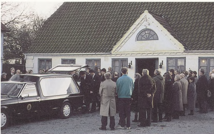
Udsyngning fra hjemmet på en slægtsgård i Løjt Kloster, ved Aabenraa, 1988. Kisten bæres ud, mens en stor del af følget ser til.

Fra ca. 1850 begyndte vævet af tro og overtro at smuldre, og omkring 1900 mistede gengangerfrygten og helvedesangsten sit tag. I 1880'erne blev udstyret ved begravelsen, der stadig helst skulle være et lystigt gilde med beruselse, også mere og mere borgerligt præget. Det sås i den righoldigere menu på