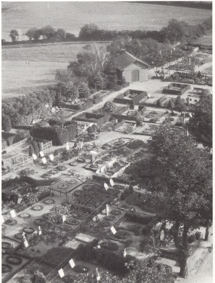
Brejning Kirkegård på Tåsinge, fotograferet 1925 af Georg Georgsen. Selv på de mere velordnede østdanske kirkegårde var stierne mellem rækkerne ofte ikke mere end en fodsbredde, og indhegningen varierede med gravstedejernes smag og formåen. Mange velordnede tuegrave savner stadig et gravmæle. Tilhører Landbohøjskolen.

den nye tids oplyste tanke og skik på landet. Gamle trosbase- rede skikke som at holde vågenat med dans, de rituelle skå- ller for den døde og megen varselstagning gik i Danmark tid- ligt i opløsning. I Tyskland har man f.eks. helt op omkring 2000 bevaret f.eks. den sorte højtidsfarve og det at sætte den nykastede grav op i en høj rektangulær tue med et sort mid- lertidigt kors på. Hvordan man kan forklare dette er lidt uklart. Mest nærliggende forekommer den folkelige oplys- ning, især gennem folkehøjskolerne, som kom til at gå så lyk- keligt i spænd med andelstidens opgangstid for landbruget. Ser man på kirkegårde, går det væsentligste skel i Europa mellem de nordlige protestantiske områder og de centrale og sydlige dele, der overvejende er katolske eller ortodokse. Her har den ubrudte tradition for forbøn ved gravene med kors, vievand, lys og undertiden dødemåltider gjort, at den synlige kiste eller sarkofag som den dødes hus er blevet det nødven-