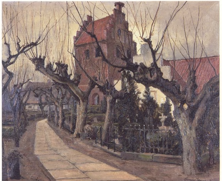
Søllerød Kirkegård. C. Hornung Jensen. Tilhører Søllerød Museum.

Forordningens resultat var, at de velstående måtte begraves udenfor kirken, og at de bønder, der efter at have fået selveje var blevet holdne folk, også blev begravet i faste gravsteder med solide, uforgængelige gravminder af sten. Man begravede fortsat i gravkvarterer, således at "naboer i livet blev naboer i døden" .