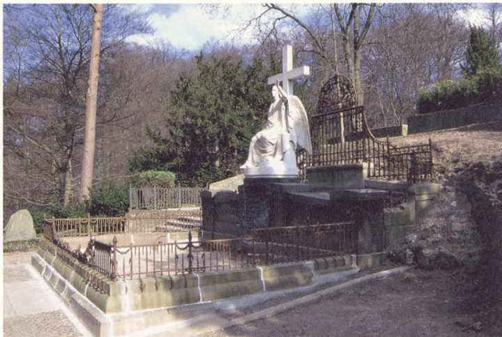
Søllerød Kirkegård Afd. 103, Holmblads gravminde.

for den næste udvidelse af kirkegården, nu langs Søllerød Sø mod vest (vestlige del af afdeling 103 og 104), et skrånende areal, der medstensætninger, terrasser, hække og lange stier fik en tidstypisk ordnet og klassicistisk udformning, ved havearkitekt Erik Erstad-Jørgensen (1871-1945). I denne afdeling blev bl.a. anlagt en snes mausolæer, der giver visse dele en særpræget, nærmest sydlandsk, karakter.