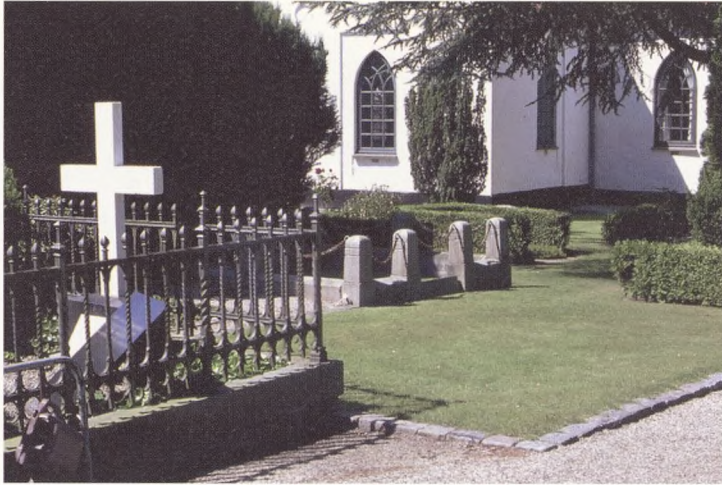
Søllerød Kirkegård Afd. 101

Den middelalderlige kirkegård omkring kirken blev hurtigt fyldt. Allerede 35 år efter forordningen måtte man udvide kirkegården. Det blev nordpå, hvor præstegårdens store avlsgård blev nedrevet – og dermed også markerede enden på kirkens tid som sognets største landbrug. Den nye afdeling 2 (nu benævnt 102, se kirkegårds kortet side 18-19)) blev udlagt i 1840, et aksefast anlæg med en lang nord-syd-akse og en kort tværakse. I krydset blev en mindelund for de faldne i 1864 anlagt allerede i 1865. Mindestenen, der oprindeligt stod på kanonkugler, blev omkranset med lindetræer.