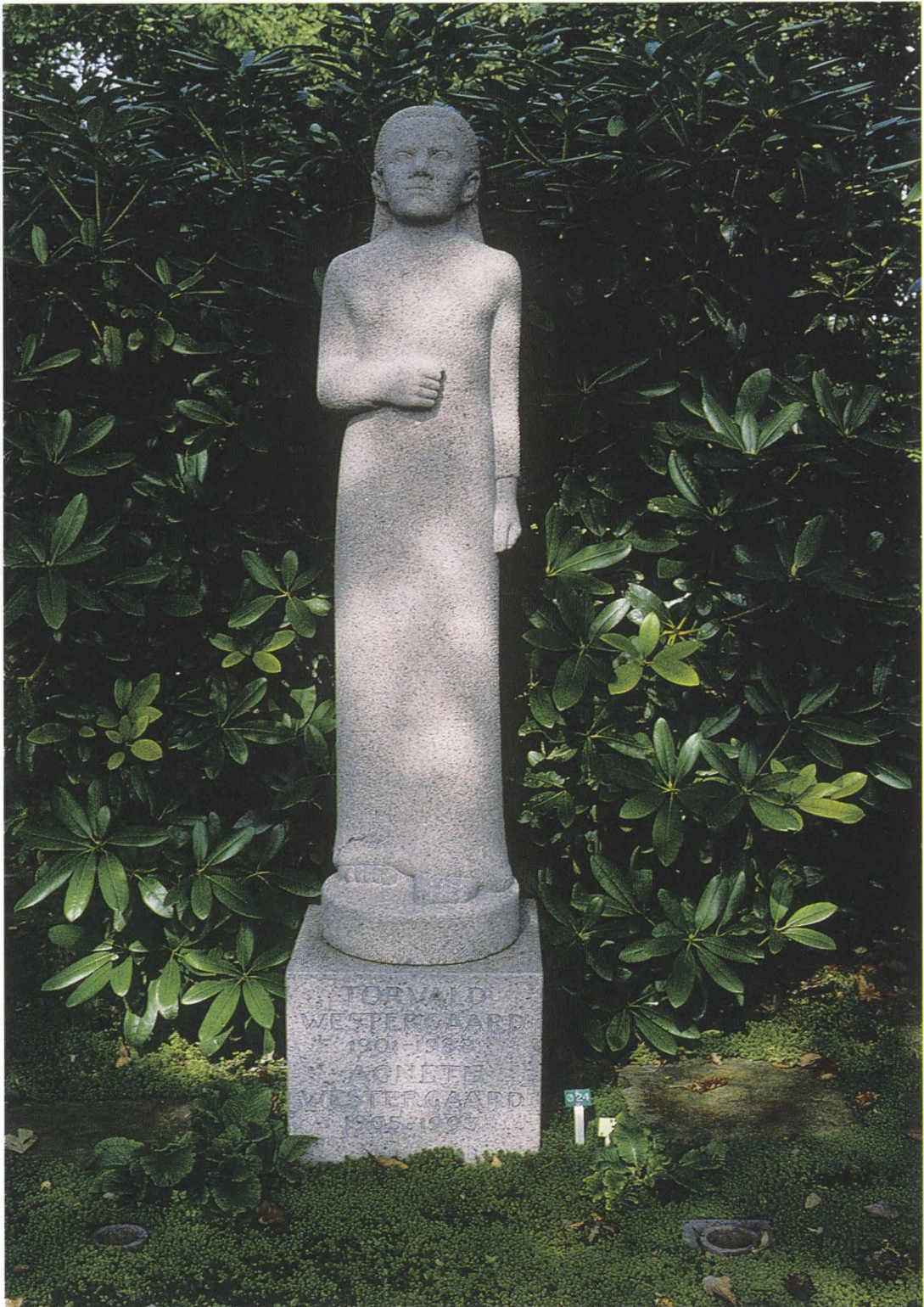
Torvald Westergaards gravsted med stenen "Bernadette". Foto: Lemvig Museum 1999.