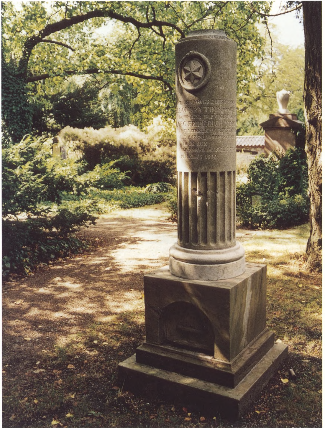
Stemmingsbillede fra kirkegårdens ældste afsnit med gravmæle fra omkring år 1800 over kleinsmedefruen Ulrica Eleonora Timm, en profileret marmorsøjle på sokkel og postament. I postamentet er en niche med et relief af en meget detaljeret bikube – symbol for flid – med flyvende bier.