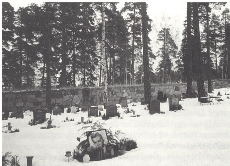
På Skogskyrkogården i Stockholm er der en særskilt indgang til de muslimske grave. Trods en anderledes form falder de fremmede gravsteder smukt sammen med den øvrige kirkegård.

På mange områder er muslimer fuldstændigt integrerede i det danske samfund, de er danskere. Men de er danske muslimer, og det er denne balance, der er vigtig at huske og meget svær at finde, også for muslimerne selv. Netop omkring dødsfald og begravelse har mennesker brug for den støtte, der ligger i det kendte og i at vide, at man gør det rigtige for den afdøde. Derfor er det vigtigt for muslimer, såvel som kristne, at kunne følge deres egne begravelsestraditioner.