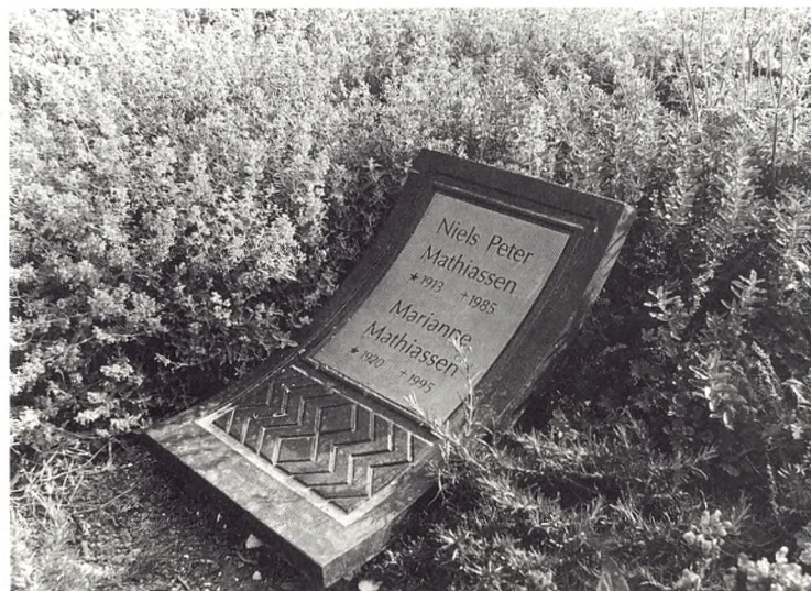
Gravstenene putter sig mellem blomstrende stauder.

Beplantningen har stor betydning i den fælles mindehave. Den skal være det sammenbindende, levende element. Små, løvfældende træer og lave buksbomhække danner et præcist mønster i den sammenhængende planteflade. Mindre stauder og forskellige bundplantninger danner et tæppe, der skaber liv og bringer indtryk af frodighed og giver smukke farve- og duftoplevelser.