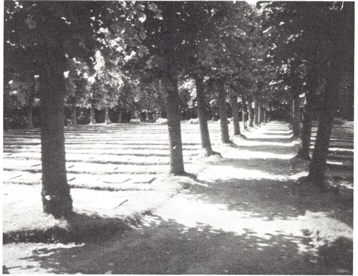
Fin ældre sti i grus

I alle anlæg er det vigtigt at inddrage æstetiske og formmæssige aspekter. Kirkegårdsanlæggenes særlige karakter og funktion skal indgå i overvejelserne vedrørende hver enkelt ændring her.