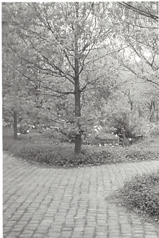
Smukt samspil mellem udformning, materialer og plantevalg.