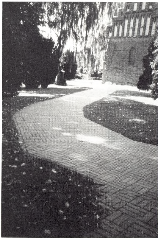
Uheldigt valg af belægning. Både i udformning og materialevalg savnes overensstemmelse med stedets udtryk.