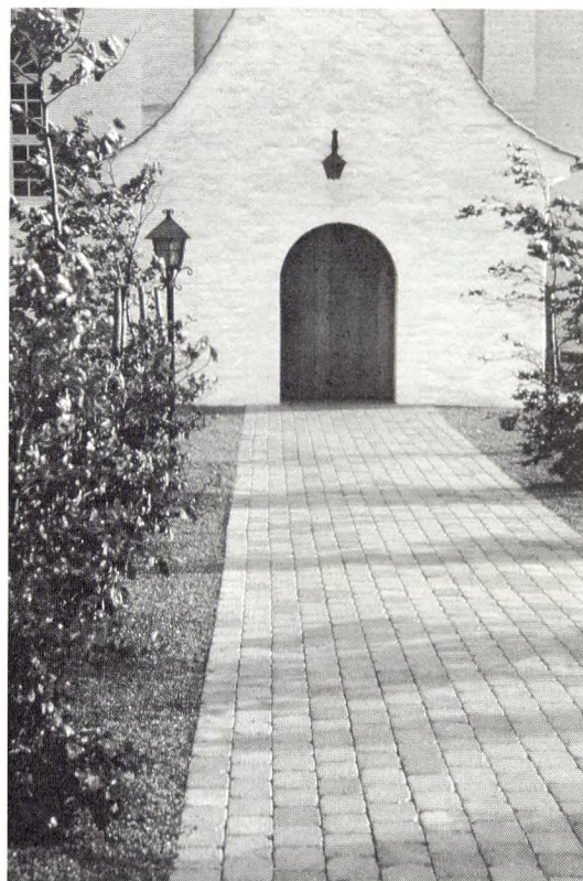
Her er forsøgt, men alligevel truffet uheldige valg. For de samme midler kunne der være nået et mere tilfredsstillende resultat.