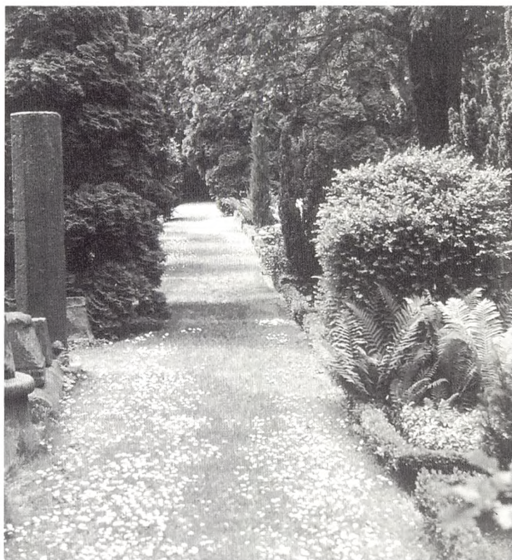
Fin sti i græs