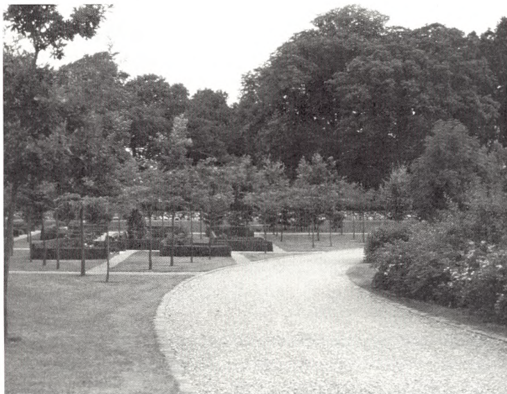
Fin nyere sti i grus.

Men de ældste haver - kirkegårdene - fortjener samme respekt og trænger til denne omsorg. De hører til blandt de ældste udtryk, vores kultur rummer. En kulturskat vi er tilbøjelige til at overse.