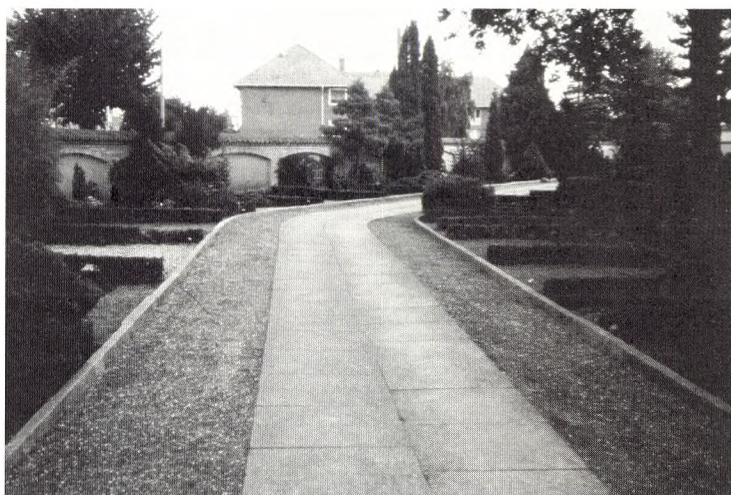
Uheldigt valg. Hverken materialer, proportioner eller detaljeringsgrad er afstemt efter stedets anvendelse.