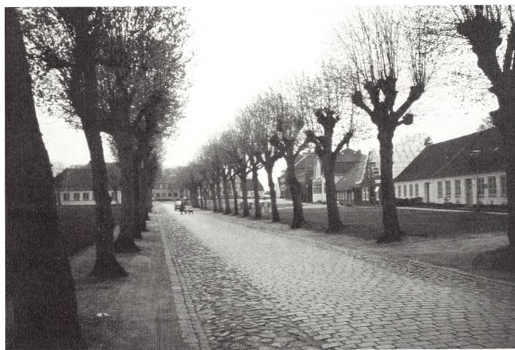
Tidløs belægning, smuk og i overensstemmelse med det lange tidsperspektiv.