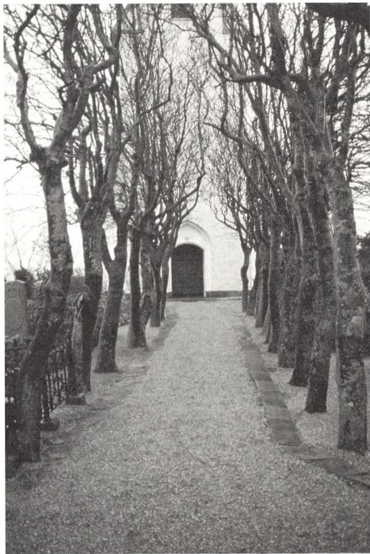
Enkelt, roligt og afklaret. Fyldt med stemning.