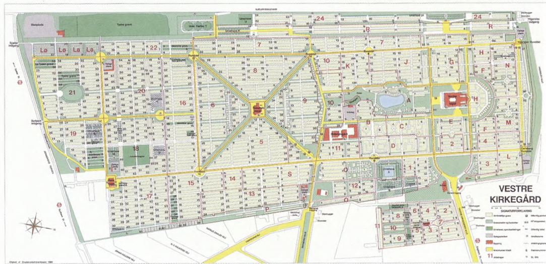
Fig. 1. Kort over Vestre Kirkegård. Udgivet af Stads-konduktørembedet, 1988. Københavns Kirkegårde.

Til brug for registrering af bevaringsværdige gravminder blev udviklet et database-program i samarbejde