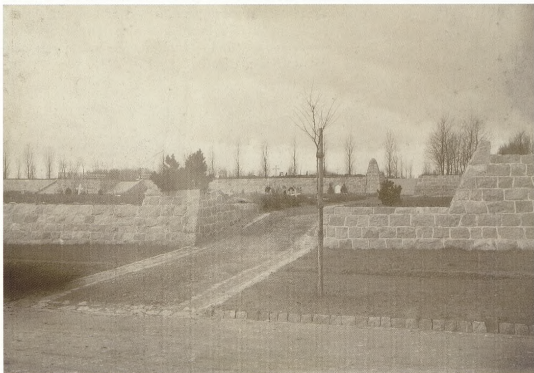
Fig. 2. Ældre foto af terrassemurene på den centrale del af Vestre Kirkegård.

Oberst og rådmand Frederik Abrahamson (1822-1911) som havde tilsyn med kirkegården på magistratens