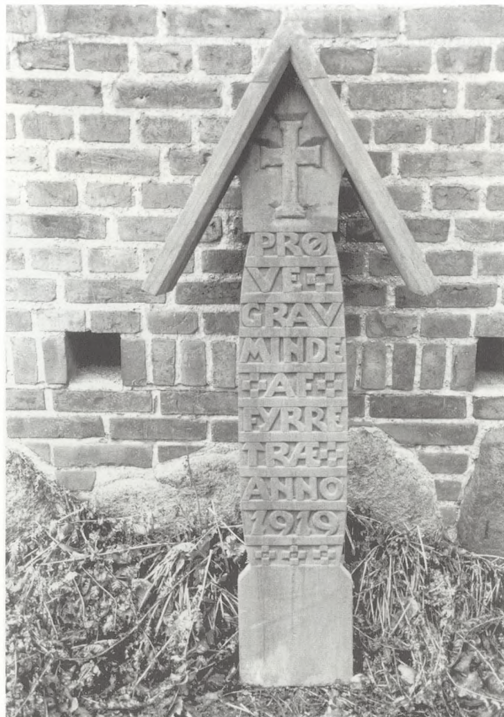
Fig. 9. Opmagasineret prøvegravminde fra 1919.

Der må alligevel være afholdt en eller anden form for konkurrence i 1919, selvom magistraten ikke bevilligede penge, for under registreringen på Vestre Kirkegård blev der fundet et gravminde af træ, som var bevaret af kirkegården (fig. 9). Gravmindet er formet som en smal stele med skråtag og inskriptionen lyder: "Prøve Gravminde af Fyrretræ Anno 1919".