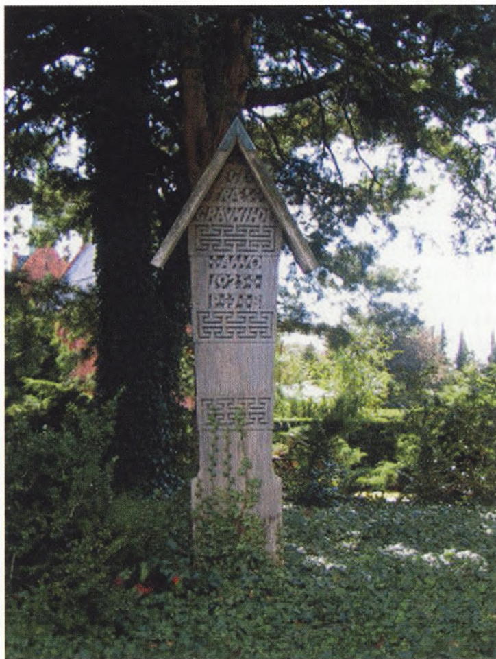
Fig. 8. Trægravminde fra 1925.

Allerede i 1919 ønskede Københavns Begravelsesvæsen at forskønne kirkegårdene ikke ved at anvende censur som i Stettin og Stockholm, men ved det gode eksempel og ad frivillighedens vej, som det også senere var hovedtanken med anlæggelsen af afdeling H-11. Begravelsesvæsenet sendte derfor en anmodning til Københavns Kommunalbestyrelse i efteråret 1919 om afholdelse af en konkurrence, som skulle afholdes i foråret 1920, forslagene skulle afleveres på Vestre Kirkegård inden den 15. april 1920. De indkomne forslag til gravminder skulle opstilles på det tomme areal tæt ved hovedindgangen. De skulle opstilles på kirkegårdens for-