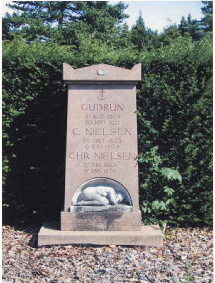
Fig. 6. Monument på afdeling H-11 af Edvard Eriksen. Københavns Kirkegård.

De fleste af gravmonumenterne er tegnet af datidens kendte arkitekter og billedhuggere, som billedhuggeren