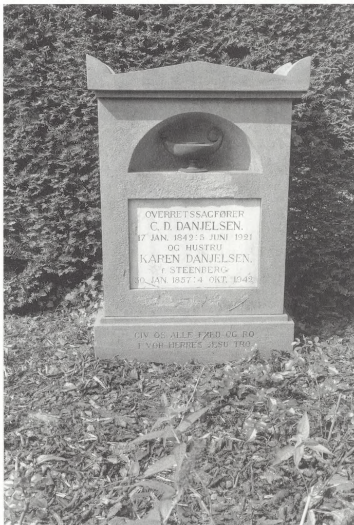
Fig. 5. Cippus tegnet af Alf Cock-Clausen.

Omkring 1920 var der en livlig debat om kirkegårds-kultur. Kirkegårdene gav et forvirret og uroligt indtryk,