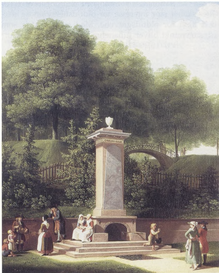
Ill. 1 Jens Juel, 1745-1802: Emiliekilde.

Naturen skal forevige mindet om den døde, som færdes her i lykkeligere dage. Men på dette tidspunkt er det stadig mindesmærker, som opsættes i naturen, mens graven fortsat er knyttet til kirken. På Rathlousdal ved Odder havde Joachim Otto Schack-Rathlou, statsminister 1772-1788, anlagt en romantisk have, her lod han opstille 6 (muligvis 7) sten med latinske indskrifter til minde om vigtige begivenheder i hans politiske liv. Stenene udførtes af billedhuggeren Johannes Wiedewelt. Da Schack-Rathlous eneste og højtelskede datter døde i 1778 udførte Wiedewelt en obelisk, som