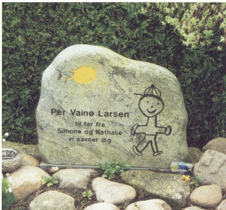
Hørsholm kirkegård, Per Vainø Larsens gravsted, opsat i 1995, udført af Lyngby Stenhuggeri, efter tegning af afdødes børn. Mattæus granit.