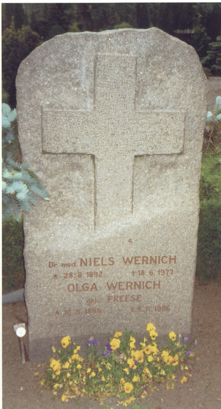
Sct. Marie Sogns Kirkegård i Sønderborg, Familie Wernich's gravsted, opsat i 1977. Udført af Sønderborg stenhuggeri. Kors der er hugget ud af klippen. Ideen har familien fra et andet gravmonument på Sct. Johannes kloster i Slesvig, som familien fik lavet et par generationer tilbage.