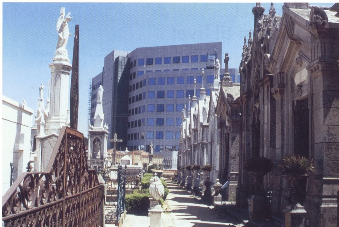
Kultursammenstød oplevet på en kirkegård i Ponto.

Nu 8 år senere er dette blevet en vigtig del af mit arbejde, men det hele begyndte dog først at tage form som mit afgangsprøveprojekt på Kunsthåndværkerskolen i Kolding i 1994.