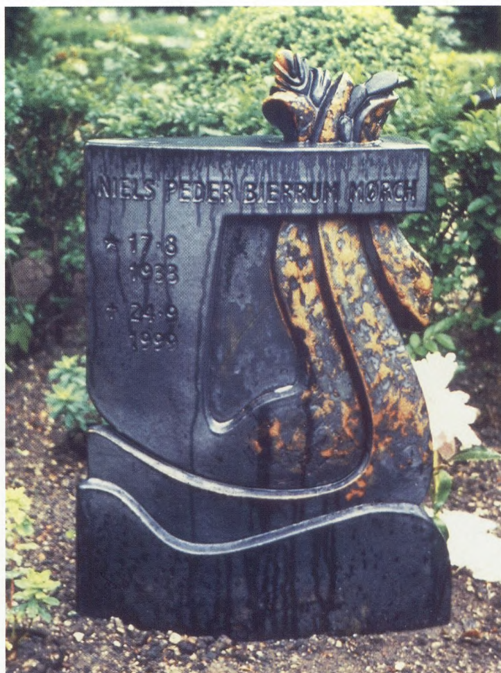
Keramisk gravminde hvor inskriptionens placering er en integreret del af formgivningen.

En anden spændende opgave er et igangværende samarbejde med Roskilde Kirkegårde. På baggrund af den popularitet som den fælles mindehave på kirkegården har opnået, har jeg udført et supplerende forslag. Det drejer sig om en mindre serie keramiske gravminder,