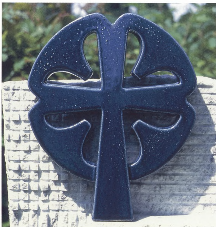
Detalje af gravsten i granit med keramisk kors.

Der findes ingen opskrift på, hvordan et personligt gravminde skal udføres, men hvis man vedtager, at intuition er summen af erfaringer, er intuition et vigtigt element. Jeg har dog en vis form for fremgangsmåde. En indledende samtale fører til en tredimensional skitse i ler, som derefter danner udgangspunkt for selve gravmindet. Det er vigtigt for hele forløbet, at den grundlæggende idé fra begyndelsen er god. Efter samtalen med de pårørende, begynder jeg, ud fra mine notater, en slags brainstorm, hvor jeg ukritisk tegner små skitser,