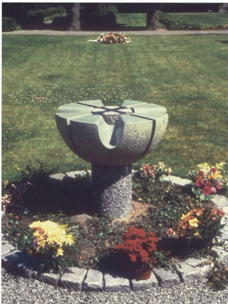
Monumentet ved urnefællesgrav i Hårlev. Keramik og granit.

Jeg har valgt overskriften "Gravmindet - en hyldest til