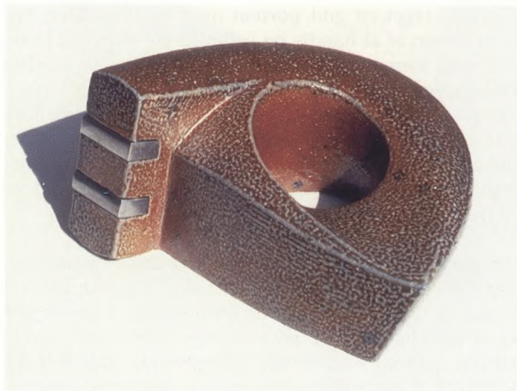
"Den trygge som vil kæmpe". En del af mit afgangspjekt. Keramik og rustfrit stål.

Der foretages interview og samtidig indsamles eventuel materiale, som f.eks. fotografier, personlige genstande, favorit musik og litteratur. De indsamlede fakta komprimeres til