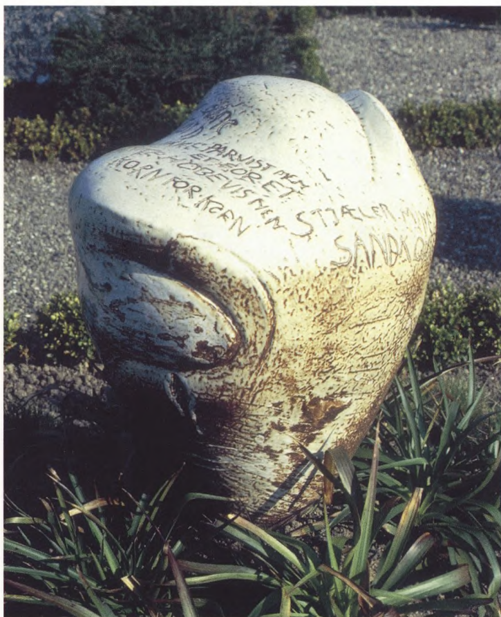
Eksempel på skrift som er ridset direkte i leret. Keramik.

Gravmindet opleves forskelligt, alt efter om man er slægtning eller en tilfældig besøgende på kirkegårdsvandring. De symboler man tidligere anvendte for at understrege en persons særlige egenskaber eller interesser, er gået af mode. Tabet af disse indforståede tegn som kommunikationsredskab, har gjort monumentkulturen fattigere. Symbolets værdi som repræsentant for en kompleks historie er interessant. Det spændende for mig er at integrere symbolik i gravmindets formgivning på en nutidig måde. Når det lykkes, kender de pårørende både fortællingens store sammenhæng og detaljernes "rigtige" fortolkningsmuligheder. Den tilfældigt forbigående ledes "kun" på vej til en fornemmelse.