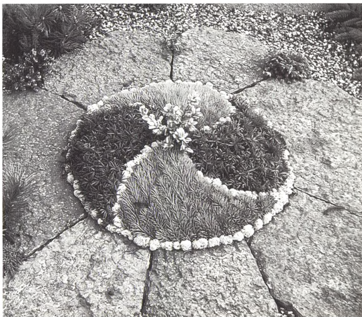
Eksempler på kunstfærdig grandækning fra 1960'erne.

På det tidspunkt var alle kirkegårdsledere - på nær nogle få kommunalt ansatte - og alle landsbygravere entreprenører, så ledelse og ansatte havde en fælles interesse i at skabe et nyt marked med nye indtjeningsmuligheder for såvel entreprenørerne som deres ansatte. Man begyndte så at udvikle og markedsføre granudsmykningen.