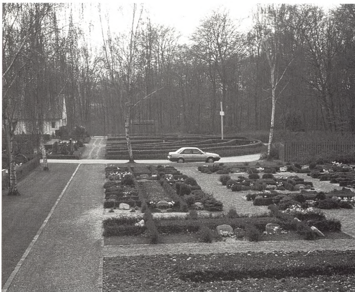
Er bilen det eneste, der gør kirkegården personlig?

Men det er blevet mindre socialt acceptabelt at inddrage andre i ens sorg. »Fællesskabet« har afskrevet døden som dets anliggende - og er dermed ophørt af fungere som fællesskab. Det afspejler sig i begravelses- og kirkegårds-kulturen. Begravelser og bisættelser privatiseres, kirkegårdene anonymiseres. Som døden er afskrevet, er også de døde afskrevet som fællesskabets anliggende. De døde æres ikke mere - i hvert fald ikke mere end ansændigheden kræver, og den kræver mindre og mindre. De efterladte sniger sig ud på kirkegårdene, frysende ensomme i deres sorg - undertiden endda uden et sted at fæste den.