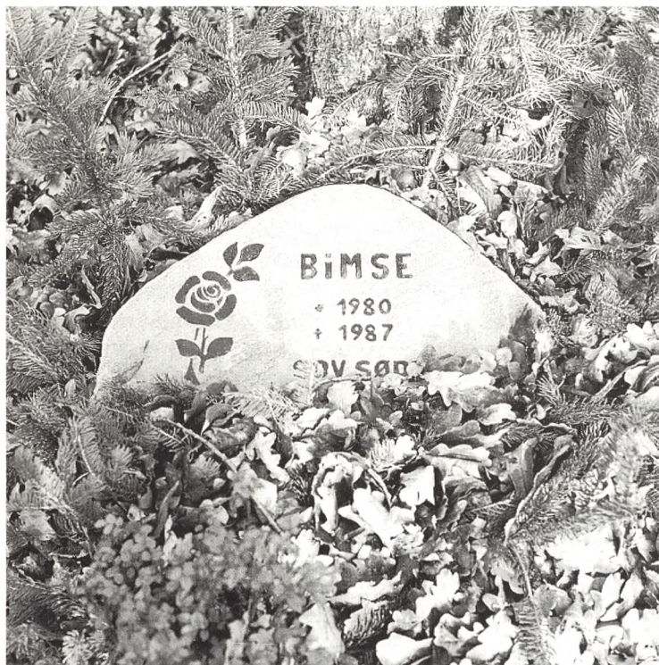
Fra Dyrenes Gravplads i Kolding.