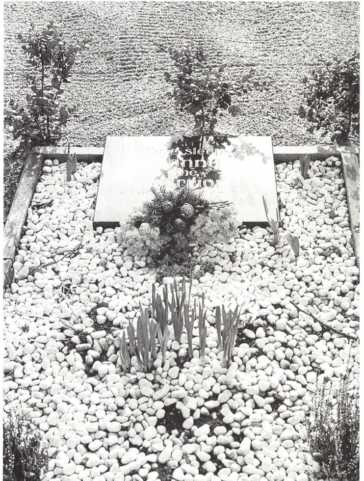
Fra Dyrenes Gravplads i Kolding.

fællesskabs-anliggende. Lad mig tilføje, at jeg mener ikke, at udtagelse af organer fra en død er udtryk for mangel på respekt for den døde; men måden, hvorpå der argumenteres derfor, opleves som en reduktion af de døde. Somom de døde ikke have nogensomhelst interesse eller betydning for de levende mere, når deres hjerne er ophørt med at fungere. Somom ritualerne omkring dødsfaldet og begravelsen/bisættelsen og gravstedet er udtryk for sentimentalitet. Og sådan svarer argumentationen alt for godt til den mangel på kultur i forhold til dødsfaldet, som jeg har nævnt ovenfor. Margrethe Auken gengav i en artikel en fornuftig læges reaktion på en avis-overskrift, der lød SUNDE ORGNER TIL SPILDE. »Ja, tænk -« sagde han »de bli'r begravet!«