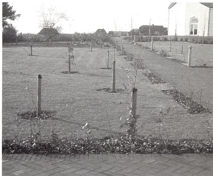
Hjerting kirkegård.