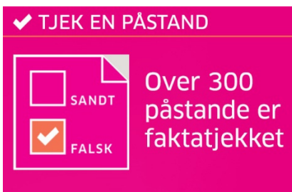
Figur 3. Fra Mandag Morgens Tjekdet.dk

Mandag Morgens Tjekdet.dk bruger kategoriseringen "sandt" og "falsk", men ender i praksis ofte med andre mærkater som for eksempel "vildledende" eller "bliv ikke bundet en historie på ærmet".