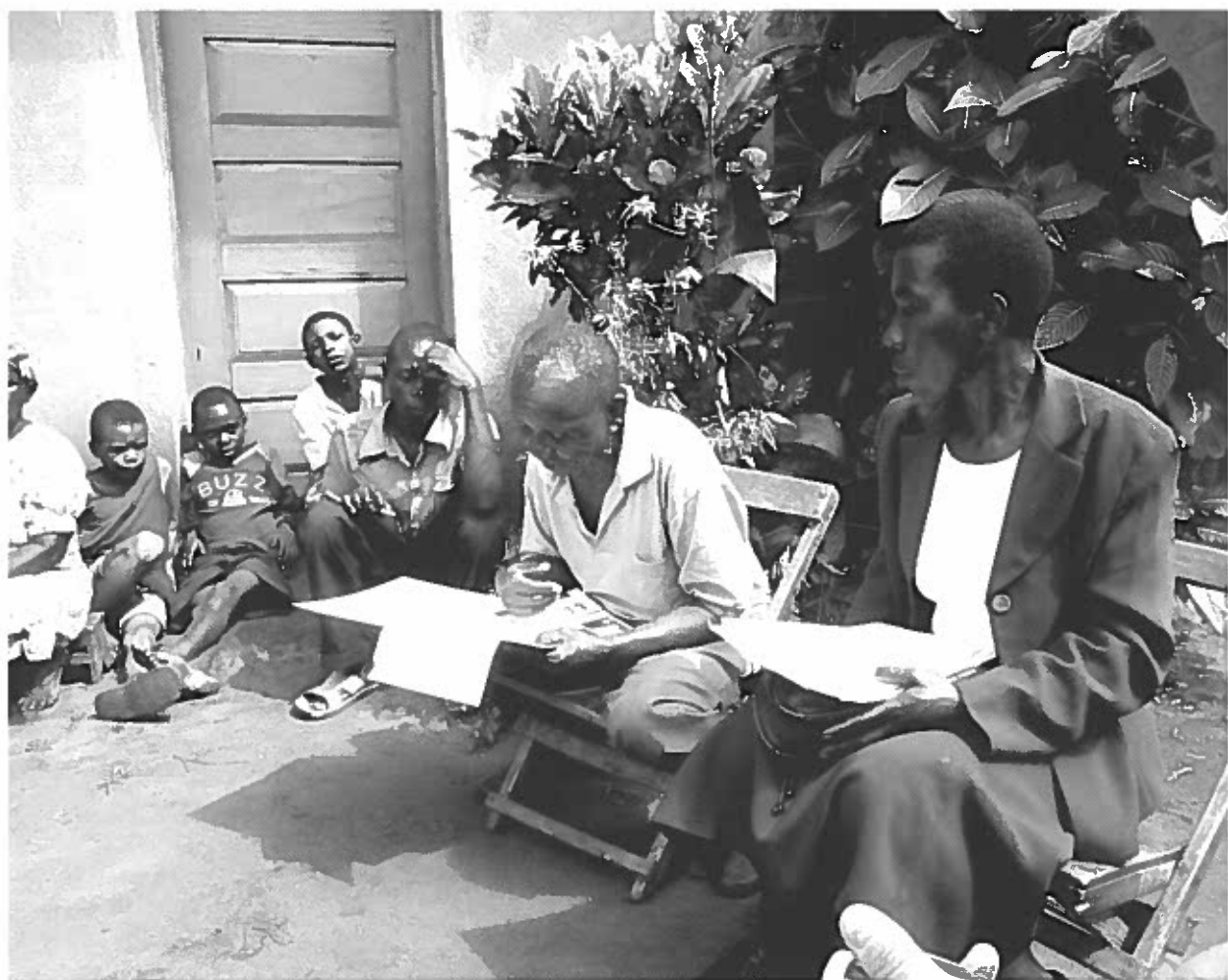
En af landmændene i gruppen fremlægger sine planer, som derefter diskuteres i hele gruppen.

som igangsættes blandt andet af Food and Agriculture Organisation under United Nations (FAO; FNs fødevarer- og landbrugsorganisation), og som har et mere fastlagt curriculum. I dette projekt bliver gruppen overtaget af en intern facilitator efter en periode på 6-8 måneder. Gruppen vælger den interne facilitator blandt dens egne medlemmer, og vedkommende oplæres af facilitatoren. Der er ingen donationer forbundet med dannelse af en gruppe, og projektet har ikke givet ikke penge til