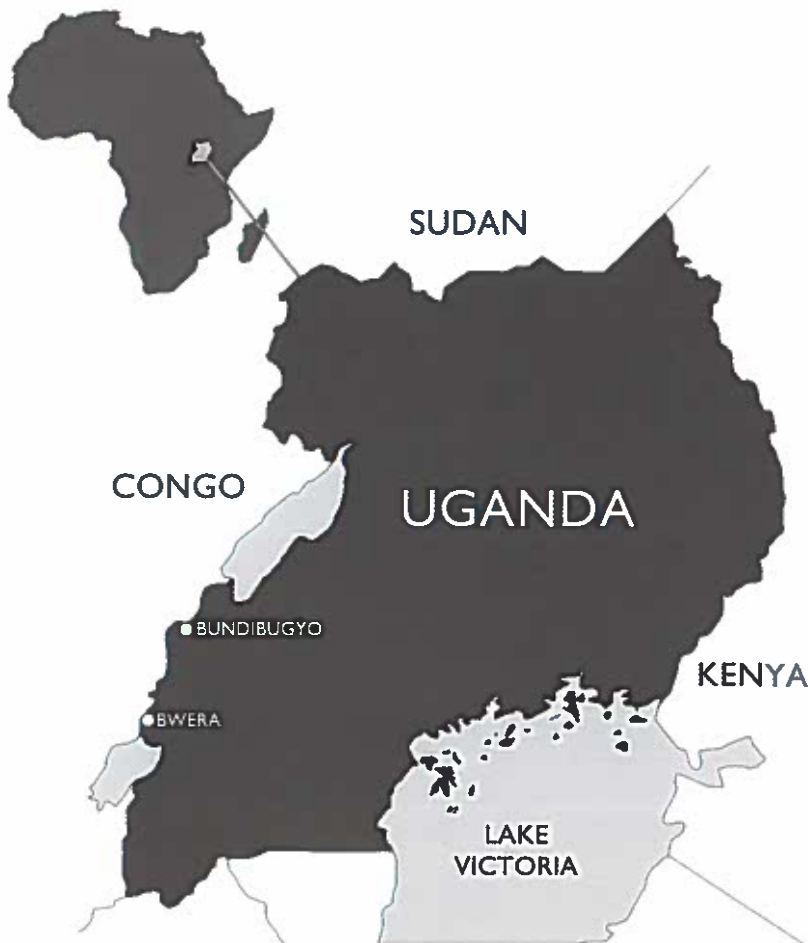
Landmandsgrupperne befinder sig i Vest-Uganda, i Rwenzori området op mod grænsen til DR Congo.

devarsikkerhed, og handlinger, som holder folk i fattigdom, skal ændres igennem menneskers samarbejde om at forandre deres egne relationer og miljøer. Mune- ne fremhæver, at mennesker ikke bærer ansvaret for at være født ind i fattigdom, men alle mennesker har ikke desto mindre et ansvar for at komme ud af fattigdommen. Deres beslutninger er helt centrale for dette. Som menneske kan man træffe kloge eller mindre kloge beslutninger. Mange af disse beslutninger handler om,