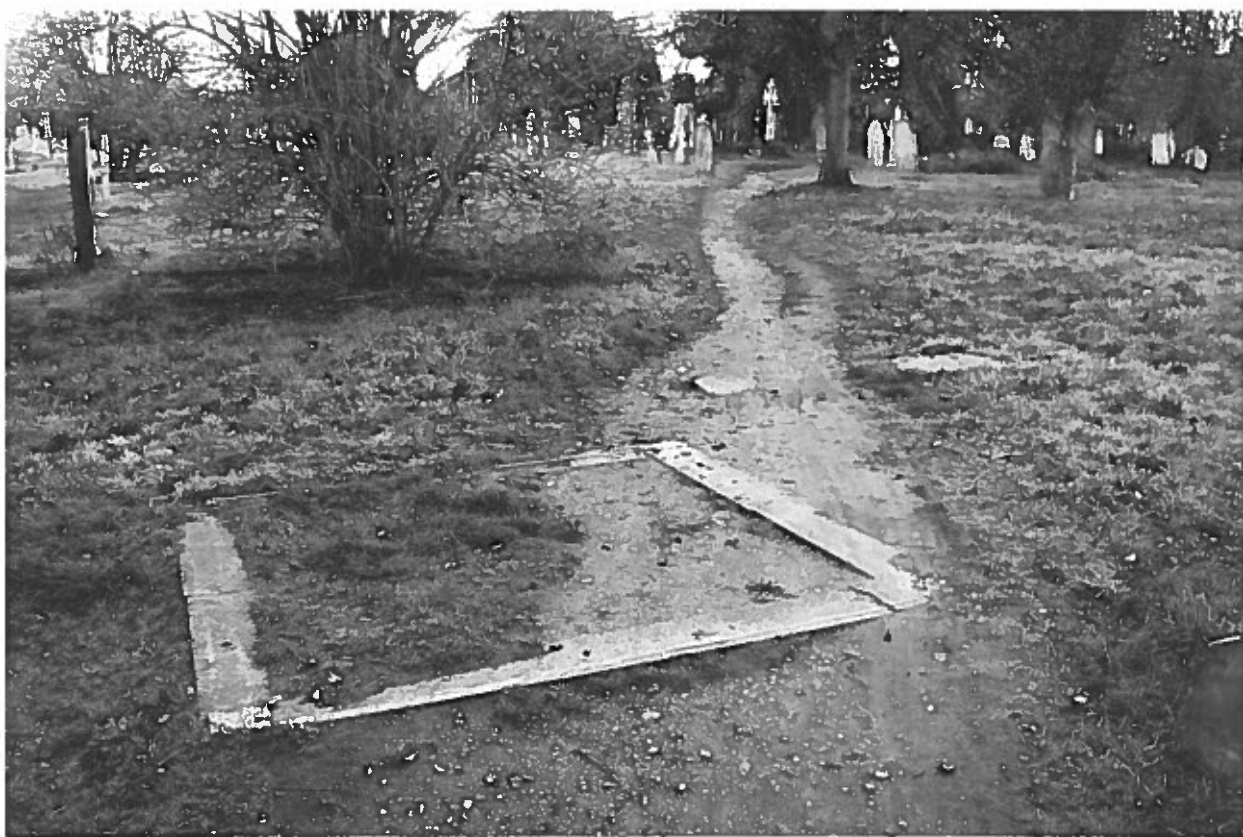
Gravstedsramme og sti.

ner eller historiske kilder. Det andet formål er at række ud over arkæologien og vise, at arkæologiens behov for at fastfryse ting ved at datere, typologisere og konservere dem frarøver tingene deres liv som sociale og stoflige fænomener.