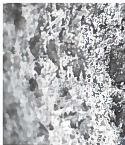
Gravsten overgroet af lav.

verden, indvirker på menneskers brug af ting. Arkæologien kan defineres som studiet af materiel kultur, men det er samtidig også en disciplin, der er nødt til at gøre sig forgængeligheden og fraværet af ting bevidst. Ingen arkæologisk empiri er nogensinde fuldstændig, og arkæologisk arbejde er således helt grundlæggende ensbetydende med at arbejde med fravær og med delvise tomrum efter tingenes forsvinden. Spørgsmålet er imidlertid, hvordan man undgår, at disse tomrum bliver til tomhed.