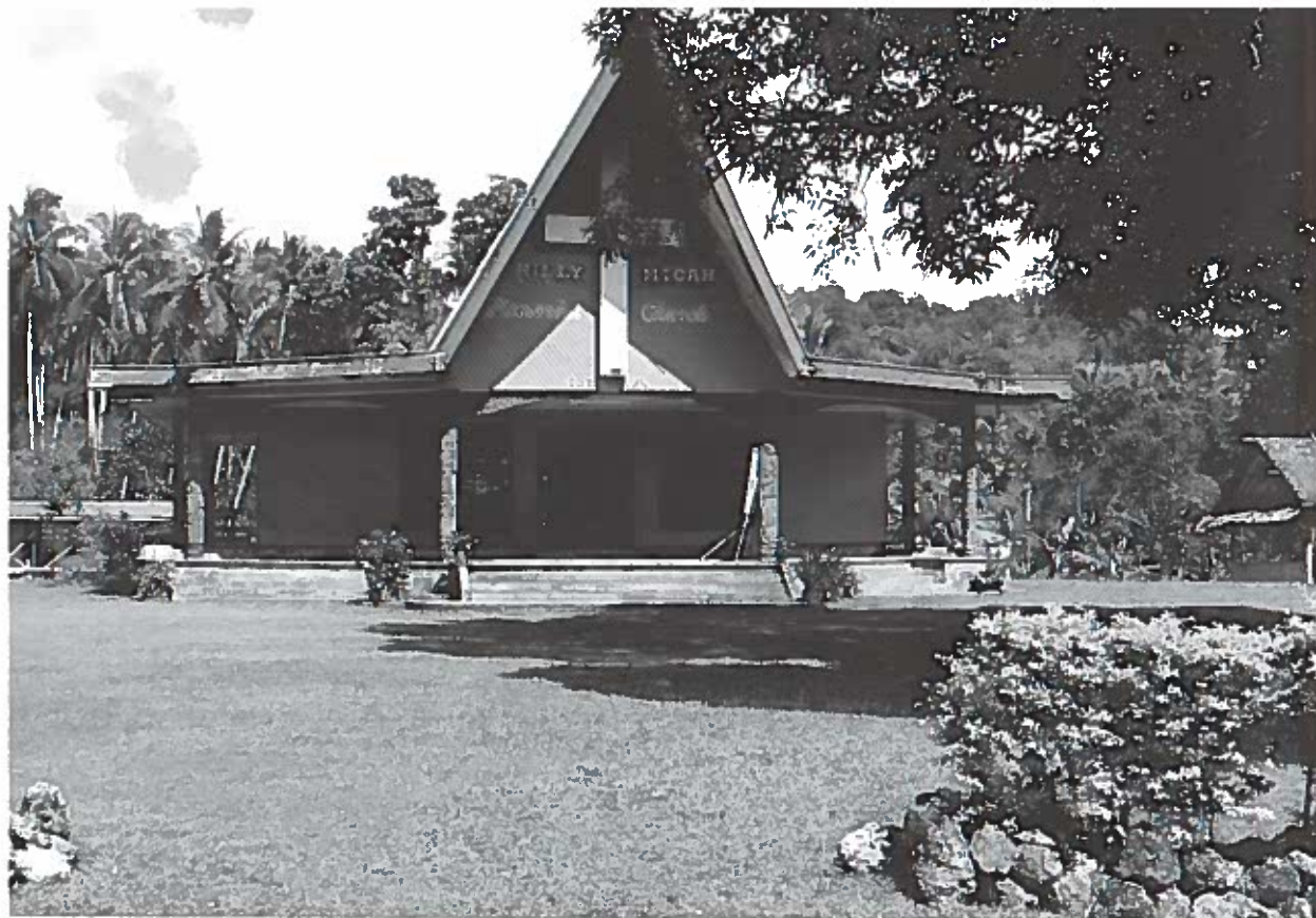
På denne kirke i landsbyen Libba er søjlerne traditionelle og moderne malanganmotiver.

såsom de lederskabstitler man havde opnået. Når en træskærers 'kunde' så ønskede en malangan udført over en bestemt slægtnings minde, ville træskæreren få beskrevet de symboler og motiver, som tilhørte denne person. Hvor malangan derved indebar en form for intellektuel ejendomsret, påpeger især yngre træskærere dog i dag, at det nu står enhver frit for at kopiere andre slægters symboler uden at frygte for krav om kompensation. Produktionen af malangan for turister indebærer ikke de samme farer for at blive ramt af forfaderånders forbandelser, som det ellers er tilfældet med 'den rigtige vare'.