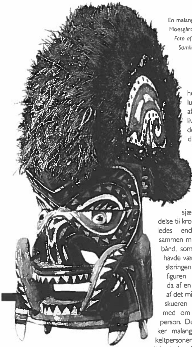
En malangan købt til Moesgård Museum.