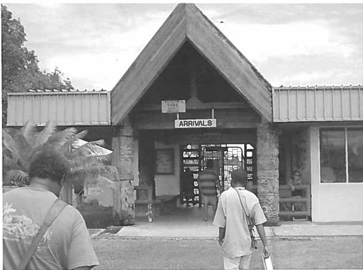
Søjlerne i lufthavnens ankomstområde blev anledning til stor debat, da håndværkerne, som havde lavet dem, på nær en enkelt, døde af sygdom inden for få år efter søjlernes tilblivelse.

han vil. Det er op til ham, om han vil gemme den i mandshuset og bringe den frem på ny næste gang, der er behov for en ceremoni. Eftersom der i dag kun er få kompetente træskærere, er den form for genbrug tilsyneladende foretrukket frem for destruktion. Ligeledes er der stor variation på ritual praksis omkring malangan. Gennem interviews lærte vi, at nogle landsbyer ikke praktiserede afbrænding af malanganfiguren men i stedet begravede den.