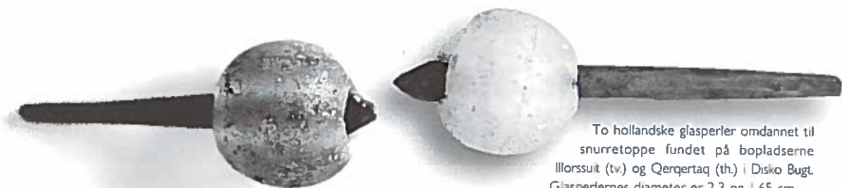
To hollandske glasperler omdannet til snurretoppe fundet på bopladserne Illoorsuit (tv) og Qerqertaq (th.) i Disko Bugt. Glasperlernes diameter er 2,3 og 1,65 cm.

En gang i 1700-tallet endte et par hollandske perler efter en lang rejse som legetøj højt mod nord i Grønland. Både glasperler og andre europæiske ting blev brugt og opfattet på mange forskellige måder af inuit. Tingenes livsforløb og betydning var stærkt påvirket af de lokale kulturmødes længde og karakter. Især var det afgørende, om inuit var i direkte kontakt med europæerne eller kun med deres ting.