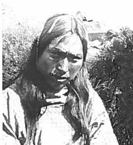
Mand fra Ammassalik iført hårgrime med påsyede glasperler fotograferet år 1900. Hårgrimer er et sydøstgrønlandsk fænomen, og glasperlerne bruges derfor i en dragtdel, der signalerede en regional identitet og til tider indeholdt amuletter.

Snurretoppe med glasperler kendes ikke fra andre steder i Grønland, men findes i mange udgaver i træ. Leg med snurretoppe trænede børnenes finmotorik og