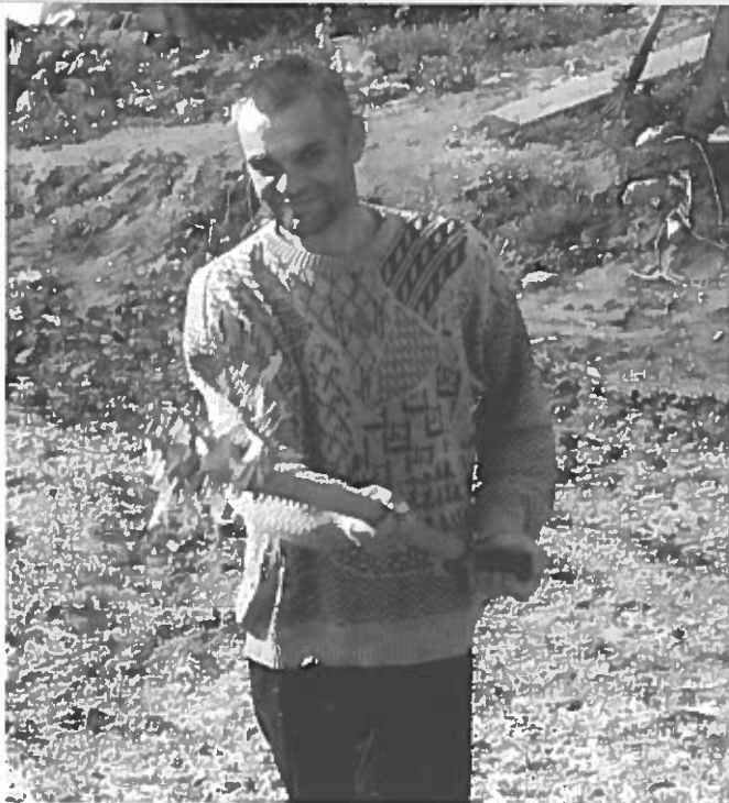
Gårdarbejde (billede taget fra traktor), Litauen, 2007.

gativt, vil blokere vores forståelse af lande, hvor disse elementer er en integreret del af samfundsordenen. Dette er vigtigt at holde sig in mente, når man kigger på Litauens historie gennem de sidste årtier. I en tid hvor der ikke var klare retningslinjer for den nye businesskultur, og hvor politiet var korrupt (blandt andet fordi de prøvede at kompensere for lave lønninger og vanskelige arbejdsforhold), fungerede mafiaen som ordenshåndhævere i forretningslivet. De inddrog gæld og de beskyttede mod overfald fra andre grupper. De havde også en funktion som mæglere i stridsspørgsmål hvor man, med de rette forbindelser, kunne kontakte dem og bede om hjælp.