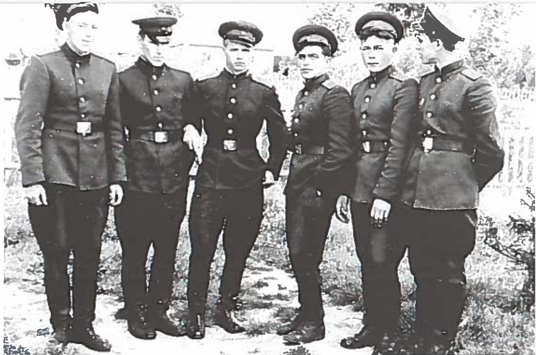
Unge soldater i den sovjetiske hær, omkring 1960.