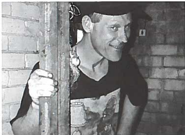
Gaardarbejder, Litauen, 2004.

de havde krævet, at han skulle betale penge for at få den tilbage. Han måtte ikke gå til politiet, sagde de. Han henvendte sig alligevel til politiet, og samme dag blev bilen brændt. En af politimændene havde altså været stikker og givet banditterne besked om henvendelsen. "Så hvem er politi, hvem er bandit?" lød spørgsmålet.