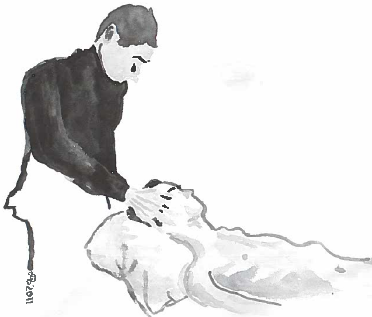
Akvarel af Bjørn A. Bojesen.