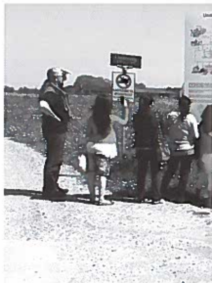
En tur til en lokal bebyggelse, der bygger på solenergi, det skal lære de studerende miljøbevidsthed.

danske arbejdsmarked, argumenterer han, må udlændinge lære disse færdigheder.