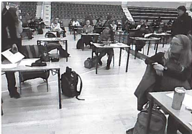
Studerende venter på at tage den afsluttende eksamen i 'Dansk 3'.