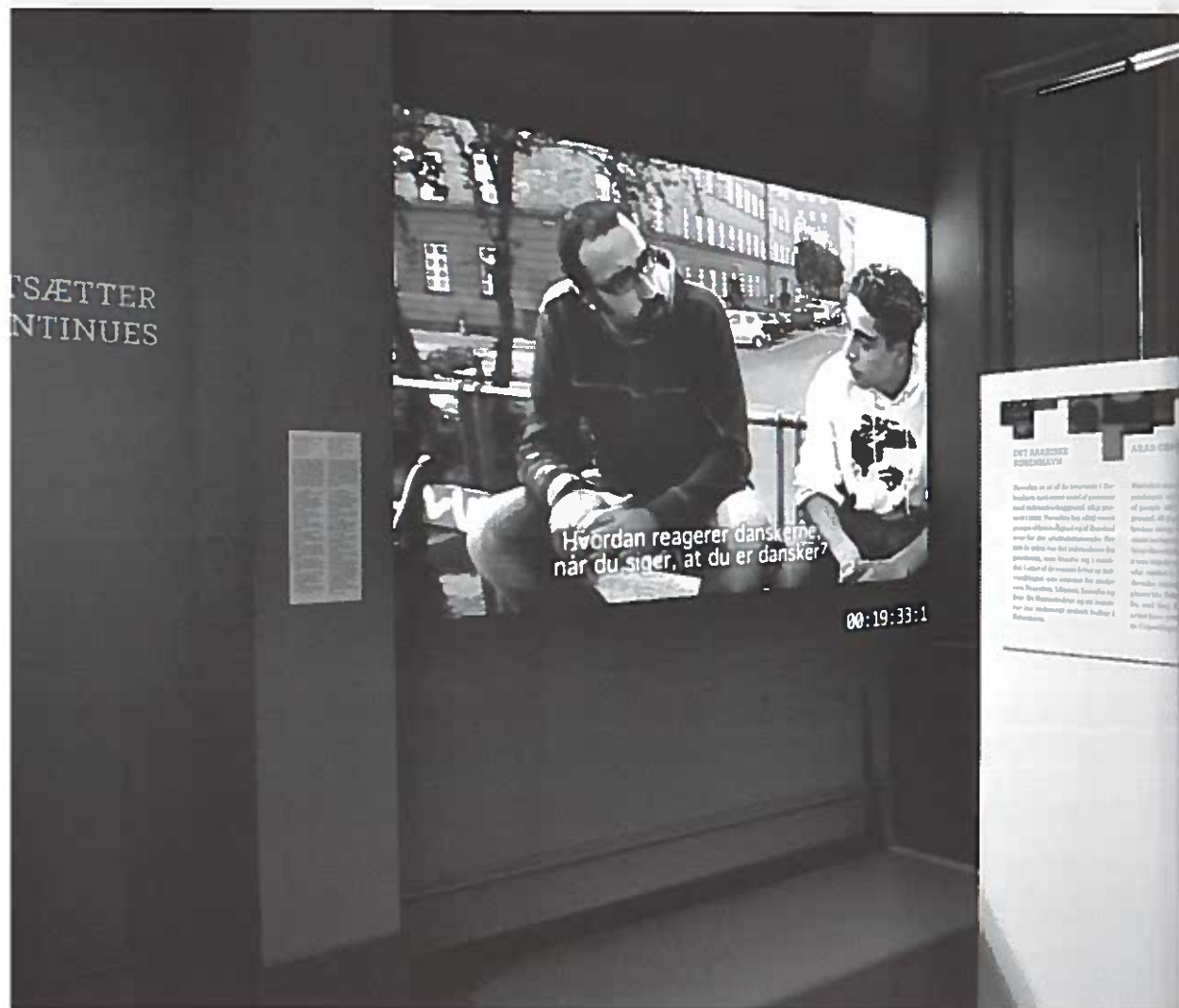
Klip fra dokumentarfilmen 'En araber kommer til byen'.

det arabiske sprog og det at være muslim. En araber er altså ikke kristen eller jøde. Forbindelsen mellem at være araber og muslim er en, der forekommer i filmen, ikke i udstillingens tekster. Kombinationen af filmens store nærvær og den overfladiske udstillingstekst gør, at det bliver genstanden og ikke udstillingsteksten, der definerer, hvad det arabiske København er.