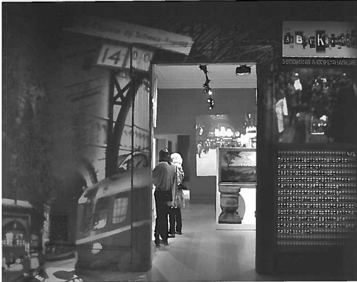
Sådan ser det ud når man træder ind i "At blive københavner"-udstillingen.

også fra Jylland såvel som fra Øst-europa, Holland og Pakistan. "At blive københavner" skaber altså en fortælling om København, der adskiller sig fra den fortælling om Danmark, vi ofte har mødt i debatten om indvandring, her eksemplificeret ved Pind og Haarders kronik. Det betyder dog også, at problematiserede identiteter såsom muslimske identiteter nedtones og træder i baggrunden i forhold til den københavnske identitet. Denne artikel handler om, hvordan indsamlingstraditioner og ønsket om at nuancere og genfortolke indvandringskategorien afspejler sig i ud-