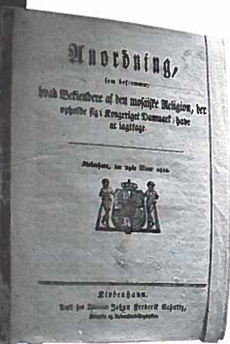
Den første og generelle fremstilling af jøder i udstillingen.

måtte man fastholde jøderne i rollen som en særskilt etnisk gruppe.