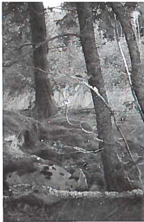
En heks finder inspiration til aftenens ritual i skoven.

mange associationer og trækker ligeledes tråde tilbage i historien: Vi kender den historiske heks, den sociale syndebuk, der blev brændt på bålet beskyldt for at have forgjort mælken, lavet pagter med djævlens eller kastet en forbandelse over retsrafne folk. Men vi kender også hekse fra eventyr, hvor de optræder som krumryggede, tussegamle koner der bor dybt inde i skoven, forgabt over boblende gryder med grønne væsker. Og vi kender Sankt Hans heksen som vi, til mange tilflytters store overraskelse, brænder af i fællesskab og glæde til tonerne af Shubidua. Endeligt kender vi den idealiserede heks, som blev bannerfører i feminismens kamp om kvindernes frigørelse: Heksen som symbol på den nøgendansende livsnyder, der både tør og