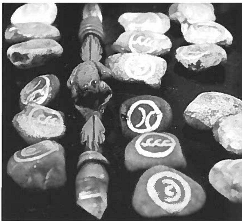
Hekseruner og en energistav som bruges til forskellige magiske formål.

findes tre grader, som den enkelte heks kan initieres i, og ritualerne ved disse initieringer er hemmelige. Før man initieres i 1. grad er man neophyt, en lærling, og denne status og periode gennemgås for, at både lærlingen og gruppen sikrer sig, at vedkommende virkelig vil være en del af cirklen. Centralt for hele cirkelns arbejde og magiske praksis er loven om "Perfect love and Perfect Trust", hvilket ideelt set betyder at alle i cirklen skal stole fuldstændigt på hinanden og nære ubetinget kærlighed til hinanden. Eklektiske heksecirkler og andre mere frit organiserede cirkler har typisk to til seks medlemmer og mødes ofte en gang om måneden, hvor de fejrer sabbatterne og hylder årets gang. På trods af de mange forskellige orienteringer indenfor mil-