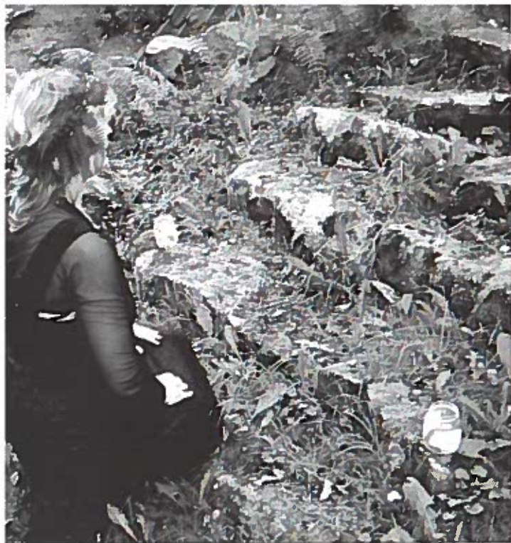
Heksen Hexe Hedenlil foran de syv porte til dødsriget.