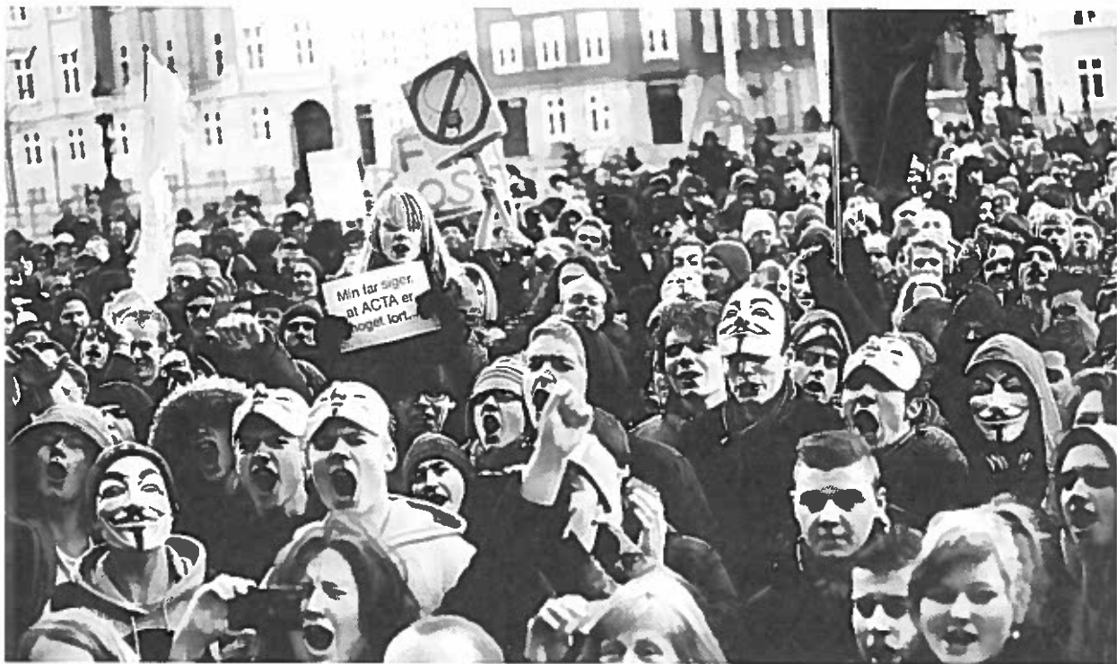
Demonstration mod ACTA i København.

ret meget i handlingsforløbet: Hele filmen bygges op til, at V vil sprænge parlamentet i luften d. 5. november, hvilket var dagen, hvor Fawkes forsøgte at udføre sit Gunpowder Plot. Ligesom i tegneserien beretter V gennem en tv-transmission, hvorledes det er folkets skyld, at fascisterne har magten, og at de ikke kunne besidde den uden folkets samtykke. Netop dette fællesansvar er centralt i forståelsen af maskens symbolværdi.