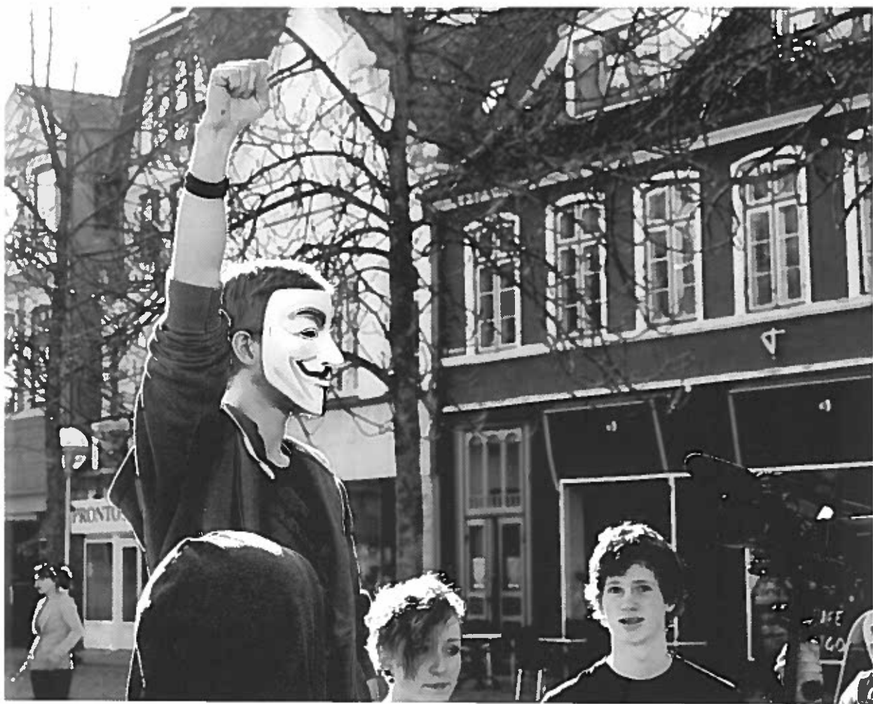
En ung, ukendt demonstrant ræber deres kæmpe: "Med med AGTA – We Will Win!"

Denne tradition har været vedligeholdt i over firehundrede år, og for at den ikke skulle glemmes, fik det engelske kongehus i 1700-tallet udformet et rim, som kunne hjælpe befolkningen med at huske den: