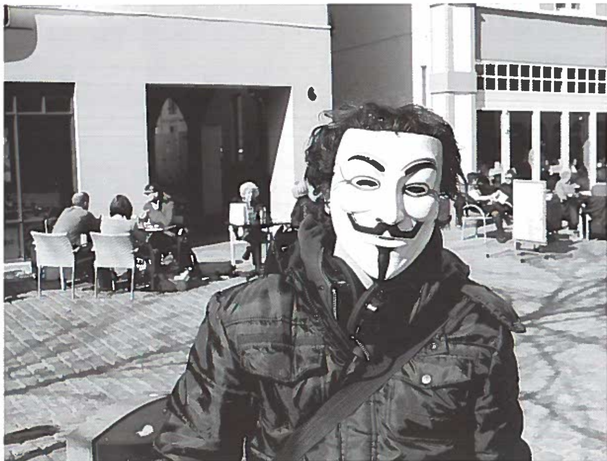
Demonstrationens planlægger iført Guy Fawkes-maske.

også flertallet. Det totalitære styre, som V bekæmper, er minoriteten, der kontrollerer majoriteten. Således er det hans kamp at fremme de politiske og materielle vilkår for folket. Det er med denne baggrund, at masken er blevet så udbredt i Occupy-bevægelsen, der netop bryster sig af at være flertallet; "We are the 99%".