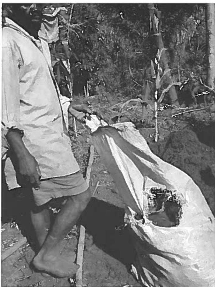
Liget er blevet puttet i en hullet pose.

mange forskellige familier lå begravet. På sin vis forblev disse døde internt fordrevne, da de blev forhindret i at hvile side om side med deres forfædre.