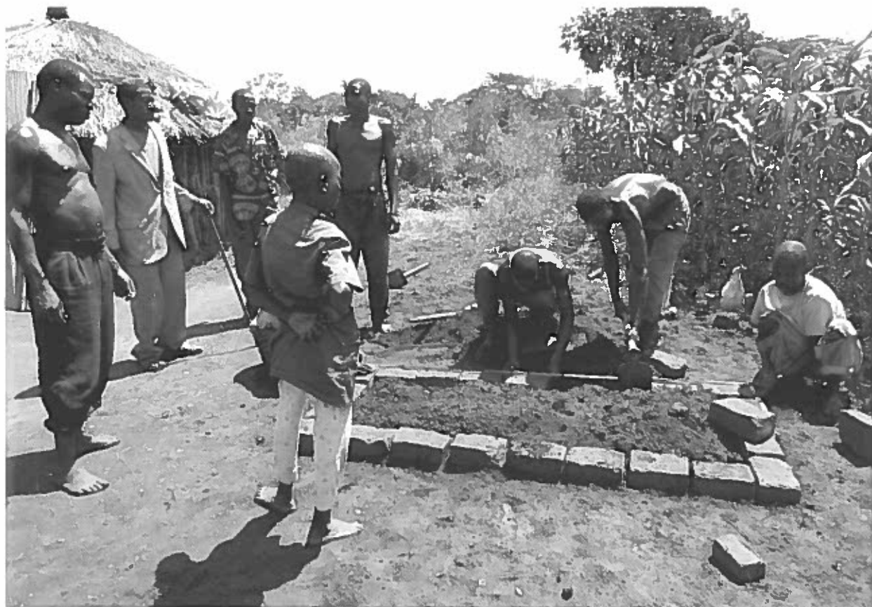
Den færdige grav, omkranset af omhyggeligt placerede mursten.

ged ofres og nogle få klumper af gedens halvfordøjede maveindhold drysses i den tomme grav. Jeg spørger, hvorfor det kan være, men får kun svaret, at "det er acholi-tradition".