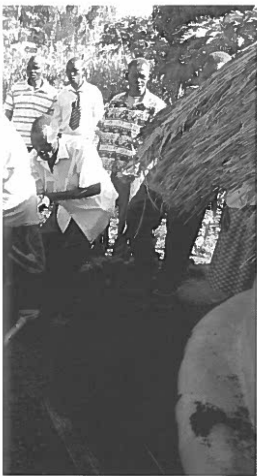
Opoka løftes op af sin grav.