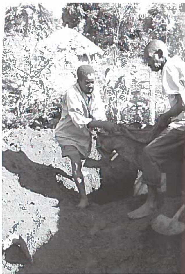
En mand er i færd med at opgrave Opokas jordiske rester. I hullet anes et hulrum, skabt af den rådne kiste.

mistet familiemedlemmer, og nogle har stadig børn, der formodes at være 'i bushen' med LRA. De ved ikke, om børnene er levende eller døde.