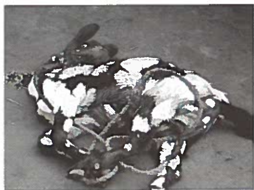
Den obligatoriske ged er blevet ofret. Prisen for en ged er en af grundene til, at mange har problemer med at få genbegravet deres famillememmer.

efter kan de fire mænd løfte Opoka op af graven. Seksten år i den røde jord har reduceret hans krop til knogler, og da knoglerne stadig er svøbt i det blå stof, er der ikke