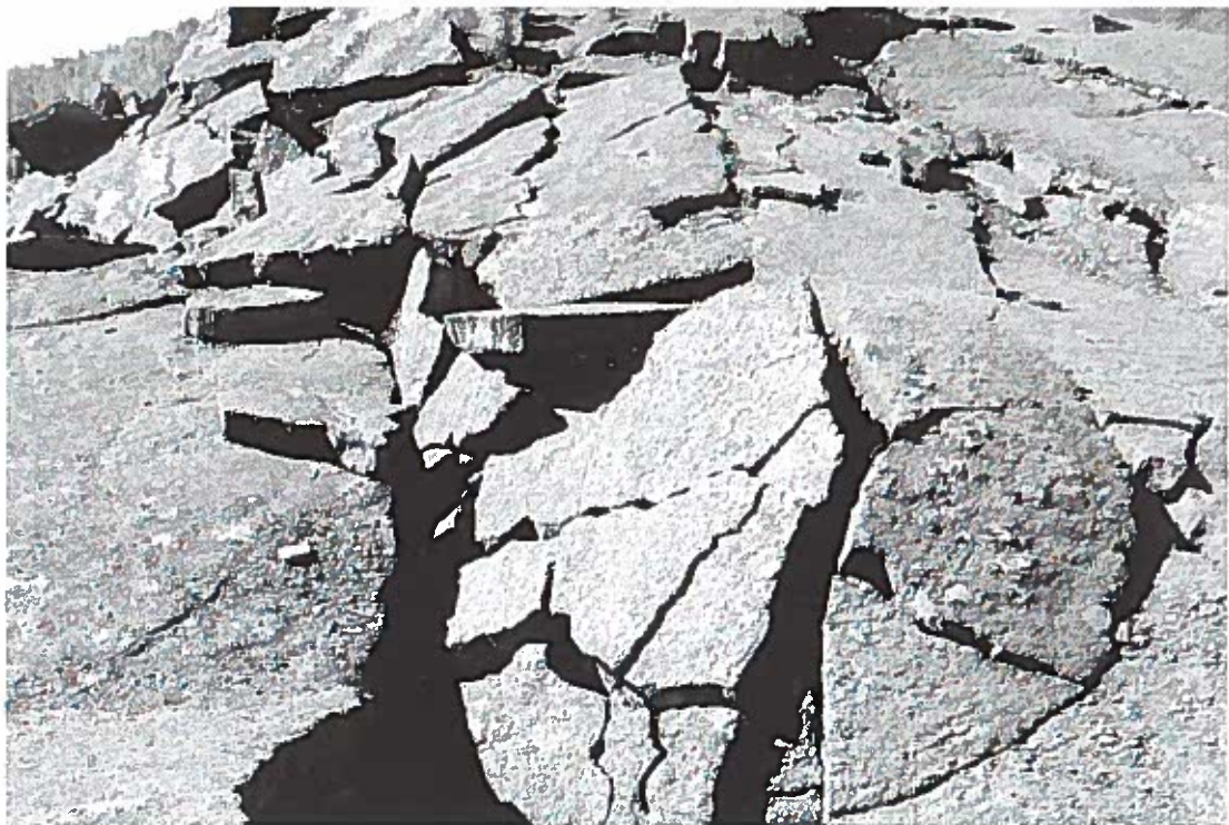
Hawai'i Volcanoes National Park.

tager parken for givet og opfatter den som et sted, hvor de altid kan tage hen. Det er bare ikke et sted, de faktisk tager hen, med mindre de har gæster fra fastlandet. Det ville være nærliggende at konkludere, at også entreen afholder den lokale befolkning fra at benytte parken. En ugebillet koster $10 pr. bil, et årspas $25. Selv så beskedne beløb kan skabe en barriere, især når man tager i betragtning, at der er gratis adgang til de fleste andre naturlandskaber på øen. Men betalingsprincippet handler også om USAs profittering af Hawai'i øerne: "Hvorfor skal vi lokale betale for at se vores egen baghave?" spurgte en kvinde fra Hilo således retorisk.