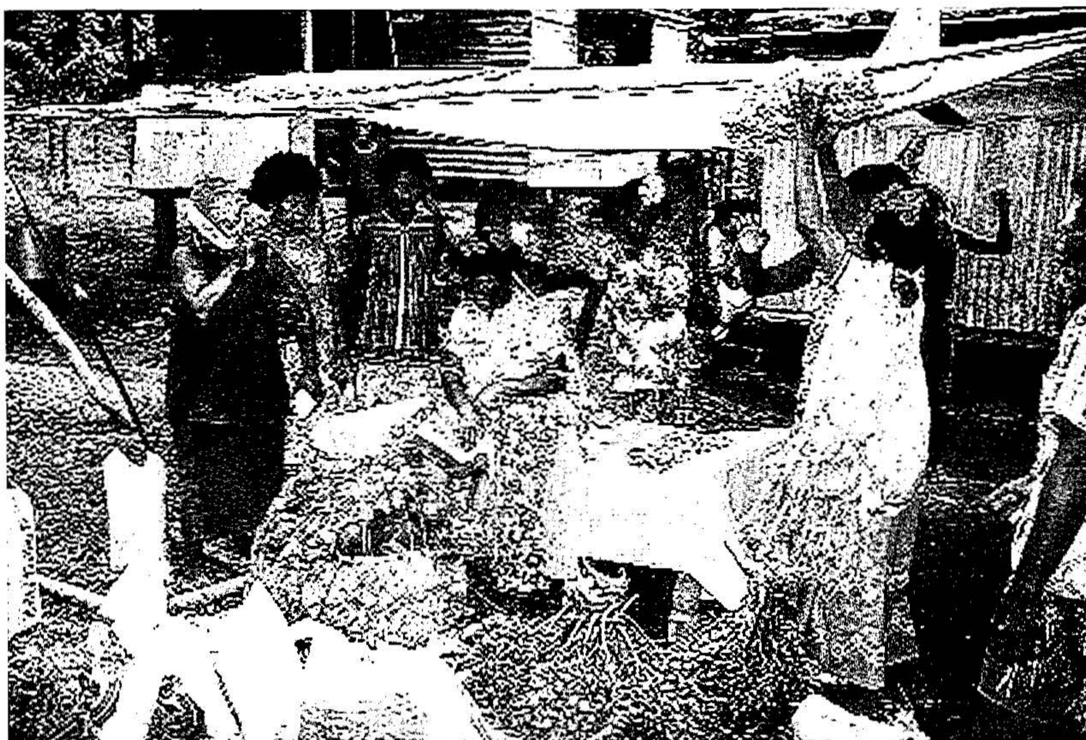
Kvinder forbereder et Kastam-bryllup.

Lad os se på dette eksempel i lyset af en teori om kulturel kompleksitet og social handling. Tilsyneladende er der altså mindst tre kundskabstraditioner på Baluan, nemlig kastam, gavman og lotu, som klart kan skelnes fra hinanden. De udgør delvist forskellige værdi- og normsæt. Inden for alle tre traditioner er der