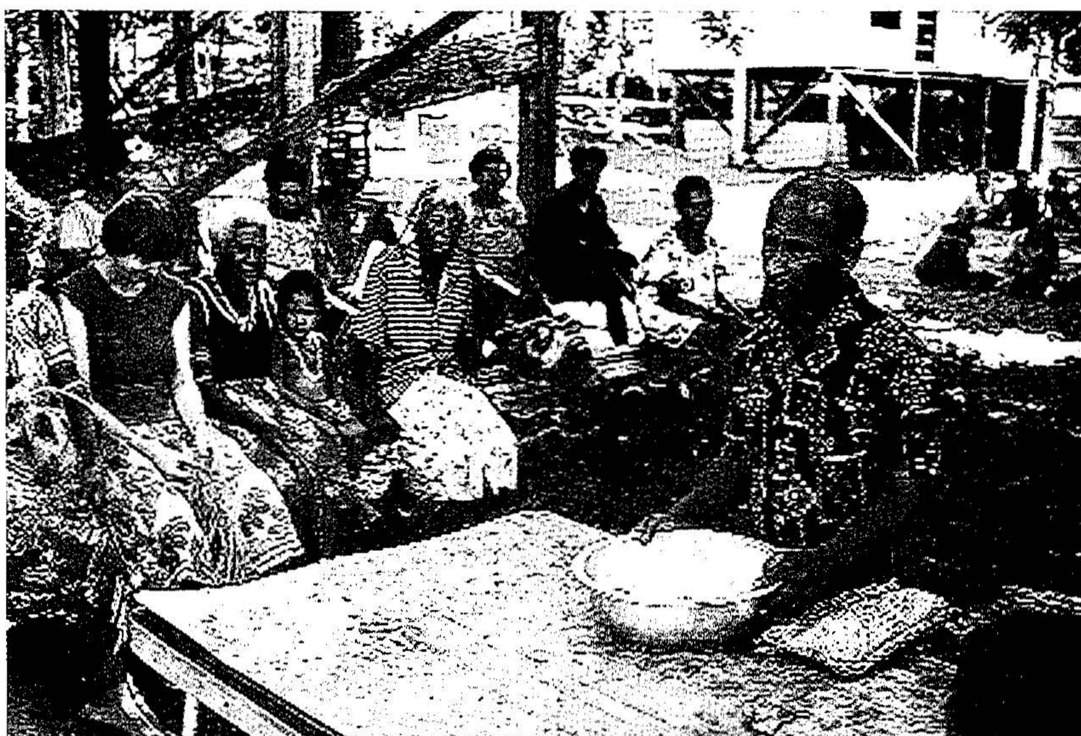
Mand præsenterer pengebidrag til Kastam-bryllup.

neladende er fælles for folk på tværs af disse traditioner. For eksempel lægges der vægt på individuel distinktion hos alle de tre brødre, uanset om de handler som ledere indenfor hver deres tradition eller ej. Tilsvarende forekommer alle tre at være stærkt motiverede af et ønske om at styrke deres status, hvilket fører til