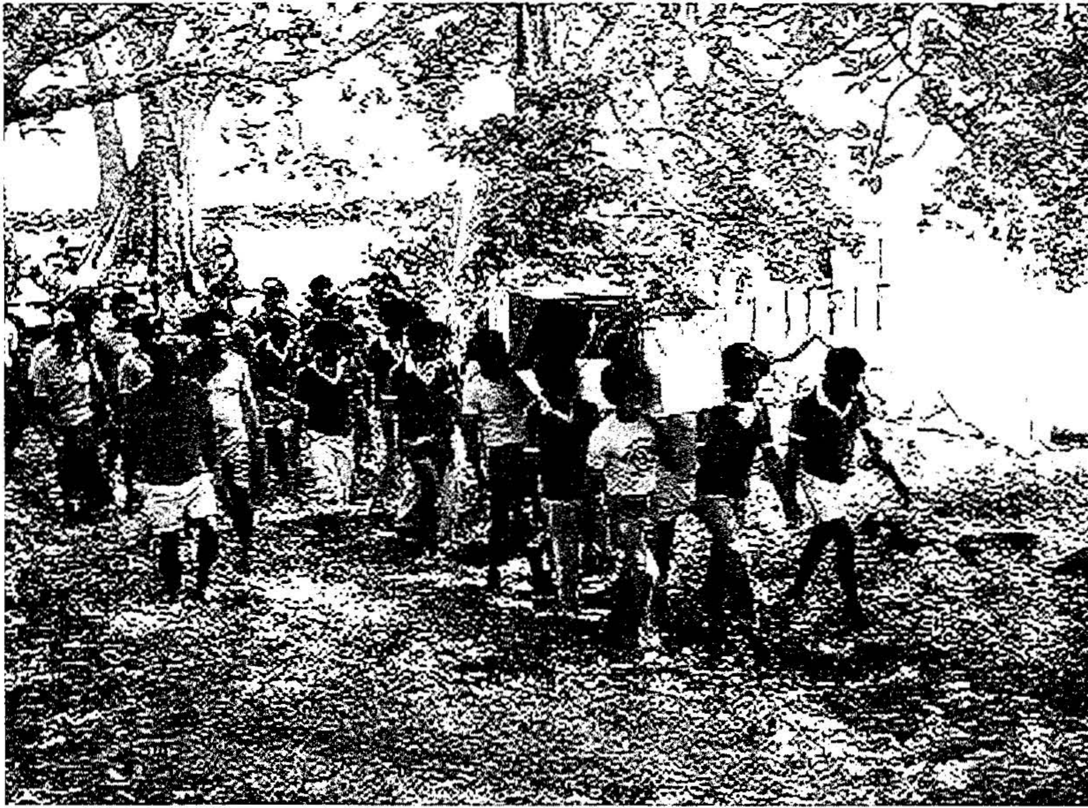
Videnstraditioner blandes og brydes: Kisten er på vej til kirkelig begravelse (Lotu). Herefter opstod konflikt om fortsættelsen efter Kastam-regler.

stimuleret, mens rivalisering blandt søskende er nedtonet pga. det hierarki, der er etableret allerede ved fødslen. Inden for kirken er konkurrenceelementet reduceret pga. den ydmyghed overfor Gud, som Lotu foreskriver, mens moderne valg til politiske poster skaber gode muligheder for rivalisering om position og status.