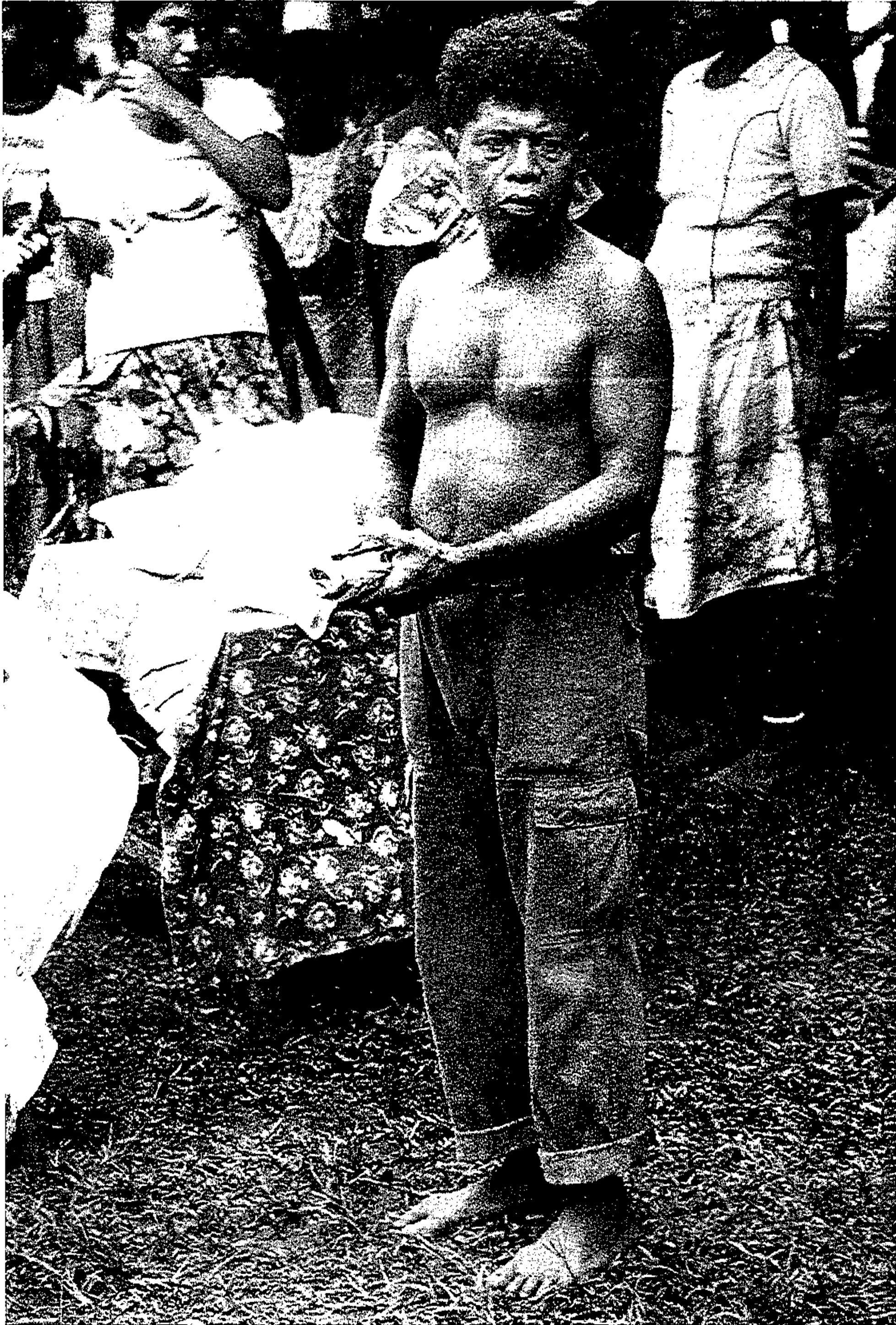
Den ældste bror, Meme, lederen af slægtlinien, i forskellige situationer, hvor han udøver Kastam .

og deres adfærdsmæssige valg. Vil det kollektive resultat af sådanne valg give tilstrækkelig information til at identificere de underliggende værdier? Selv hvis vi for et øjeblik ignorerer den åbenbare afstand mellem det tilsigtede og det faktiske resultat af folks adfærd, er denne position problematisk. Barth giver et sigende eksempel