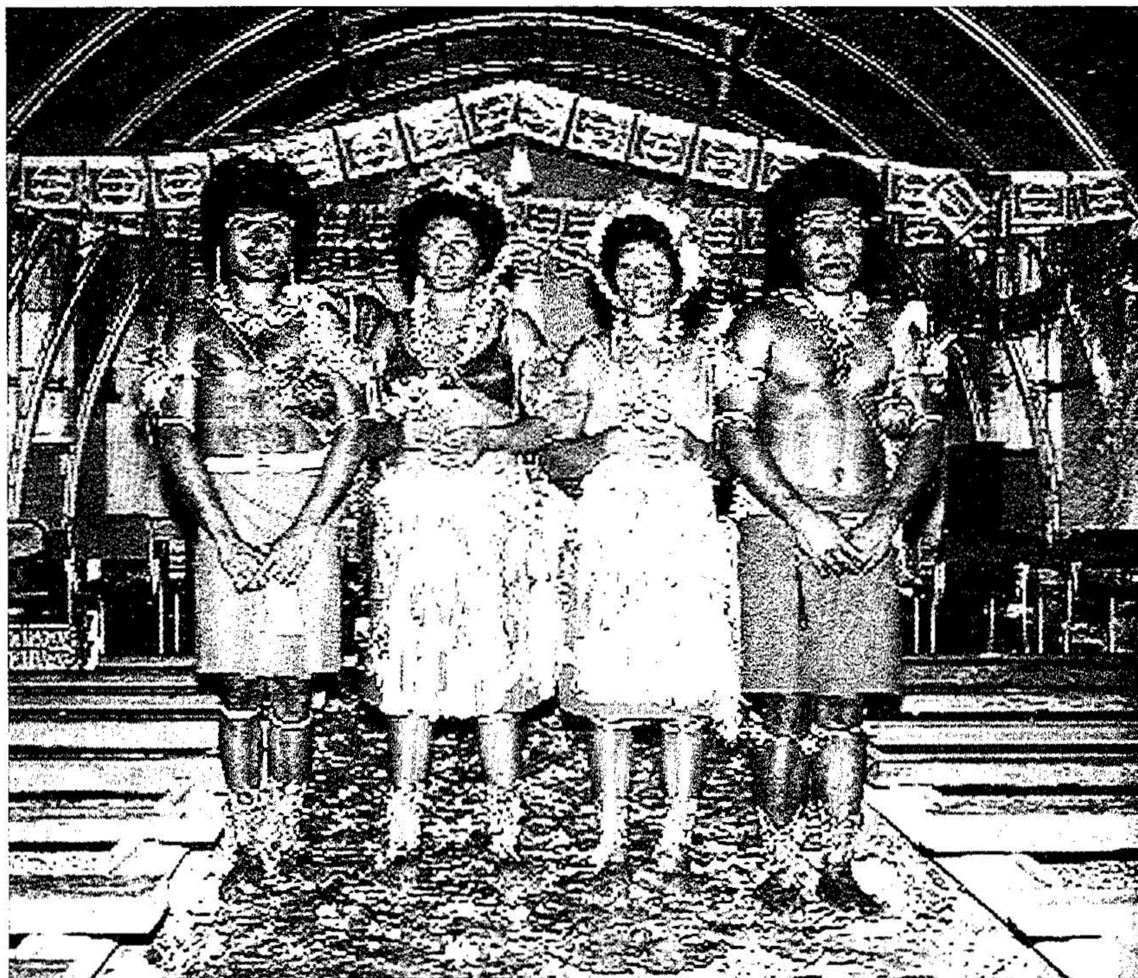
Bryllup i kirken (Lotu).

og autonomi havde stor værdi i praksis, men folk udtrykte ikke disse værdier verbalt. Snarere talte de om nødvendigheden af at undertrykke egne individuelle ønsker til fordel for gruppens interesse. Man kunne således udvikle den hypotese, at den sfære, der udgøres af eksplicit udtrykte værdier og normer, ikke reflekterer en gruppes levede praksis og 'concerns'. Snarere stiller disse værdier og normer en diskursiv sfære til rådighed, hvor folk kan kommentere og kritisere adfærdstendenser, som kan påvirke den sociale interaktion negativt, såfremt de ikke kontrolleres. Baluan-folkets iøjnefaldende individualitet ledte i realiteten ofte til social disharmoni og stridigheder, og værdier