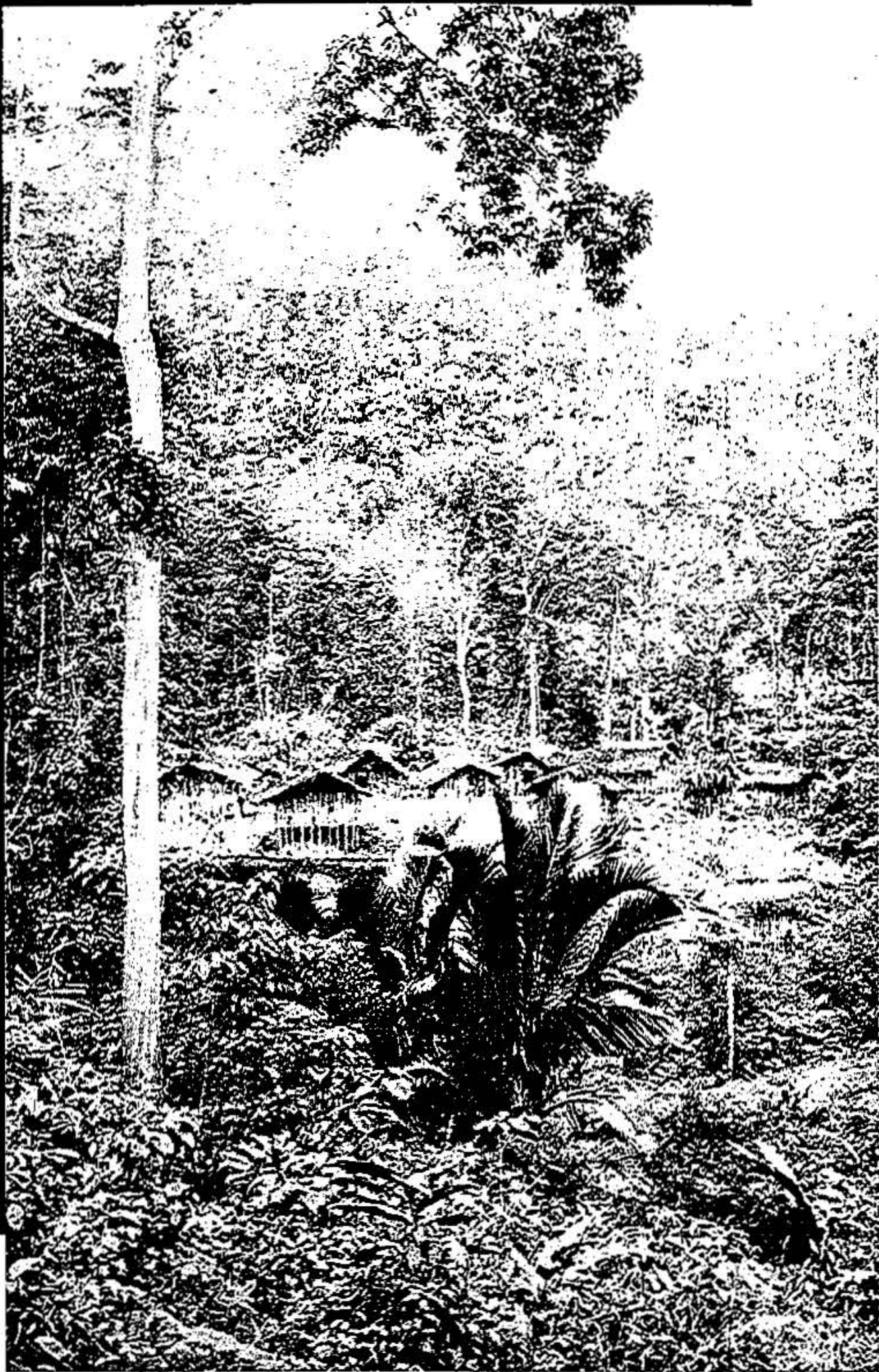
Hovedlandsbyen til Baktaman

dem, og som indeholder alle de impulser, som ligger til grund for deres tænkning". Det er selvfølgelig til en vis grad illusorisk, men det bliver dog en påfaldende reel kontrast til de Melle-møstlige folk, som er så dybt forankret i en historie, som de selv har opfattelser af. Og de er omgivet af hellige skrifter, som ligger der og skal fortolkes.