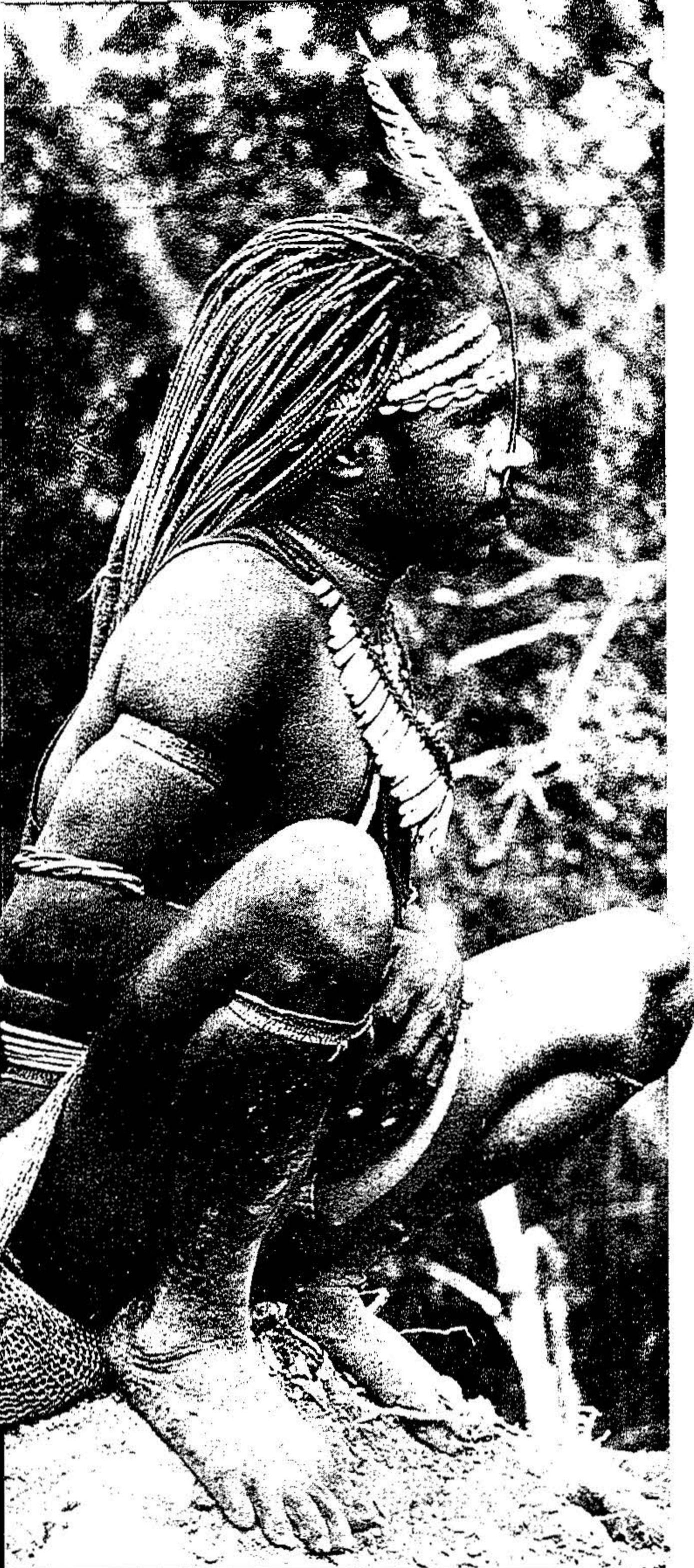
Ung mand under fjerde grads indvielse til kriger

pisk ville forekomme i deres verden. Og der havde jeg ligget og gloet op i taget i månedsvis - og det er kulsort af sod fra ildstedet, som hele tiden holdes i gang! Det er faktisk herfra, de henter sort pigment, når de har brug for det. Så huset og mandsfællesskabet er en slags prototype på fællesskab og solidaritet.