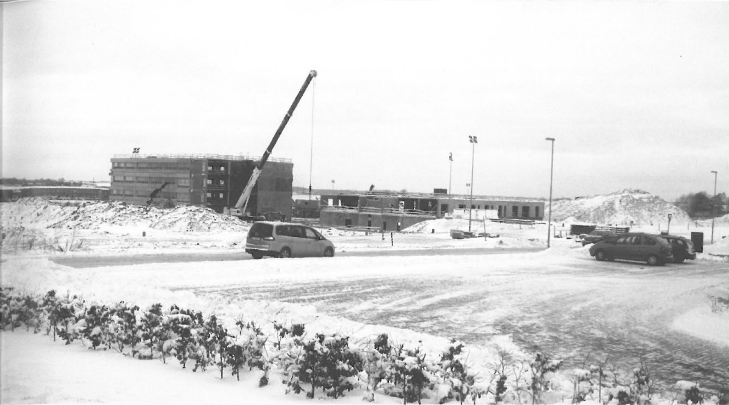
Byggepladsen i snevejr.

gerne måtte håndtere på andre måder. På den måde var byggeriets deltagere tvunget til at finde en løsning på problemstillinger, som var uforudsete, og som således ikke var beskrevet i deres tegninger. Nogle gange kunne tegningerne ændres i tide, men andre gange var problemet uundgåeligt, og så måtte de implicerede parter forhandle for at finde en løsning på de opståede problematikker. Disse forhandlinger relaterede sig ofte til økonomiske, praktiske og æstetiske dimensioner, som således konstituerede udvekslingerne mellem deltagerne.