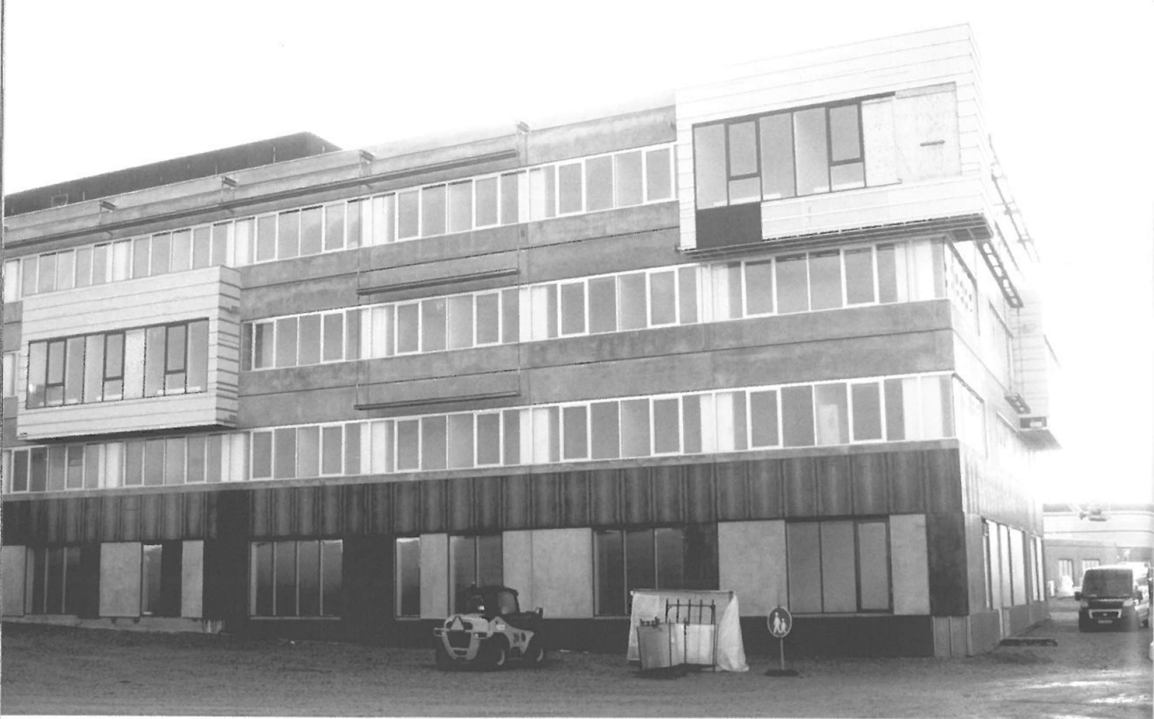
Den første færdige bygning.