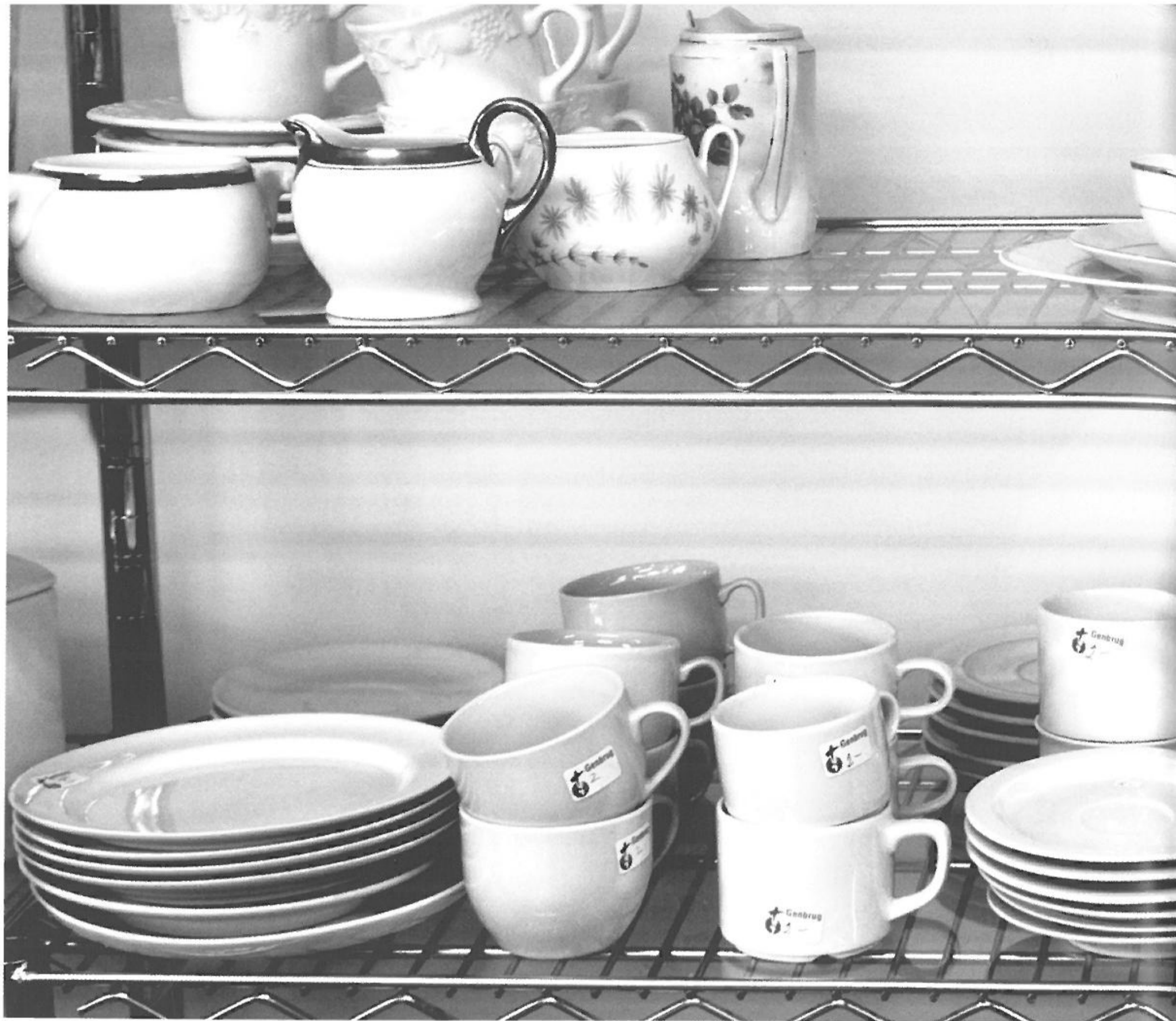
Kaffeselskaber er gået af mode, og genbrugsbutikkerne modtager massevis af gamle stel fra dødsboer.

dende har brug for pengene, har ønsket at sælge de to genstande og mener at de ifølge aftalen - på demokratisk vis og gennem en almindelig flertalsbeslutning - har ret til at råde over dem. Datteren har modsat sig et salg, fjernet medaljen og bibelen og gemt dem på et hemmeligt sted. De to brødre har derfor stævnet deres søster med krav om udlevering. Kings datter udtalte i den forbindelse: "Disse genstande må aldrig blive solgt til en person eller institution. De er hellige. Nogle ting er ikke til salg uanset omstændighederne. Jeg