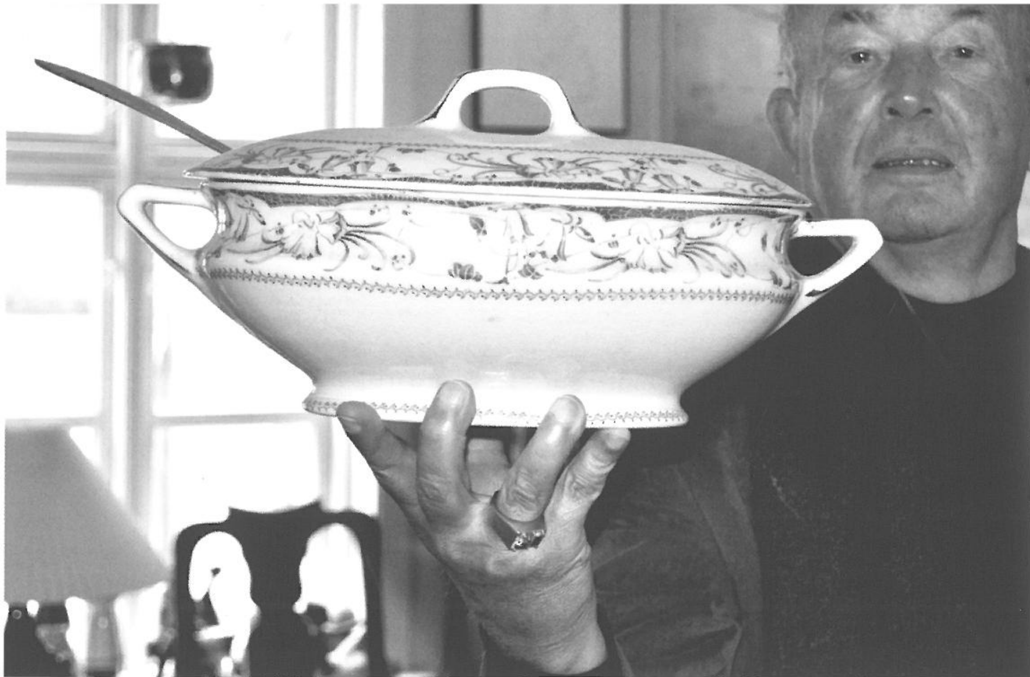
Fine, holdbare ting, som denne smukke og dyre suppeterrin, får ofte en lang historie. Kendes en antikvitets oprindelse og historie – dens proviens - stiger prisen. Suppeterrinen bliver vist frem i antikvitetsgalleriet Ulrik Witts Hus i Aarhus.

Selvom en ting bliver til arvestykke ved den første ejers død, er det ikke sikkert, at den får et langt liv som arvestykke og bliver bevaret i familien gennem flere generationer. Næste generation smider måske pladen ud eller sælger smykket.