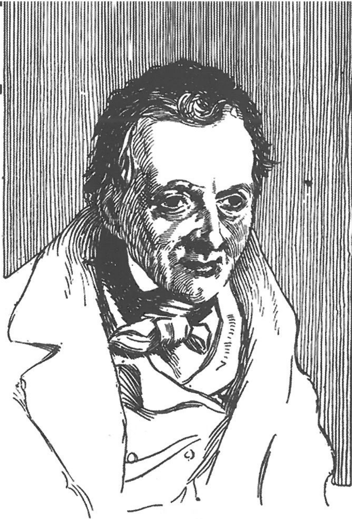
Thomas Dr. Quincey.

Siden Hannah Arendts bog om den tyske nazi-forbryder Adolf Eichmann har vi lært, at ekstrem vold muliggøres af "dehumanisering". Man bliver nødt til at klassificere personer som mindre eller anderledes end et menneske for at kunne påføre dem lidelse; således sætter gerningsmanden sig ud over moralske konflikter. Hos bugkalot-folket i det Nordlige Filippinerne praktiseredes helt indtil slutningen af 1970erne en type rituelle drab, hvor det var offerets menneskelighed og det moralsk grænseoverskridende i handlingen, der gav drabet sin kraft. I det følgende genovervejer vi, i hvor høj grad dehumanisering bør anses for at være udgangspunktet for radikal vold.