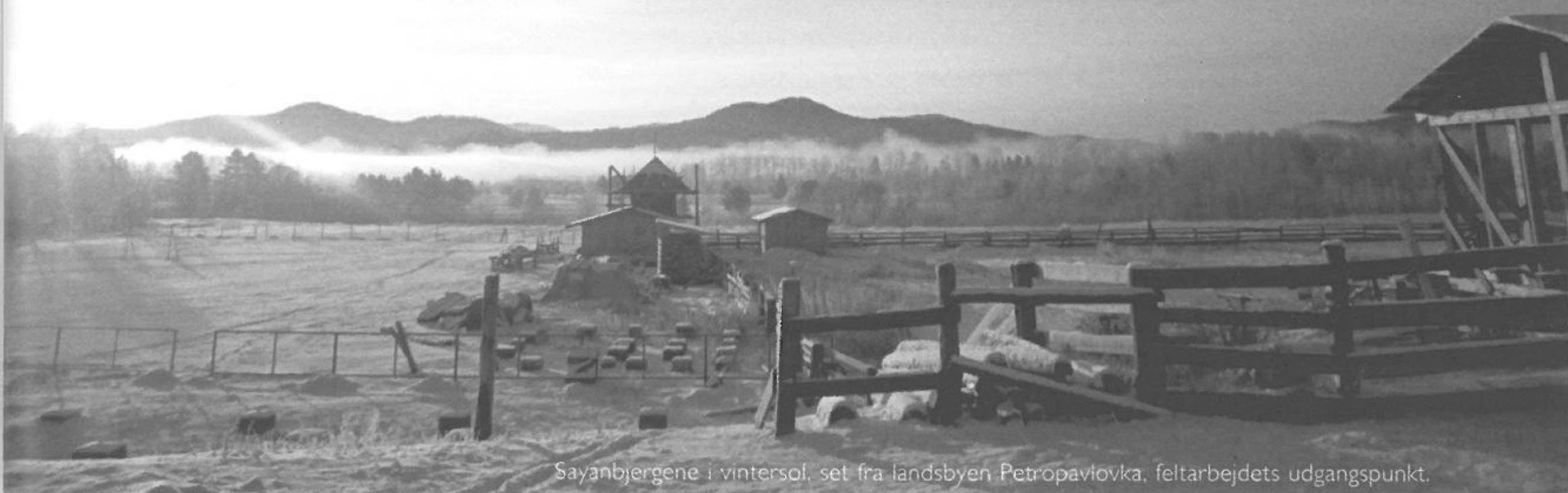
Sayanbjergene i vintersol, set fra landsbyen Petropavlovka, feltarbejdets udgangspunkt.

Diskussioner om religiøs moral står ofte mellem dem, der mener, at den er absolut og derfor hævet over tid og rum, og dem, der mener, at praksis må tage udgangspunkt i fortolkning. I Det Sidste Testaments Kirke i Sibirien ser denne modsætning dog ud til at være en banal forsimpning. For kan man egentlig adskille den absolutte sandhed fra den konkrete virkelighed?