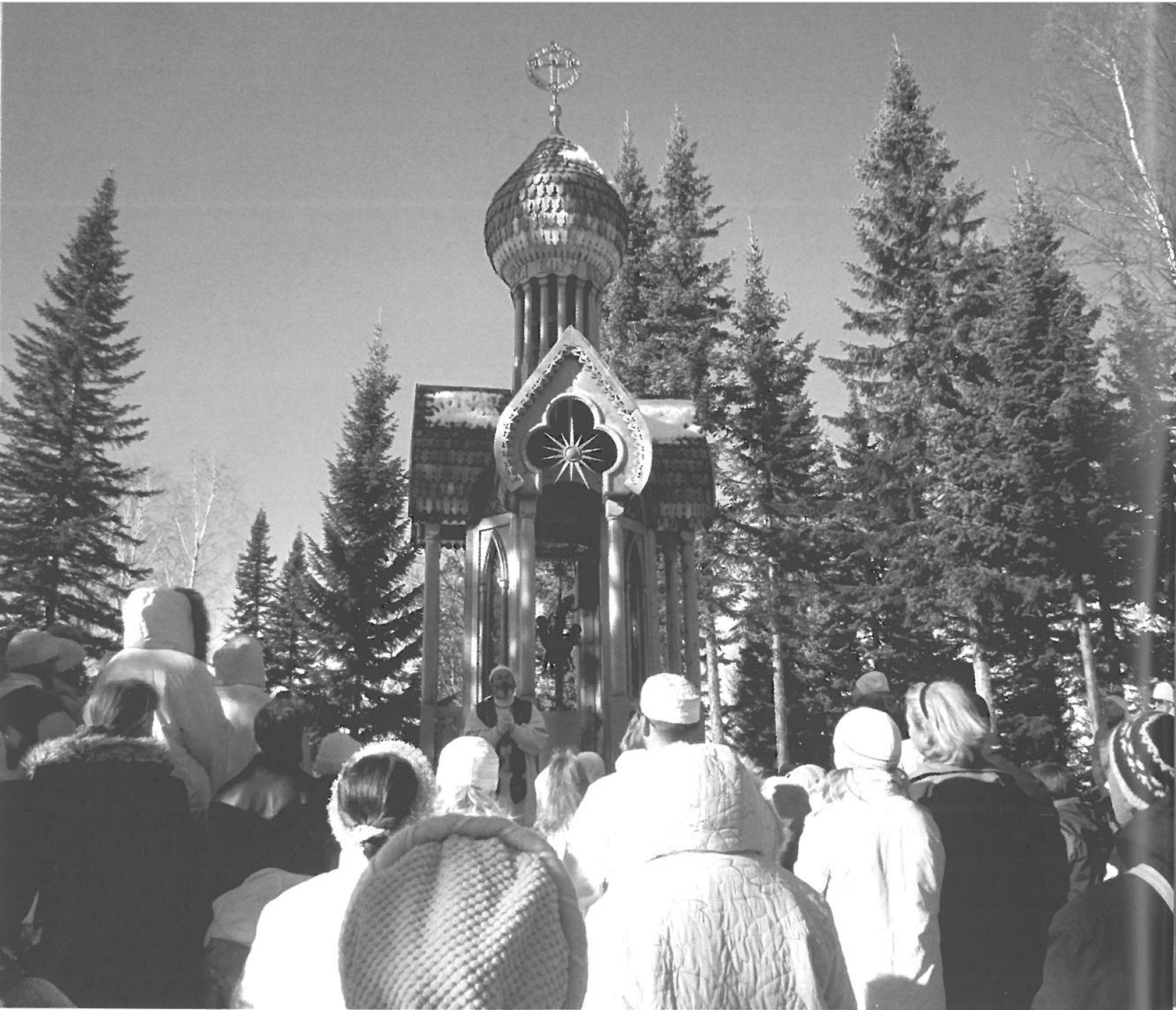
Til lovsang ved Jordens Alter på Bjergets top.

Jeg er dog umiddelbart forbløffet over, at tilsyneladende bagateller som denne finder vej til bevægelsens hellige skrift. Men som jeg siden får forklaret, er detaljen essentiel. Bibelen siger, at du skal elske din næste som dig selv. Men hvordan bærer man sig ad med at elske en far, der ignorerer en? Hvordan udmøntes det abstrakte kærlighedsbud bedst som konkret handling i en konfliktsituation? Lærerens svar er en del af den moralske dannelse, der skal lære