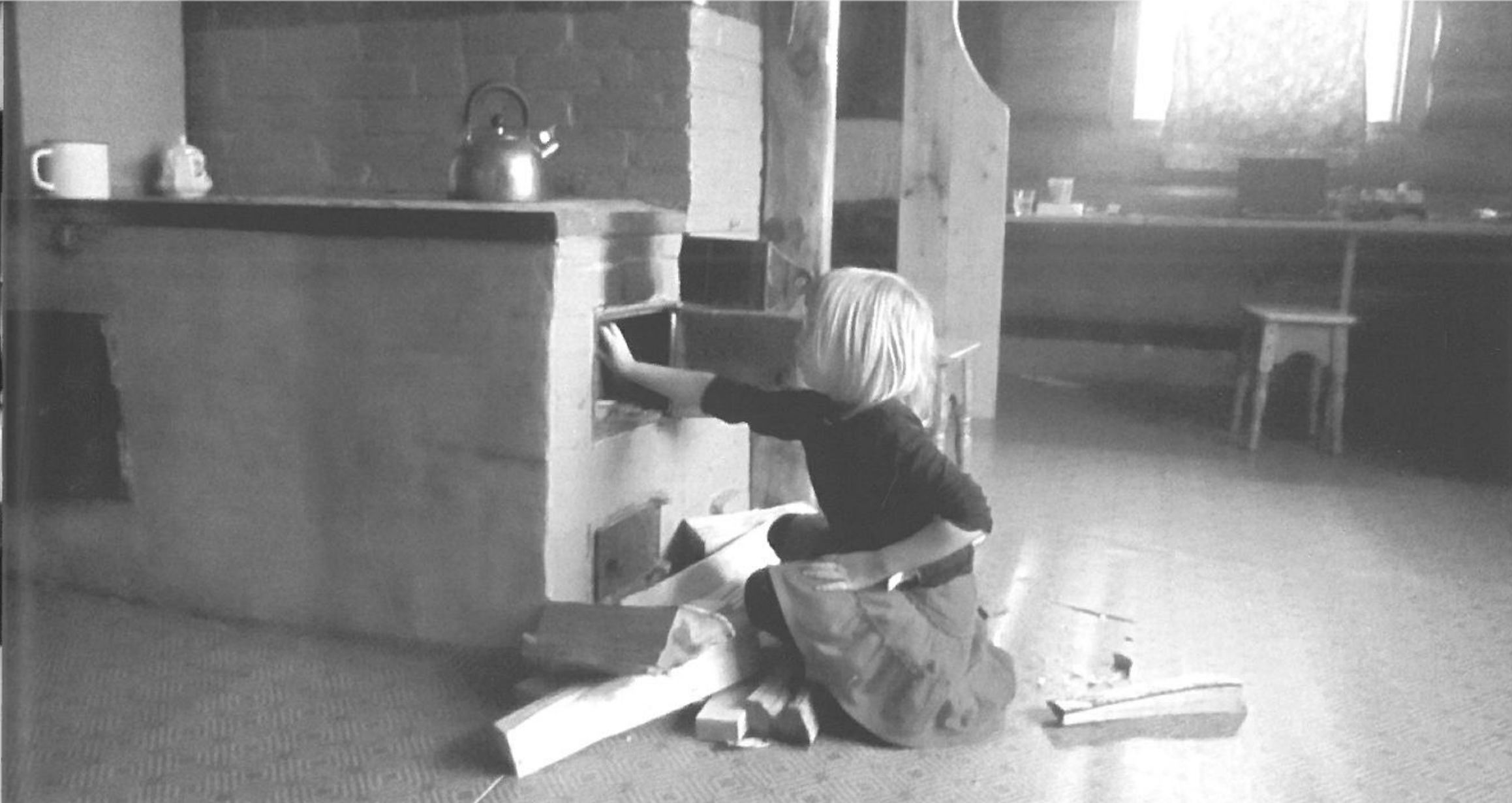
Livets Skole indebærer også tilegnelse af grundlæggende praktiske færdigheder. Her forfatterens datter i færd med at lære at tænde op i brændeovnen.

omgivende grovere energistrømme og skabe skønhed, hvor der før blot var ligevægt. Det eneste tidspunkt, sjælen kan komme i kontakt med andre energier, er, når den er indlejret i en menneskekrop, og dermed kan opfatte verden igennem dennes grove sansefilter. Her opstår sjælens udfordring: Hvordan kan den skelne mellem sin egen vilje og kroppens egoistiske behov, så meget desto mere som opfyldelse af sidstnævnte til en vis grad er forudsætning for sjælens virke på Jorden?