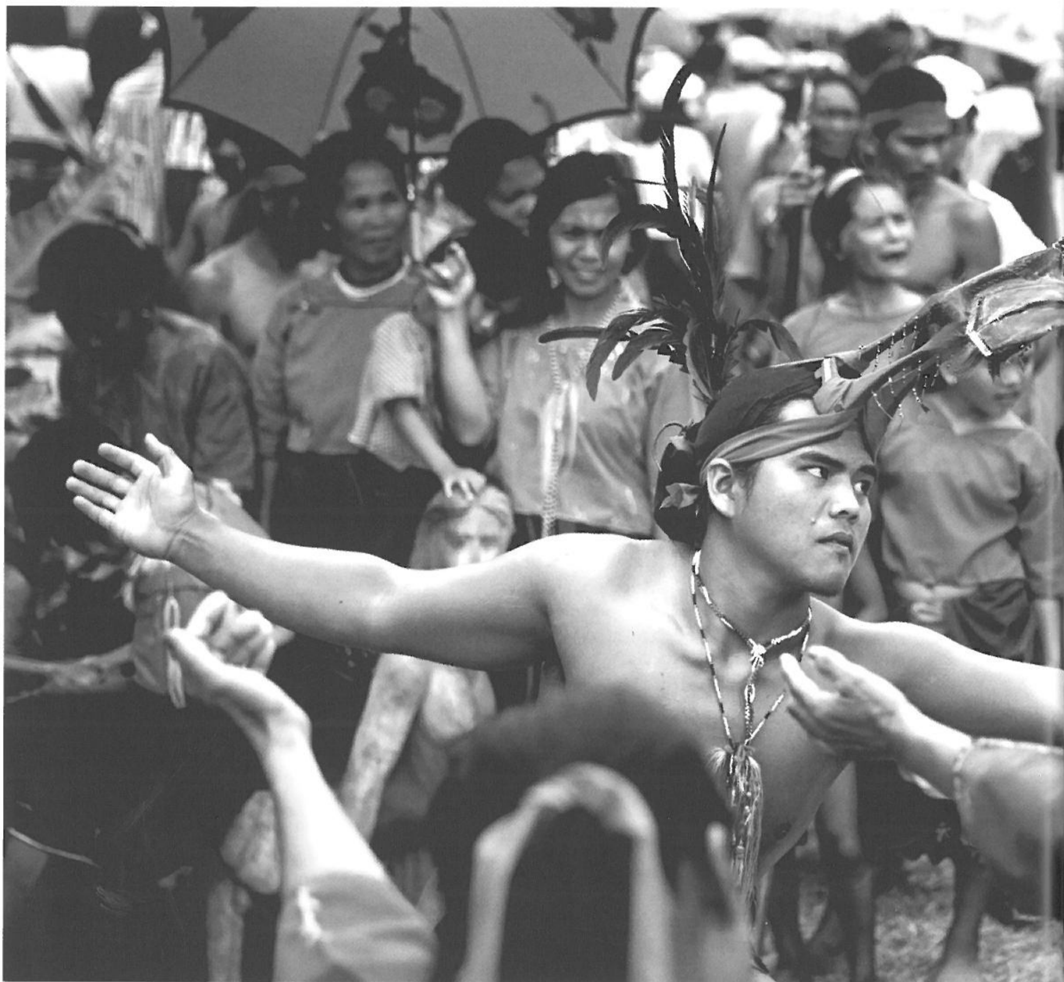
Blandt ilongotterne forbindes den røde farve med mod.

præget af tæt regnskov. Det lægger nogle naturlige begrænsninger på kommunikationen, og det er ingen tilfældighed at både den biologiske og den sproglige diversitet her er enorm. Det er også nemmere at være hovedjæger og tage på raid i nabolandsbyen, når man ved at den er svært tilgængelig og det derfor vil tage