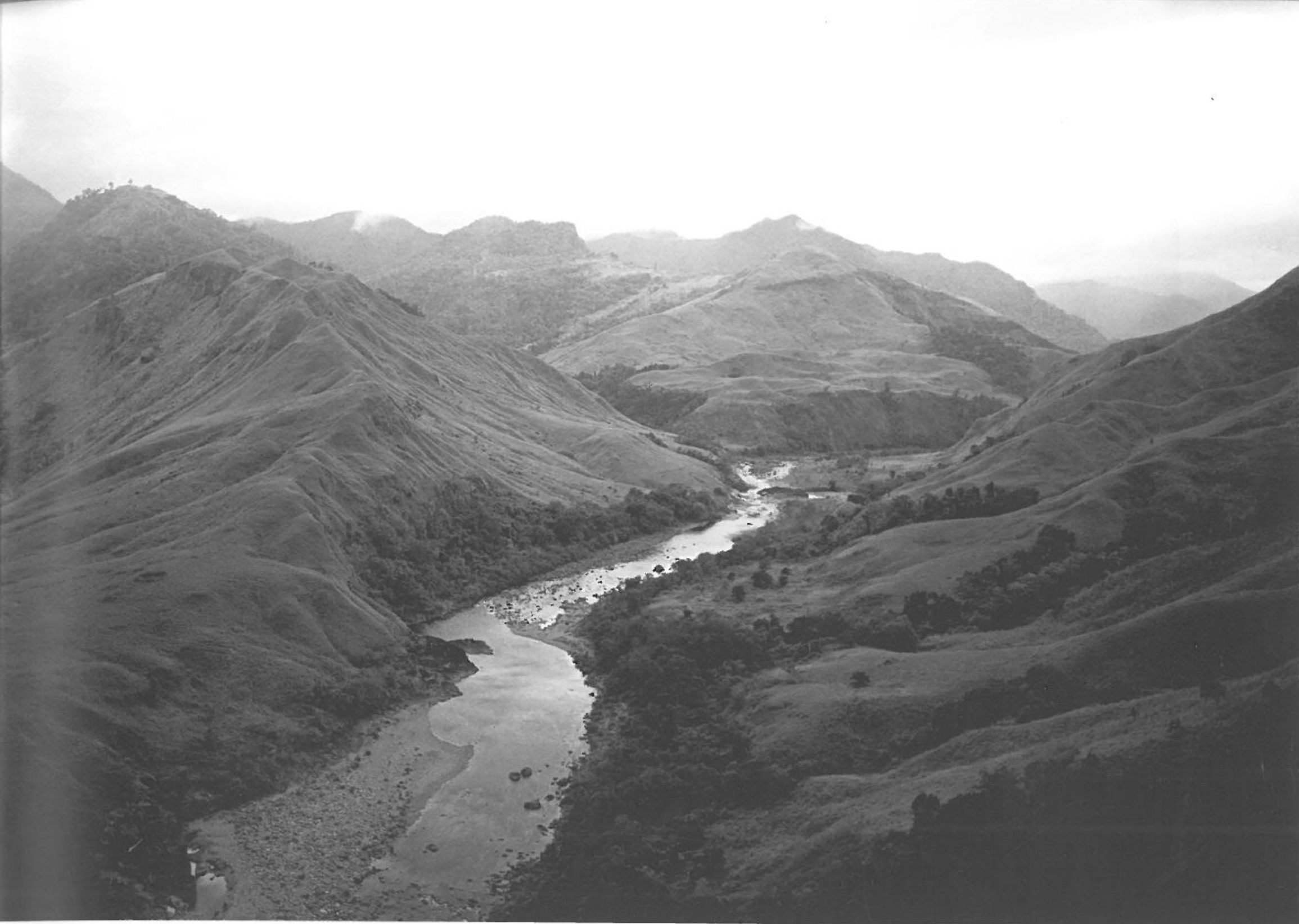
Ilongotterne holder til på øen Luzon i et område der er præget af bjerge, floder og jungle.

var det ingen sjældenhed at amerikanske soldater bragte en japansk fjendes kranie med hjem som souvenir eller trofæ. Deres overordnede prøvede gentagne gange at sætte en stopper for aktiviteten, som beskrives af både amerikanske og japanske krigstidsaviser.