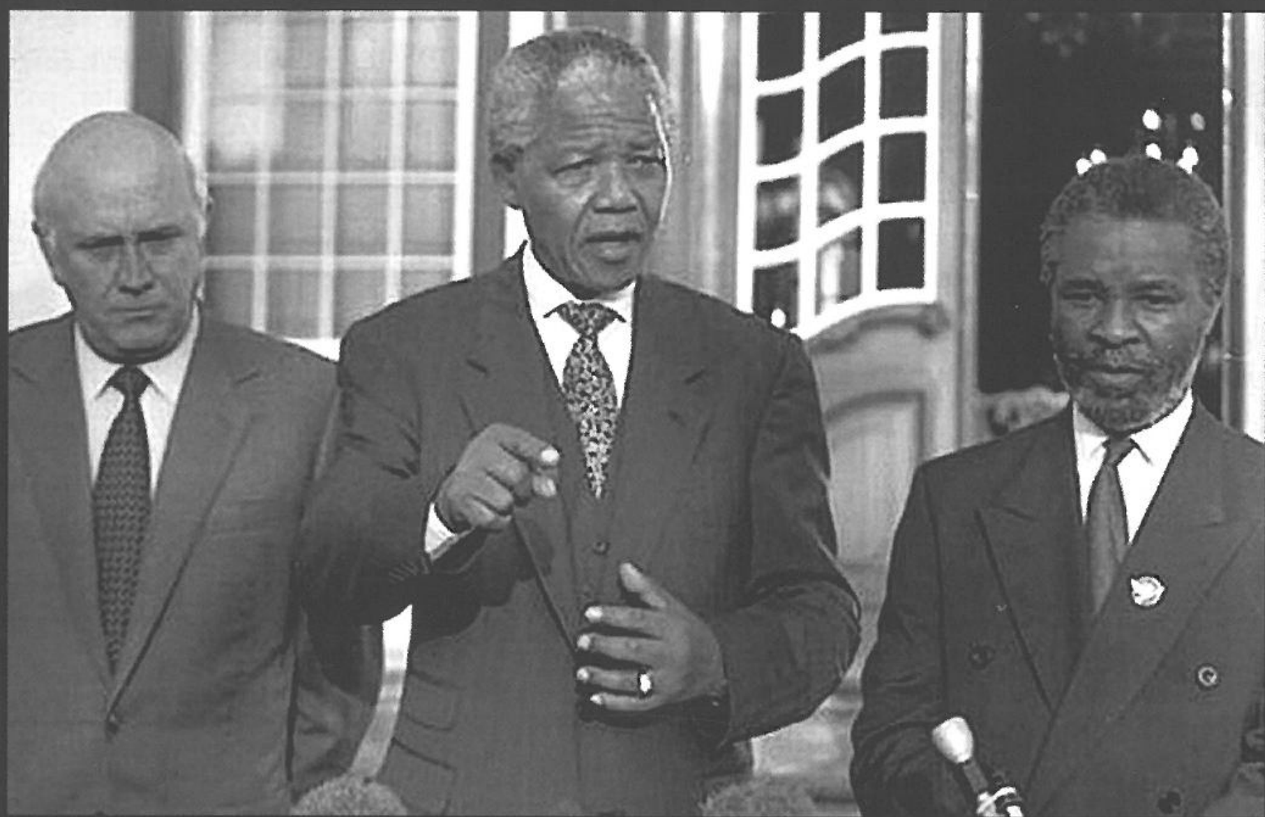
De Klerk, Mandela og Mbeki i Cape Town, Sydafrika, 6. maj 1994.

I Sydafrika var der ikke nogen entydig sejrherre i apartheidkonflikten. Derimod måtte både modstandsbevægelserne og apartheidregimet sande, at deres forsøg på at vinde en militær sejr ikke lod sig realisere. I 1990 besluttede parterne sig for at indgå i en officiel politisk forhandlingsproces, hvilket mundede ud i, at de blev enige om en foreløbig konstitution, der skulle træde i kræft efter Sydafrikas første demokratiske valg i april 1994. African National Congress fik en klar sejr ved valget, og Nelson Mandela blev indsat som