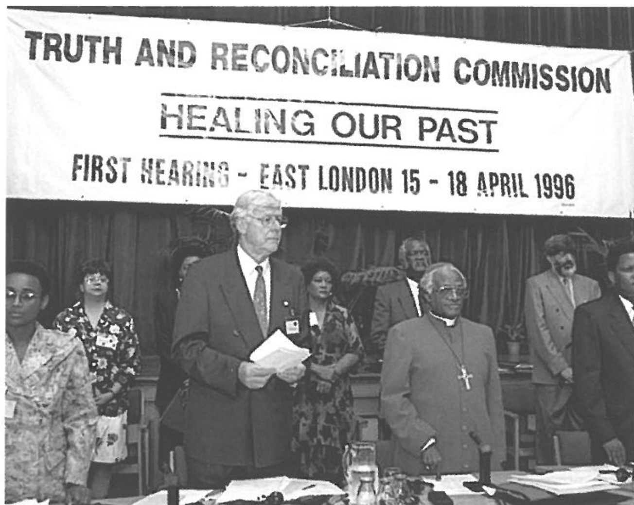
Sydafrikas Sandheds- og Forsoningskommission afholdt sine første høringer i april 1996. I Komitéen for Menneskerettighedskrænkelser berettede apartheidofre om de menneskerettighedskrænkelser, de havde været udsat for, og i Amnestikomitéen fortalte gerningsmænd om deres forbrydelser med henblik på at modtage amnesti.