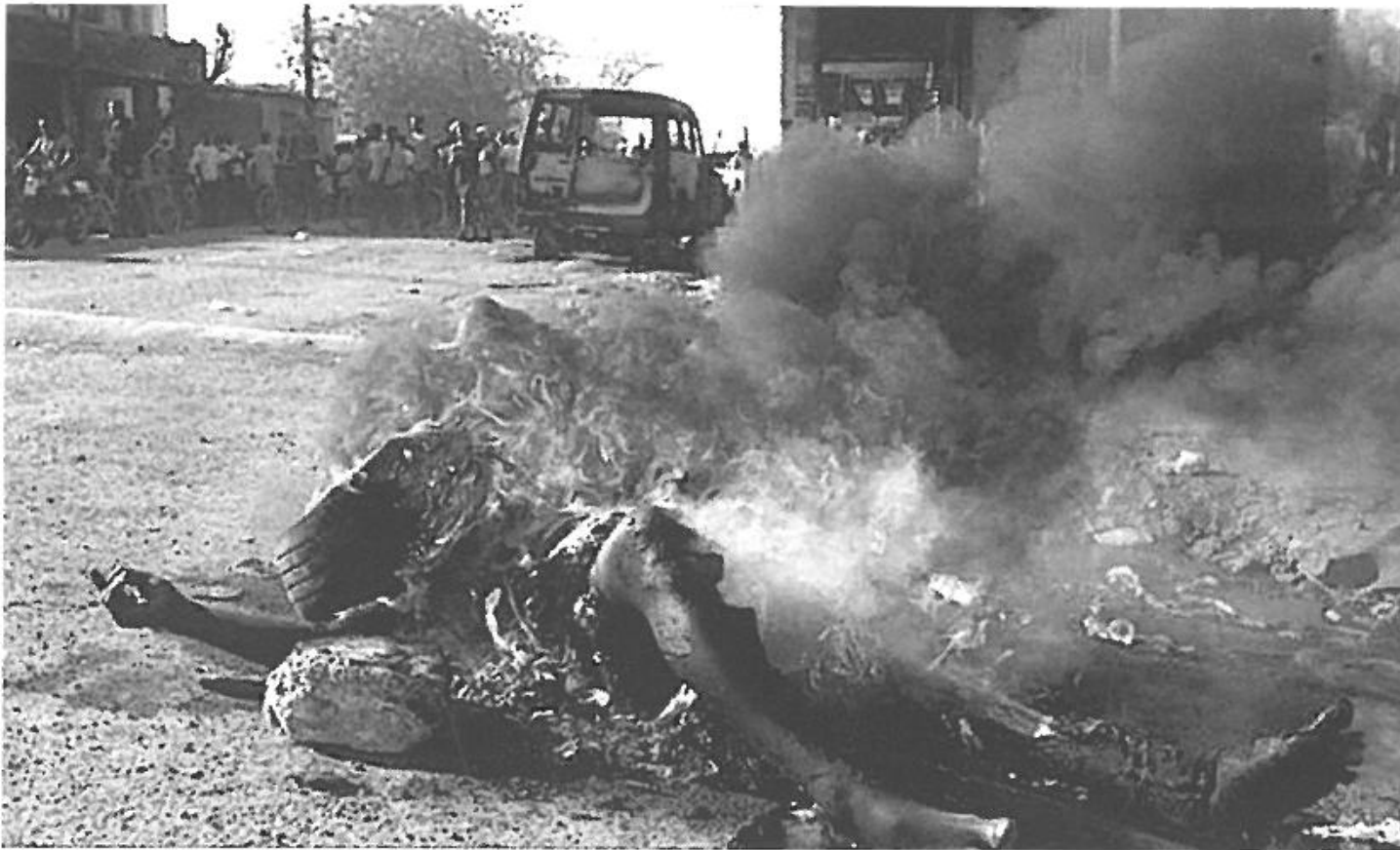
Necklacing er en drabsmetode, hvor ofret får et bildæk om halsen, der antændes. Drabsmetoden er blevet praktiseret både under og efter apartheid

Den 3. oktober 1996 gik Tutu i rette med et ungt apartheidoffer, der ikke havde tilgivet den politimand, der havde skudt ham. Han sagde: "Parlamentet bad os forsøge at opnå forsoning, og måske vil der komme et tidspunkt, hvor du vil have mulighed for at møde denne mand igen. Måske vil han så sige, at han er ked af det. Måske vil du så være i stand til at tilgive ham, og så vil forsoning blive opnået. Det vil overhovedet ikke hjælpe at bære hævn i dit hjerte, for det er som noget, der forgifter dig. Det vil forgifte hele dit liv, hvis du bærer denne vrede i dig selv. Vi forstår, hvordan du føler om alt dette, men vi beder dig om at forsøge at tænke på den dag, hvor du vil være i stand til at tilgive denne mand. Der er mange fra vores folk, som har lidt enormt, ikke kun fysisk men også følelsesmæssigt i deres hjerter. Vi kan tænke på vores præsident i denne forbindelse. Alle de personer, som var på Robben Island, de led også meget, men nu siger de, med henblik på vores lands frem-