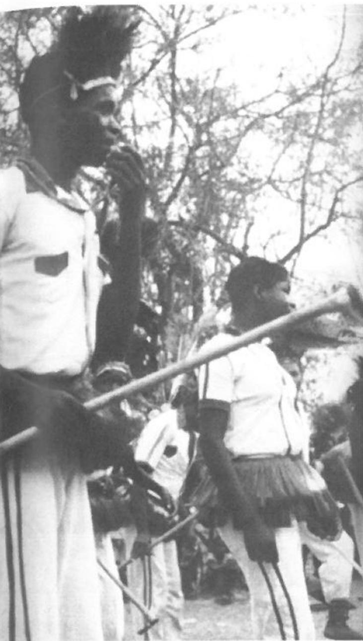
helhedsfunktion er det karakteriske for ngomaen, som modsætning til sportens fikserede, specialiserede Lyakus dansegruppe fra Lugeye.