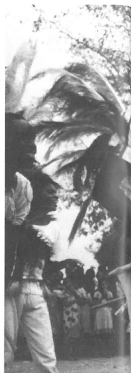
Den rytmiske puls og kroppens er traditionel kropskultur. I og stive bevægelser. Her Mzee

at løbe. Alene til skolen har mange tanzanianske elever ofte mellem fem og ti kilometer.