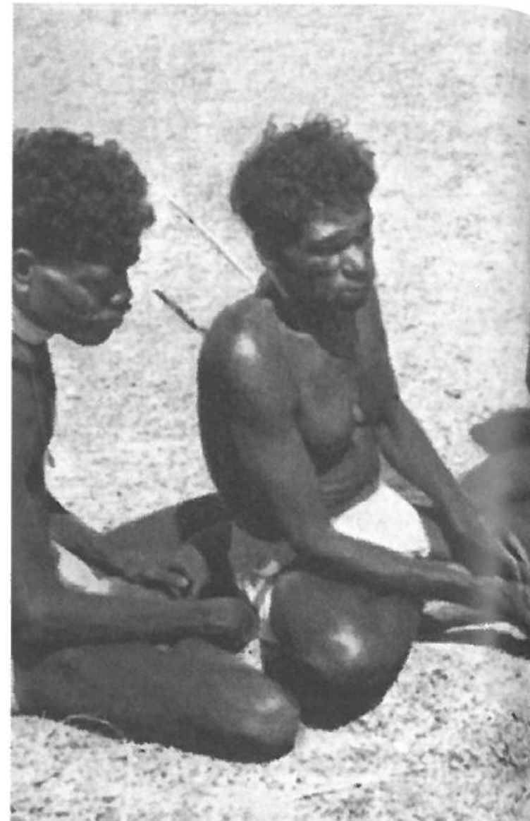
En spydod af glas fastgøres på skaftet ved

ne hellige drømmetid. En fortid hvor forfædre, der var både guder, dyr og mennesker, gjorde ting, som mennesker ikke længere kan. De frembragte den verdensorden, som er nu, og som har været fra deres tid. Ingen forestillinger om nogen anderledes fremtid passer i denne filosofi, hvor alle mennesker, ting og skikke bar den plads, forfædrene gav dem. I myten om fortiden havde stenøksen sin bestemte forankring.