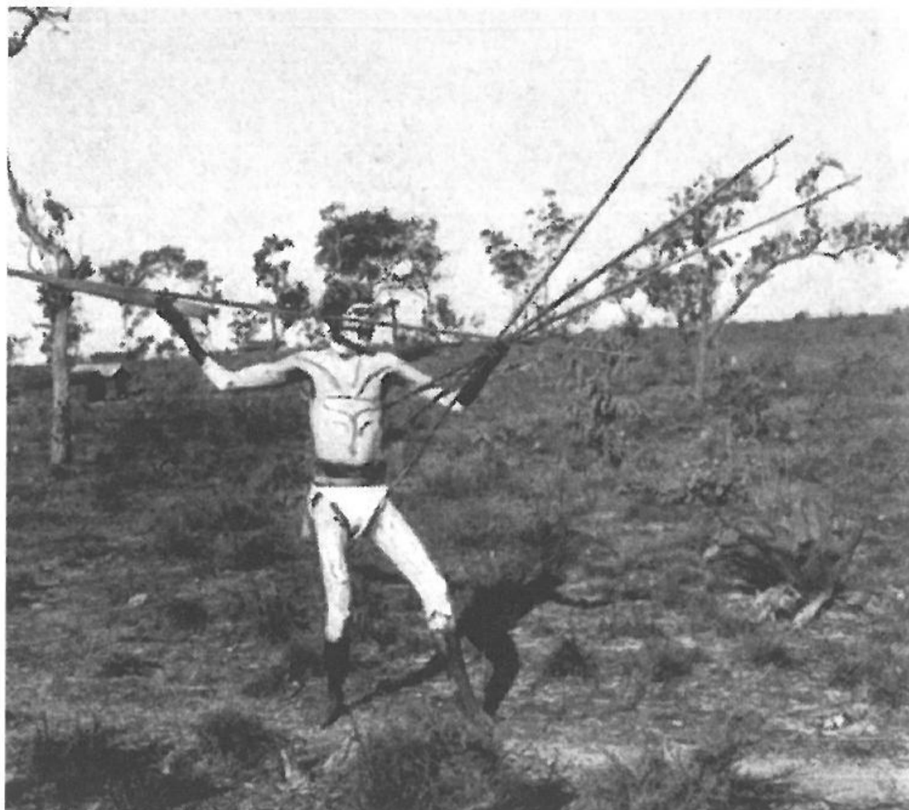
Spydkast ved hjælp af kastetræ

der betød noget i den traditionelle samfundsorden, holdt sig borte fra missionærerne.