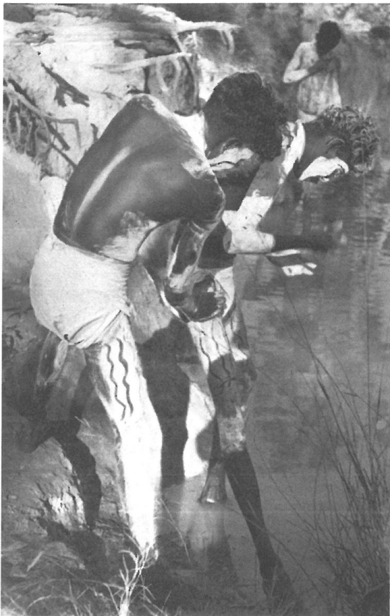
Indfødte indsmører sig i ler før bestemte ceremonier

afsluttede sine undersøgelser i området, var det ikke nået så vidt med Yir Yoront'erne, men forvirringen bredte sig, og tragedien syntes ikke til at undgå.