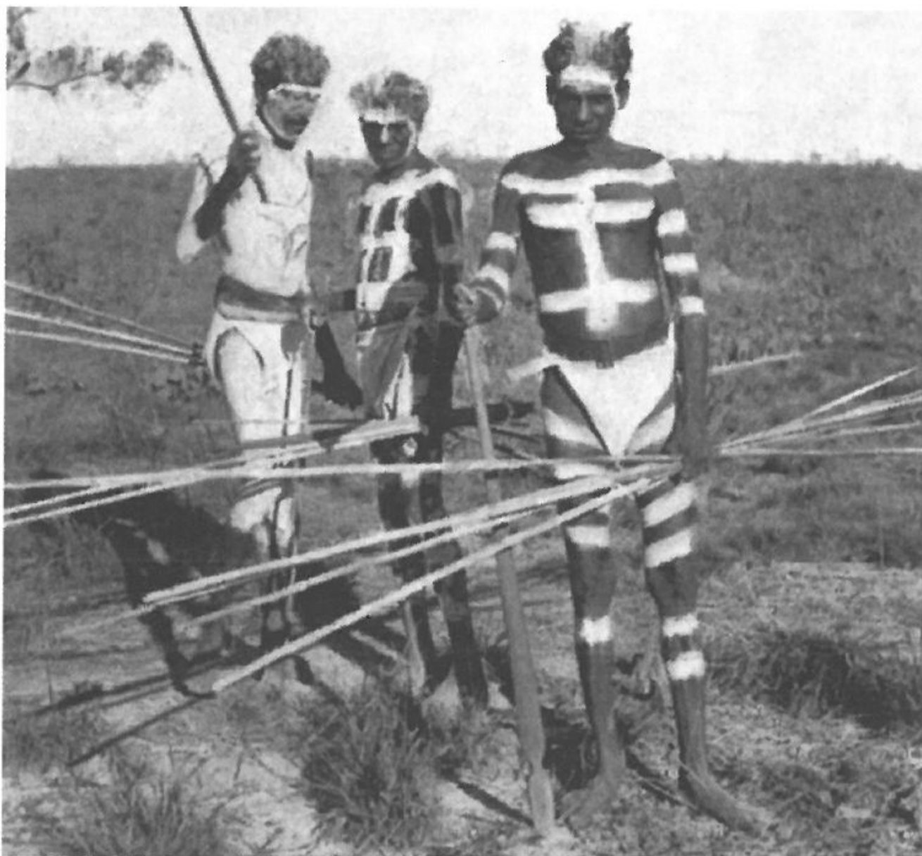
Nordaustraliere med det almindelige udstyr til jagt og kamp: spydknipper og kastetræ.