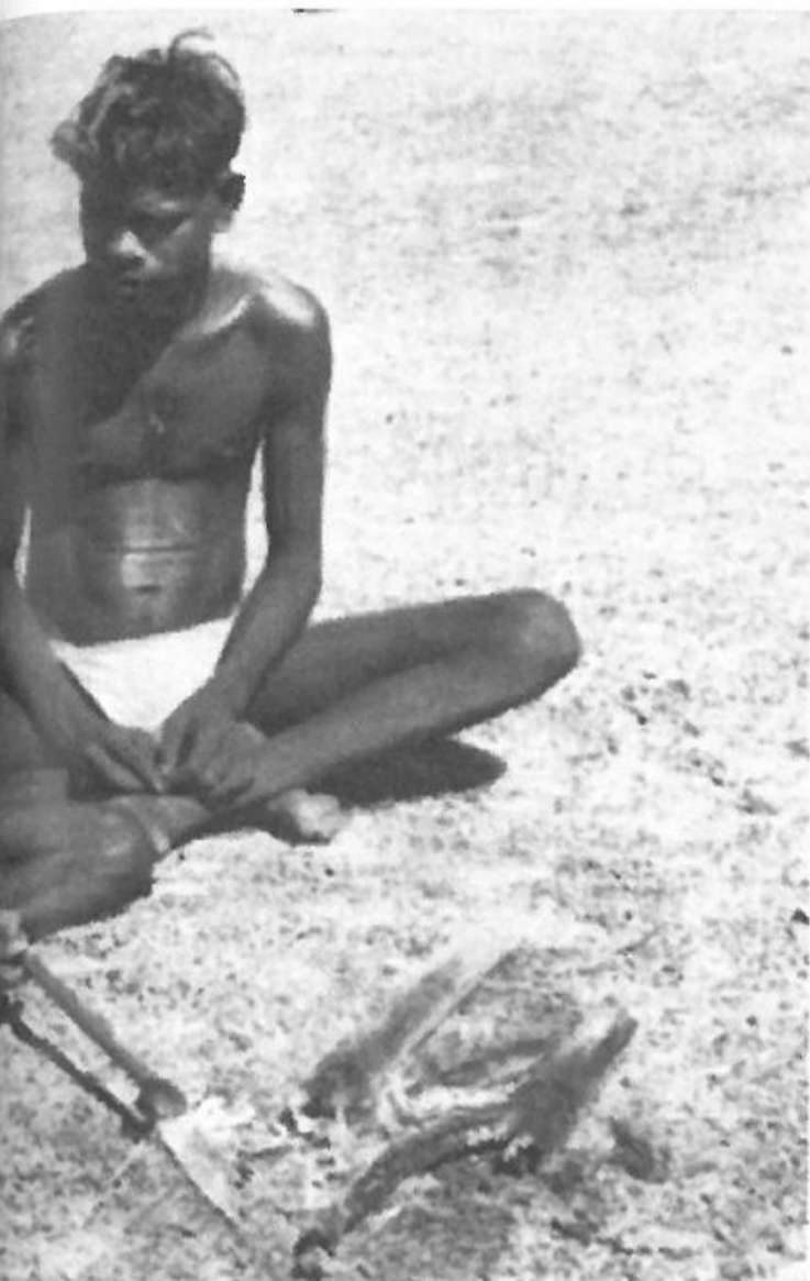
hjælp af harpiks og ild.