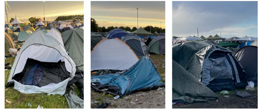
Teltkonstruktioner, Roskilde Festival 2024.

Som sådan tilbyder teltet ly og beskyttelse mod skiftende vejrforhold; regn, vind eller sol. Det står uskyldigt og sagesløst på festivalpladsen. Og dog. Teltet spiller i sig selv en betydelig rolle i festivaloplevelsen. Alene teltets fysiske komponenter gør ved nærmere eftersyn en forskel som ikke-menneskelige aktører. De mange små dele bidrager hver især til teltets funktionalitet, og hver lille del indeholder en risiko for funktionsfejl, der kan påvirke teltets stabilitet, komfort og brugervenlighed. En ødelagt lynlås forhindrer til eksempel teltåbningen i at lukke og lader derfor regn, vind og insekter komme ind, og en lille undseelig løsrevet strop kan ændre teltstængernes position og stabilitet.