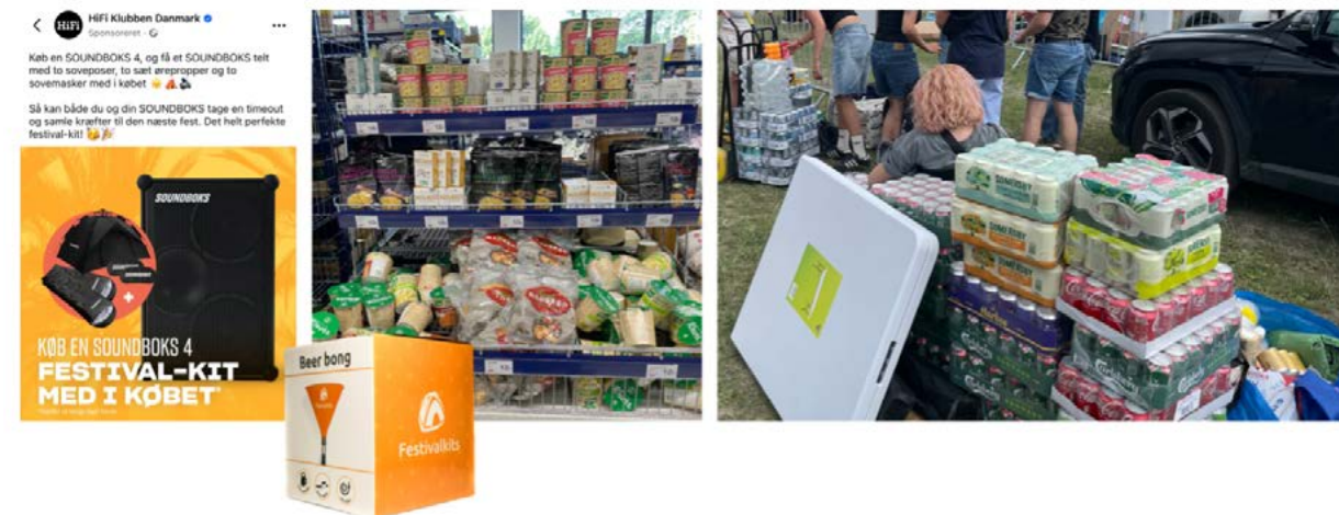
Festivalteltets ledsagere – pakket i festivalkit, opstillet på tilbudshylder og transporteret med festivaludstyr, 2024.

også på grund af produktets korte levetid. Teltet er fremstillet med henblik på at blive erstattet af et nyt næste år; dårlig kvalitet sikrer tilbagevendende efterspørgsel. I den forstand er teltet ikke blot transportabelt; det har også midlertidighed bygget ind. Det er forprogrammeret som en døgnflue.