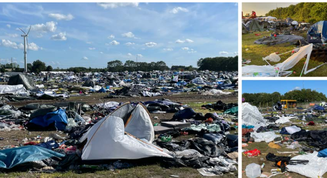
Skrald så langt øjet rækker, Roskilde Festival 2024.

Efter 20 år, hvor mængden af affald steg på Roskilde Festivalen med ca. 76 ton affald hvert eneste år, er det siden 2016 lykkedes at knække kurven og reducere affaldsmængden fra mere end 2500 ton affald til 1500 ton i 2022. Tallene for 2023 og 2024 er endnu ikke offentliggjorte, men Roskilde Festivalen oplyser dog, at de forventer, at affaldsmængden er steget. Fluktuationer i affaldsproduktionen på festivalen hænger snævert sammen med vejrforholdene; regner det eksempelvis meget et år, får festivalteltet følgeskab af gummistøvler, paraplyer og ekstra presenninger, og det kan være