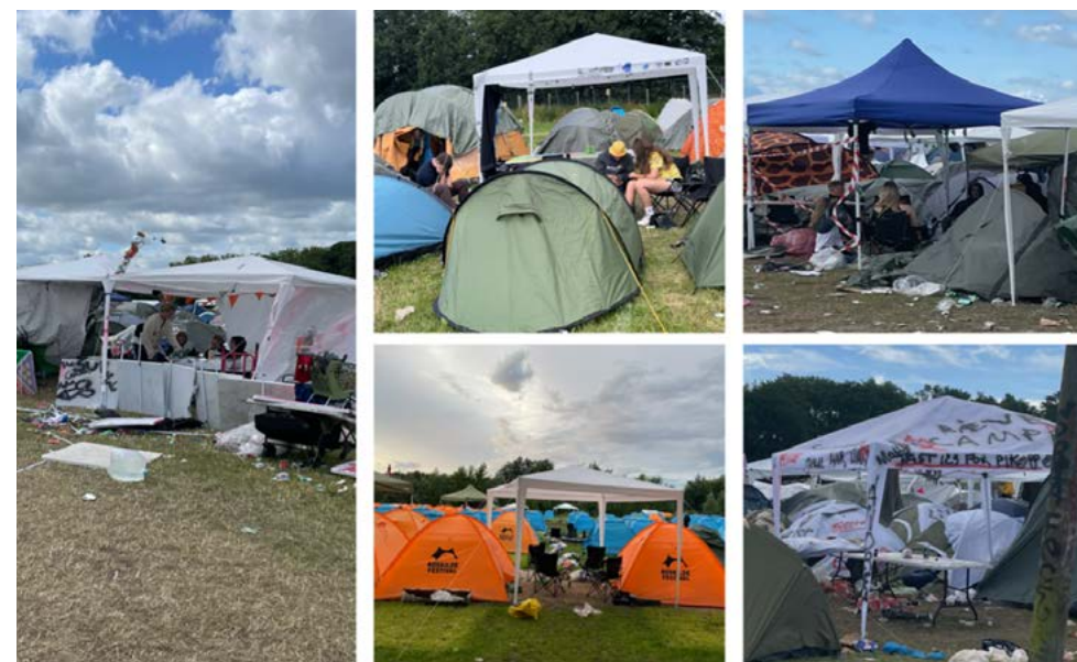
Festivalteltet som markør af territorie og fællesskab. Fotos af Lene Granzau Juel-Jacobsen.

Dette netværk ændrer funktionaliteten og værdien af festivalteltet. Det er ikke længere bare et ly for natten eller en skærm mod sansebombardementer, men også en markør af territorium, en fysisk fæstning og manifestati-