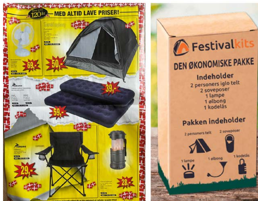
Harald Nyborg reklame for festivaludstyr og festivalkits.dk 2024.

Markedsføringen af festivaltelte levner ingen tvivl om, at forretningsmodellen for festivaltelte bygger på en logik, der stræber mod lav margin, men høj omsætningshastighed. En sådan forretningslogik er kun rentabel, hvis produktets kvalitet og holdbarhed sænkes (og måske også, hvis arbejderne får dårlig løn), både på grund af de lavere produktionsomkostninger, men