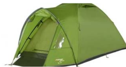
Vægt 3,3 kg Materiale: Nylon Anslået CO2 aftryk 25-31 kg