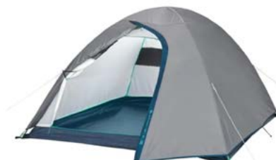
Vægt 4,3 kg Materiale: Polyester Anslået CO2 aftryk 43 kg

CO2 estimater af festivaltelte.