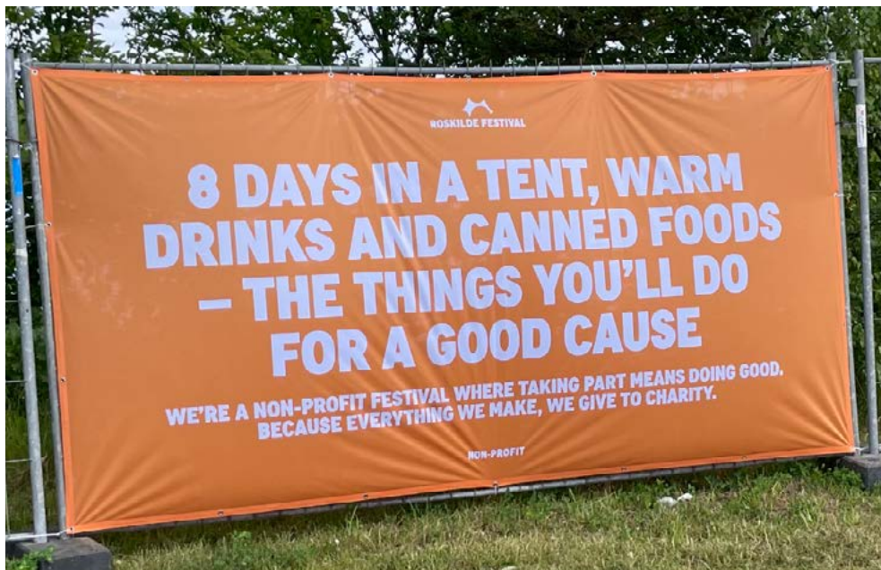
Reklame banner på Roskilde Festivalen 2024.

Denne overbevisning stemmer godt overens med at hele festivaloplevelsen promoveres af Roskilde Festivalen som velgørenhed. En uges overforbrug – iscenesat som opofrelse – tjener i sidste ende et godt formål.