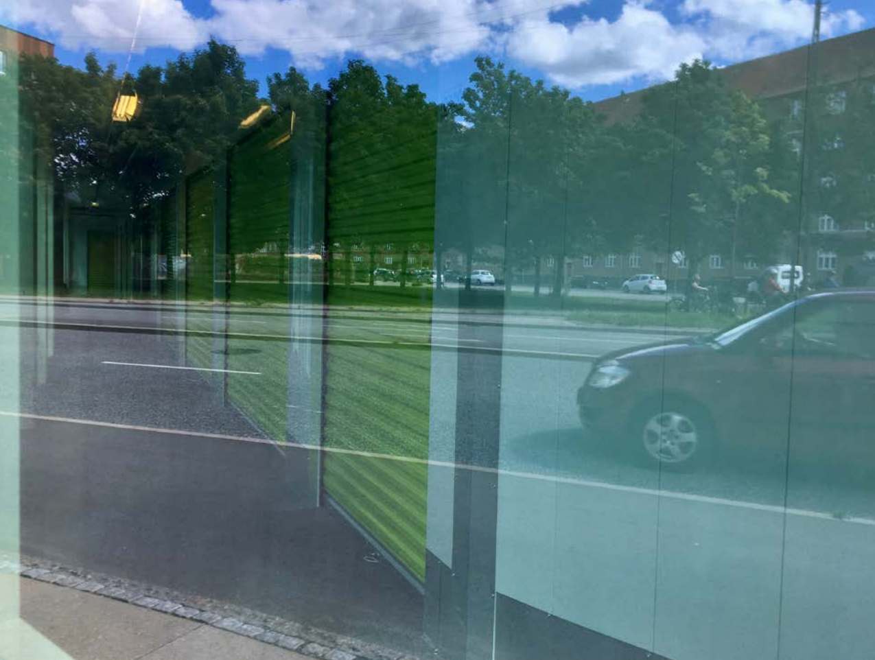
Opbevaringsrum set fra gadeplan.

kalder på rumlige strategier, der kategorisk og fysisk adskiller dem fra det rene, er næsten-skraldet mere ambivalent. Og selvom det også i mange tilfælde befinder sig i slutningen af dets materielle livs-cyklus, vender det i nogle tilfælde 'hjem' og indgår atter i hverdagsbrug.