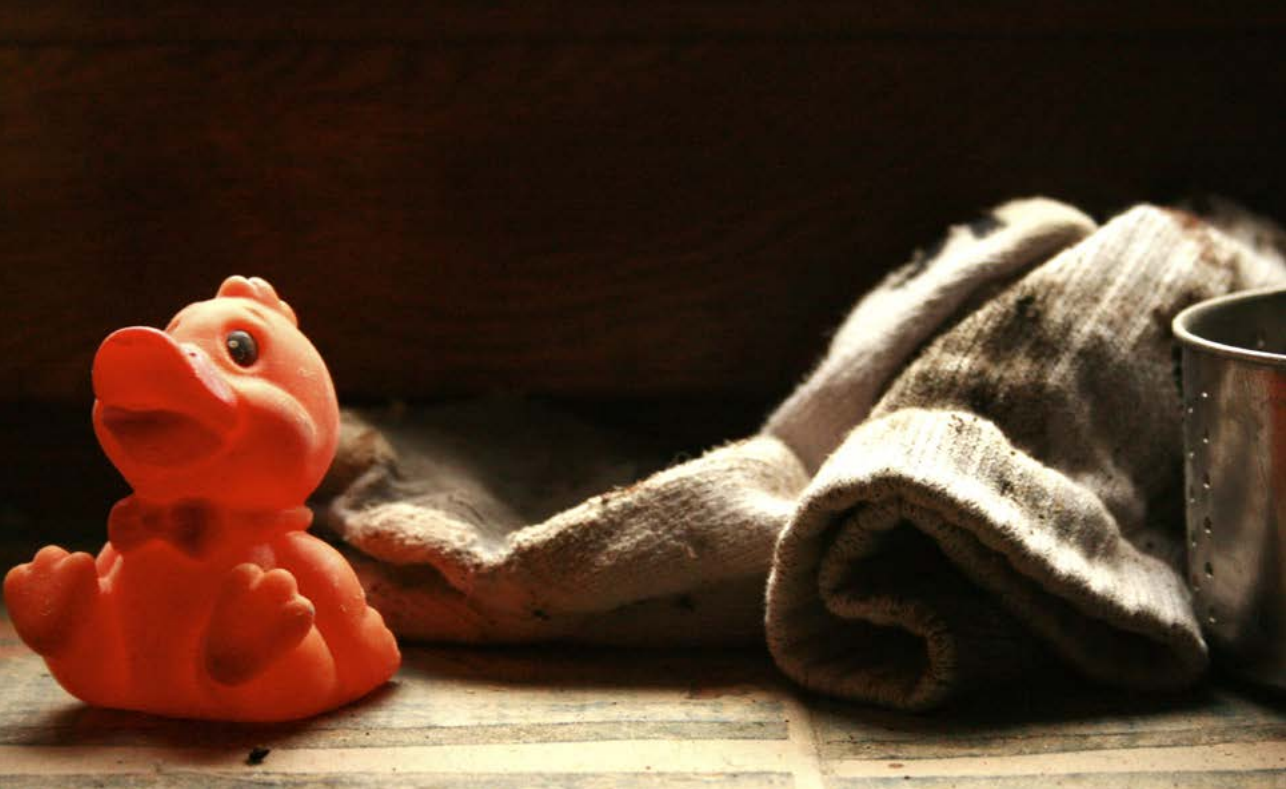
Plastik and, huset i Plovdiv.