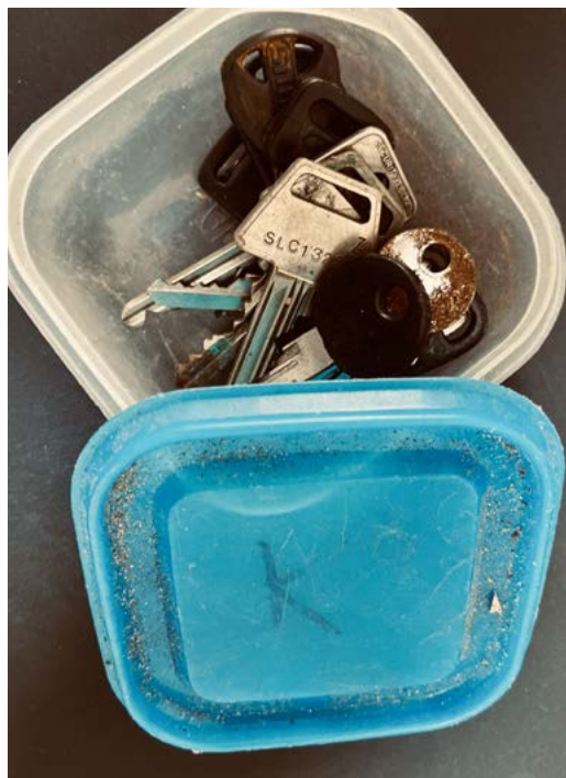
Bøtte med nøgler.

Skuffen er en slags holdeplads for ting, som ikke bliver brugt, men som måske skal bruges på et tidspunkt, hvis der pludselig er en nøgle eller en ledning eller en dims, der mangler til noget. De sjældne gange, hvor der bliver ryddet op i skuffen, forbliver de fleste af tingene i den, selvom sandsynligheden for deres mulige brugbarhed bliver mindre og mindre, som tiden går.