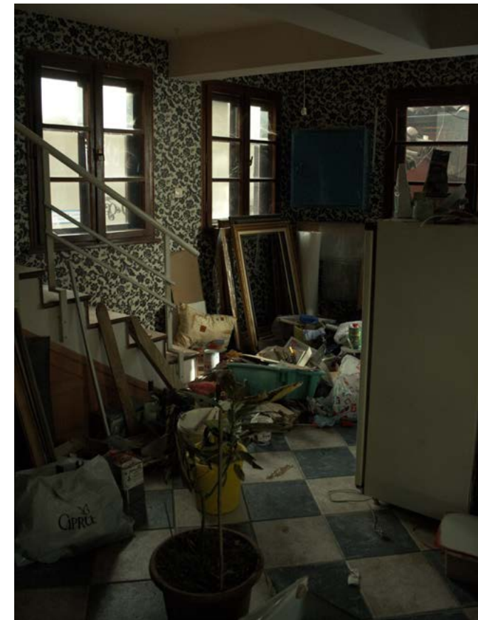
Køkken, huset i Plovdiv.

Stor rund pude. Sandsynligvis til bambus stol. Foldet én gang. Mønster af orange og røde firkanter med spredte blomster. Skum-indhold. Stof skrøbeligt.