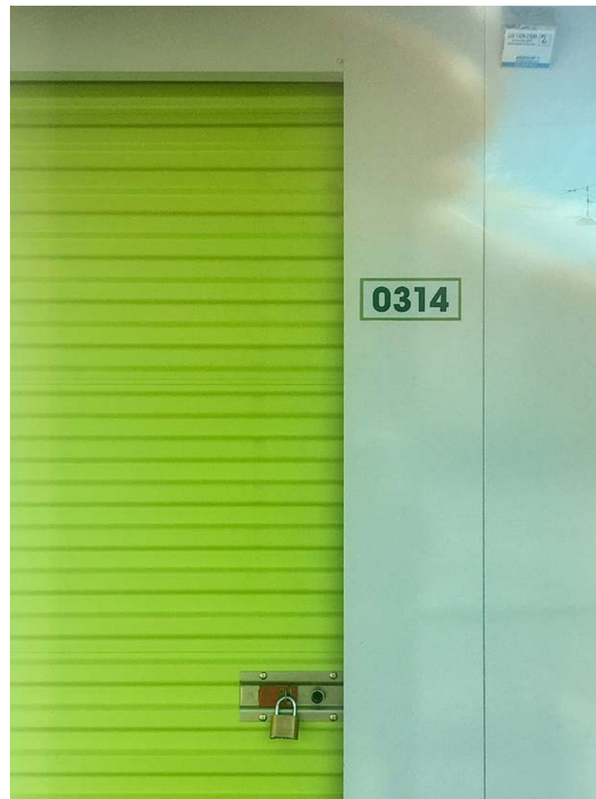
Opbevaringsrum 0314, 9 m 2 . Med lås.

Det er tydeligt, at der er blandede motiver for opbevaring, og nogle anvendelsesformer adskiller sig også fra næsten-skrald ved primært at have funktion som kommercielle varelagre for mindre forretningsdrivende. Men der er også opbevaringsrum hvis indhold vidner om ting, der som i Dragos hus i Bulgarien befinder sig i en slags næsten-skralds limbo. Vi ved ikke med sikkerhed hvad, der ligger til grund for at holde så forskelligartede ting hen i en uafklaret tilstand: de erotiske magasiner af ældre dato, ødelagte læsebriller, en aflagt motorcykel. Måske er det netop tegn på, at der ikke er truffet en endelig afgørelse. Ikke desto mindre og på trods af de stigende kvadratmeterpriser i byerne, er de såkaldte ting-hoteller et ekspanderende og pro-