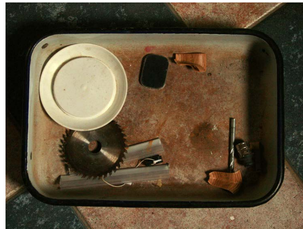
Bakke med værktøj, huset i Plovdiv.

Nøgler. To identiske. Til et andet hus end her.