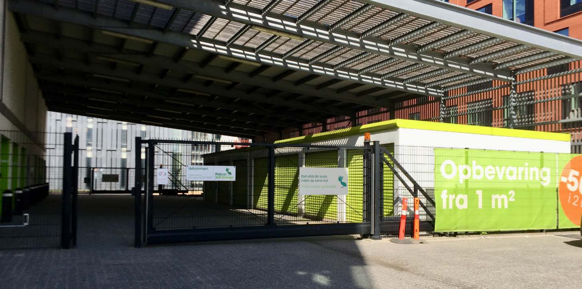
Pelican Storage i Sydhavnen, København. 6360 m 2 opbevaring fordelt på fem etager.

Vi følger med Jonathan på en rundtur inde i bygningen. Han hilser venligt på dem, vi møder. Vi går ind i en rummelig elevator og bevæger os op gennem bygningens fem plan. Vi stiger ud af elevatoren på tredje sal, hvor endnu en labyrint udfolder sig, prydet med grønne stålskodder. “Der er jo ting, som vi ikke tillader at blive opbevaret”, forklarer Jonathan. “Ja, altså, som eksplosiver, gasflasker, brandfarlige ting. Det kan vi ikke rigtig have af sikkerhedsmæssige årsager. Du ville jo ikke have, at alt skulle brænde ned, vel? [pause] Men for det meste kan folk opbevare stort set det de vil.” Der føres ingen optegnelse over hvad, der opbevares. På sin vis kommer og går tingene anonymt men under opsyn. Ofte bliver de længere end forventet. De fleste rum i bygningen er udlejet, og nye opbevaringsfaciliteter – både Pelican-filialen men også dens mange andre rivaler – overtager stadig mere plads i de større byer verden over. Men hvad kan man finde, når man åbner dørene til nogle af de forskellige størrelser af rum i bygningen? Hvad gemmer de på? I det følgende kaster vi et blik på indholdet af tre forskellige opbevaringsrum.