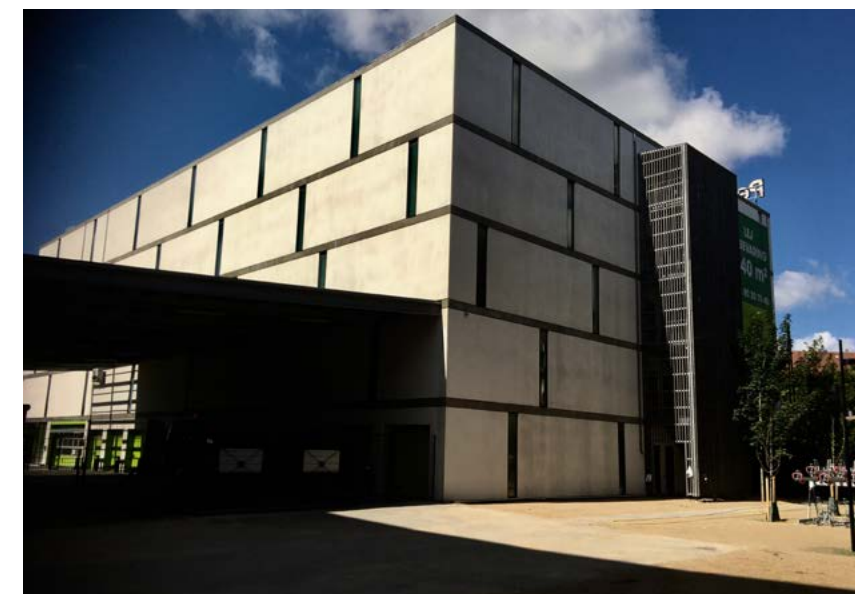
Pelican Storage, tilbygning.

Vi følger med Jonathan på en rundtur inde i bygningen. Han hilser venligt på dem, vi møder. Vi går ind i en rummelig elevator og bevæger os op gennem bygningens fem plan. Vi stiger ud af elevatoren på tredje sal, hvor endnu en labyrint udfolder sig, prydet med grønne stålskodder. “Der er jo ting, som vi ikke tillader at blive opbevaret”, forklarer Jonathan. “Ja, altså, som eksplosiver, gasflasker, brandfarlige ting. Det kan vi ikke rigtig have af sikkerhedsmæssige årsager. Du ville jo ikke have, at alt skulle brænde ned, vel? [pause] Men for det meste kan folk opbevare stort set det de vil.” Der føres ingen optegnelse over hvad, der opbevares. På sin vis kommer og går tingene anonymt men under opsyn. Ofte bliver de længere end forventet. De fleste rum i bygningen er udlejet, og nye opbevaringsfaciliteter – både Pelican-filialen men også dens mange andre rivaler – overtager stadig mere plads i de større byer verden over. Men hvad kan man finde, når man åbner dørene til nogle af de forskellige størrelser af rum i bygningen? Hvad gemmer de på? I det følgende kaster vi et blik på indholdet af tre forskellige opbevaringsrum.