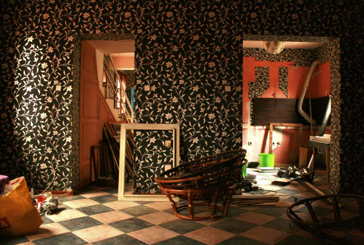
Stue, huset i Plovdiv.

Transportabel grill. Elektrisk. Kraftigt tilsødet, indeholder velbrugt stanniol.