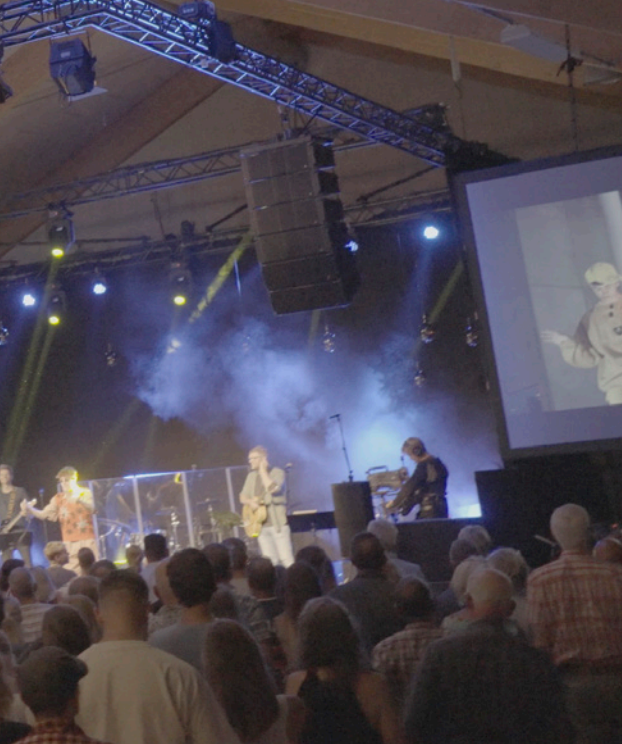
Møde eller 'gudstjeneste' under pinsekirkernes fællesorganisations årlige sommerlejr.