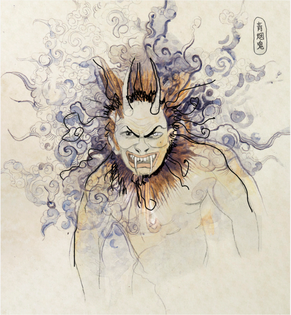
Illustration Louise Hilmar.