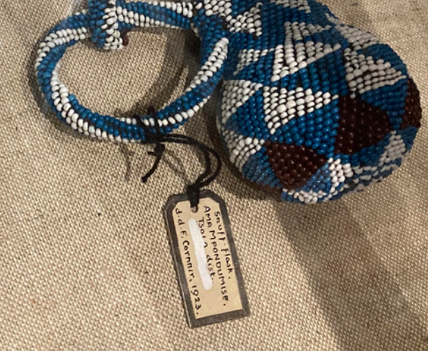
Genstandstekst udstillet på Pitt Rivers Museum. Dele af den oprindelige tekst blev i 1980'erne overmalet med rettelak.