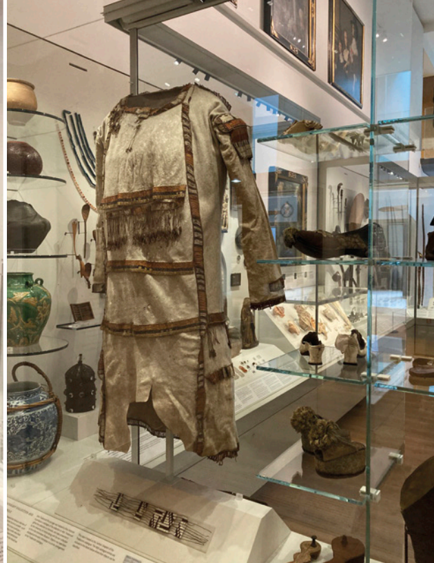
Ginny-tromme fra 1656 fra Vestafrika fremstillet af elefanthud og træ, naturhistoriske genstande og en Match-coat tunika fra Canada fremstillet i første halvdel af det syttende århundrede. Genstandene er udstillet på the Ashmolean Museum i Oxford i udstillingen The Ashmolean Story . Fotos taget af forfatteren i marts 2022.