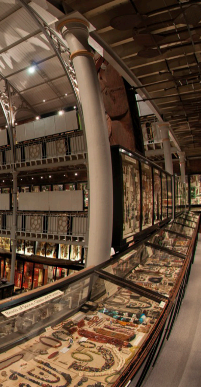
Pitt Rivers Museum, der huser mere end 500.000 genstande, fotografier og manuskripter fra hele verden.

civiliserende mission. Ud fra denne opfattelse havde de europæiske stormagter en moralsk forpligtigelse, ofte refereret til som Den Hvide Mands Byrde efter Rudyard Kiplings (1865-1936) digt fra 1899 af samme navn, til at kolonisere de dele af verden, som europæerne betragtede som underudviklede eller uciviliserede. Igenem europæisk kolonisation mente mange