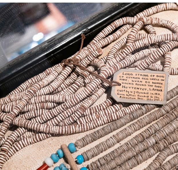
Genstandstekst fra en af Pitt Rivers Museums udstillingsmontre, der viser genstande fra Sydafrikas oprindelige Khoekhoen-befolkning.

Hun finder denne kritiske stillingtagen til fortidens klassificerings- og formidlingspraksisser “vigtig for alle museer, men i særdeleshed for et museum som Pitt Rivers, hvis højest problematiske genstandstekster på forskellig vis er med til at opretholde kolonialismen”. For Thompson-Odlum er det væsentligt at tænke over, hvilke former for viden, der videreføres fra én generation til den næste og at gentænke, hvilket sprog, der anvendes. Men hvordan føres denne gentænkning mere konkret ud i livet?