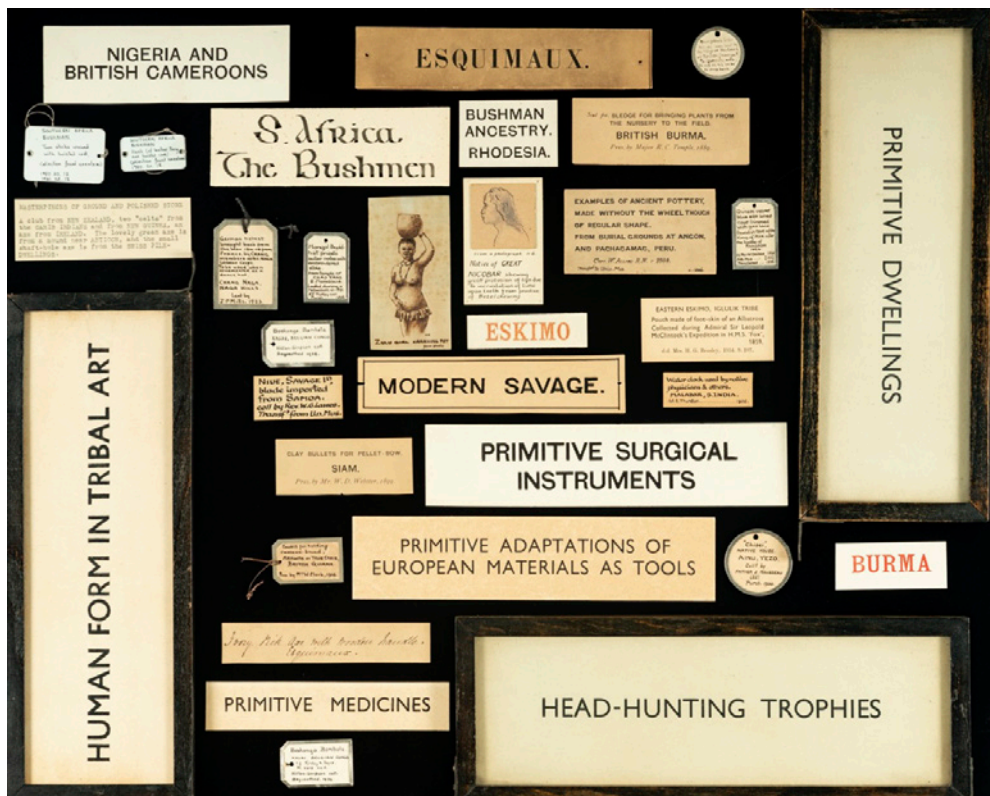
Eksempler på udstillingstekster på Pitt Rivers Museum med koloniale stednavne og betegnelser af nedsættende karakter.

Rivers hviler på. Foruden Labelling Matters kan nævnes det nu afsluttede The Relational Museum -projekt og det EU-støttede Taking Care -initiativ. Begge projekter har fokuseret på at inddrage repræsentanter fra de befolkningsgrupper, som samlingerne stammer fra. Ved at etablere samarbejder med folk, hvis forfædres genstande befinder sig på museet, ønsker Pitt Rivers kuratorer at skabe et inkluderende rum, hvor der er plads til en mangfoldighed af fortællinger, og hvor alle befolkningsgrupper betragtes som ligeværdige bidragydere til produktion af viden. Under Pitt Rivers nedlukning i forbindelse med Covid19-pandemien i 2020, gik museets kuratorer nye veje for at gentænke formidlingen af deres sam-