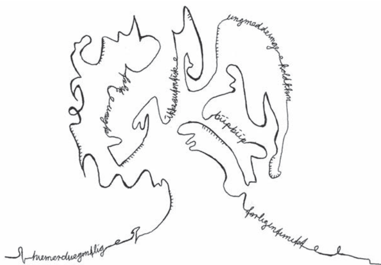
Tankerod. Tegning af forfatteren.

Jeg vil ikke dvæle ved de analytiske perspektiver her, jeg nævner dem alene som eksempler på, hvordan vi som antropologer måske ofte igennem analysen kan håndtere og eksternalisere intime og grænseoverskridende oplevelser. Det svære og kludrede gøres meningsfuldt og vigtigt i en faglig sammenhæng. Men det hjælper ikke nødvendigvis på de personlige og følelsesmæssige tråde, der flager forvirret rundt efter en sådan oplevelse. Og det efterlader stadig en masse spørgsmål om etik og nærhed. For må man som feltarbejder overhovedet have tætte relationer til “sårbare” andre? Hvordan er man både autentisk og professionel på samme tid? Hvornår er intimitet farligt?