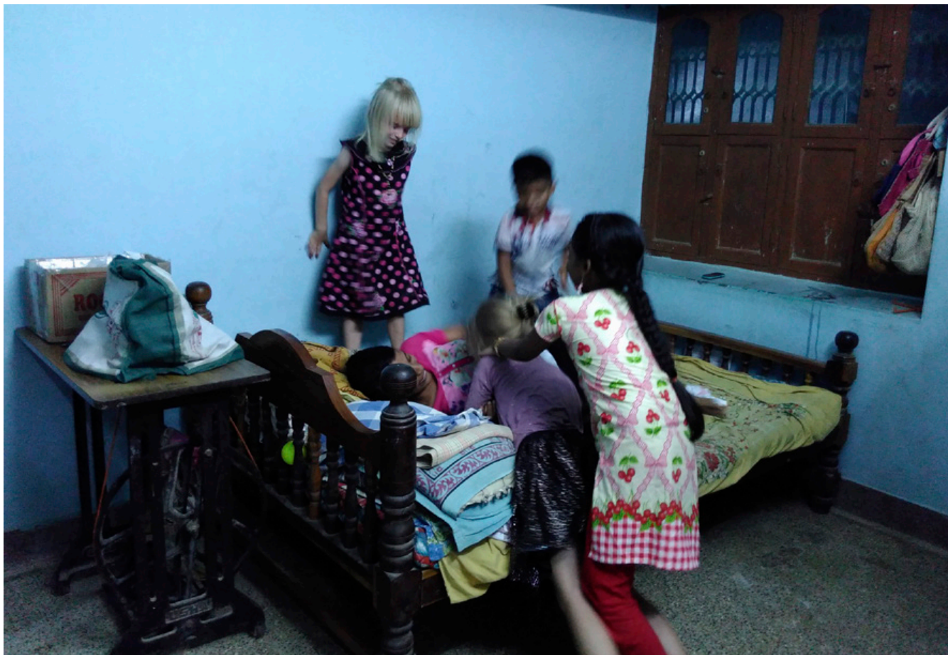
Boligindretningen er simpel og praktisk i de fleste sydindiske hjem. Her et kig ind i soveværelset hos en familie af to collegeundervisere med ph.d.-grader og deres to børn i en mindre tamilsk provinsby, 2017.

nomiske og kulturelle elite, at boligindretning bruges til at udtrykke individualitet og personlig smag. Blandt de allerfattigste på landet, hvor hjemmet ofte blot er et enkelt rum eller to med lerstampede gulve eller rå beton, er egentlige møbler udover et par plasticstole og et aflåseligt metalskab som regel fraværende. Man sidder og sover på strå- eller plasticmætter og opholder sig en stor del af dagen udendørs. Det samme gør sig gældende i storbyernes slumboliger. Men også hos de bedrestillede bønder og hos middelklassen i byerne er hjemmene ofte spartansk indrettede med fokus på funktionalitet snarere end komfort eller æstetik. Der kan hænge billeder af guder og afdøde familiemedlemmer højt på væggene og i nogle tilfælde også en plakat med en politisk helt eller en scene fra et bjerglandskab, men ellers er der sjældent overflødig dekoration, ingen farveafstemte pyntepuder og tekstiler. Hjemmets indretning er for de fleste først og fremmest et praktisk anliggende.