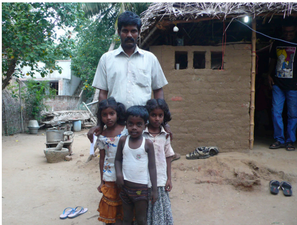
Ramus yngre bror med sine tre børn foran familiens katcha hus i hjemlandsbyen, 2015.

palmebladstag. Et stort flot hus bygget af mursten, cement eller beton med en hall til at modtage gæster, separate soveværelser, køkken, og for hindu-ers vedkommende et lille, smukt udstyret pūja -rum beregnet til religiøse ritualer for familiens foretrukne guder, vidner om velstand og værdighed: en succesfuld familie.