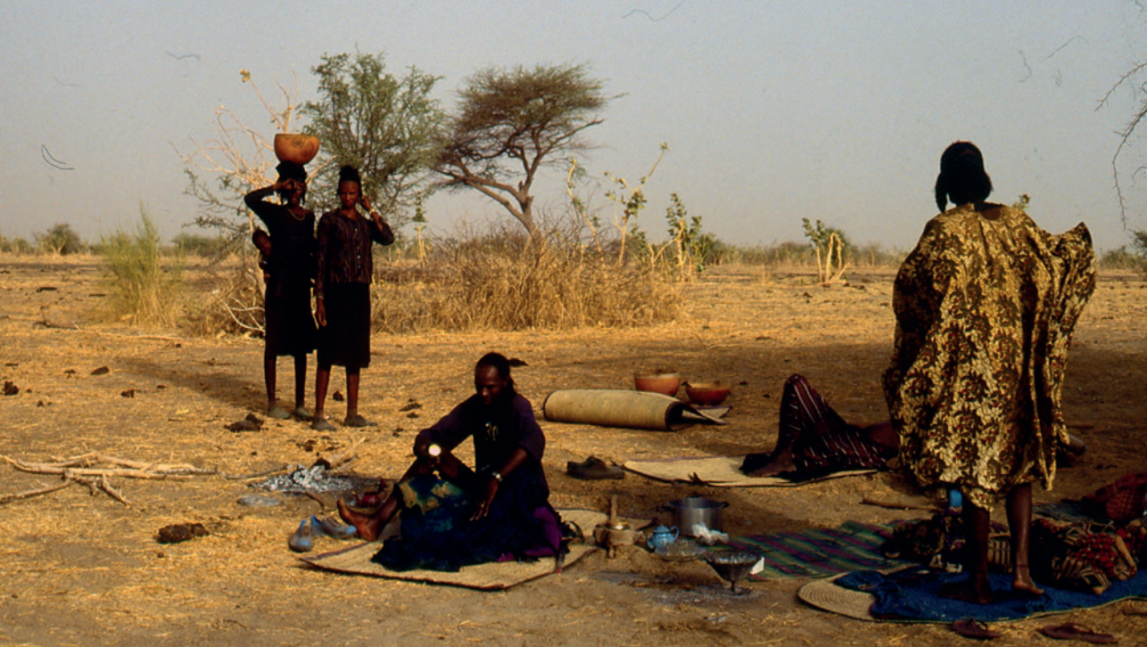
WoDaaBe slår lejr, Niger 1992. Mændene arrangerer deres soveplads: en tynd palmebladsmåtte til hver, og der brygges te efter en hel dags hårdt arbejde (se den lille lyseblå tekande med te fra Kina). I baggrunden står to kvinder og venter ydmygt, parate til at give mændene mælk i den store kalabas.