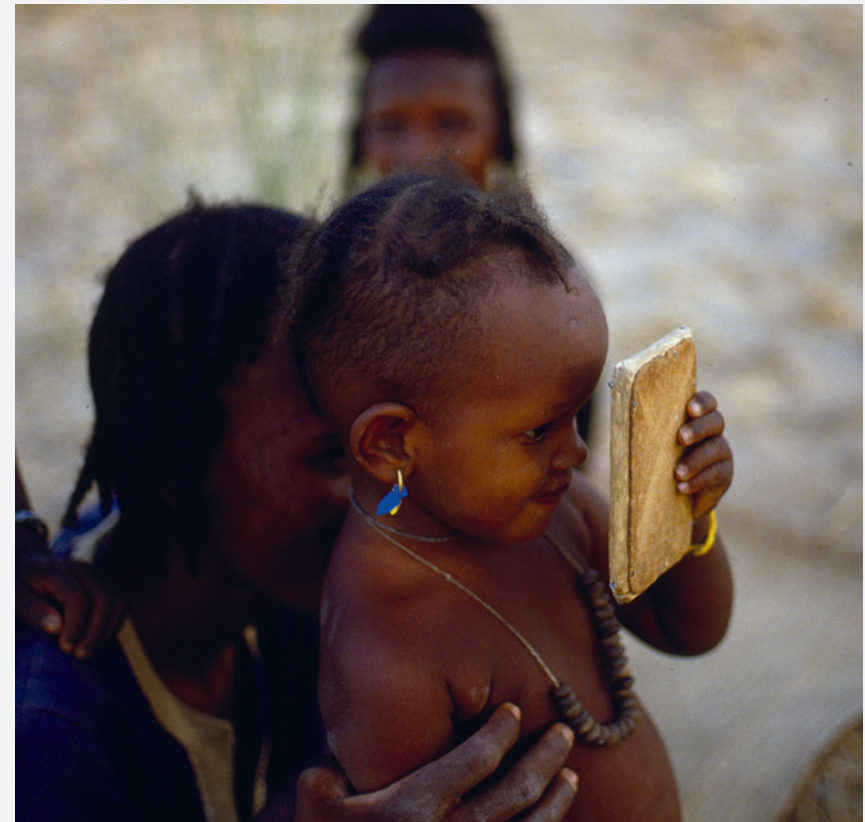
WodAaBes børn lærer fra en tidlig alder at kigge sig i spejlet og udsmykke sig.