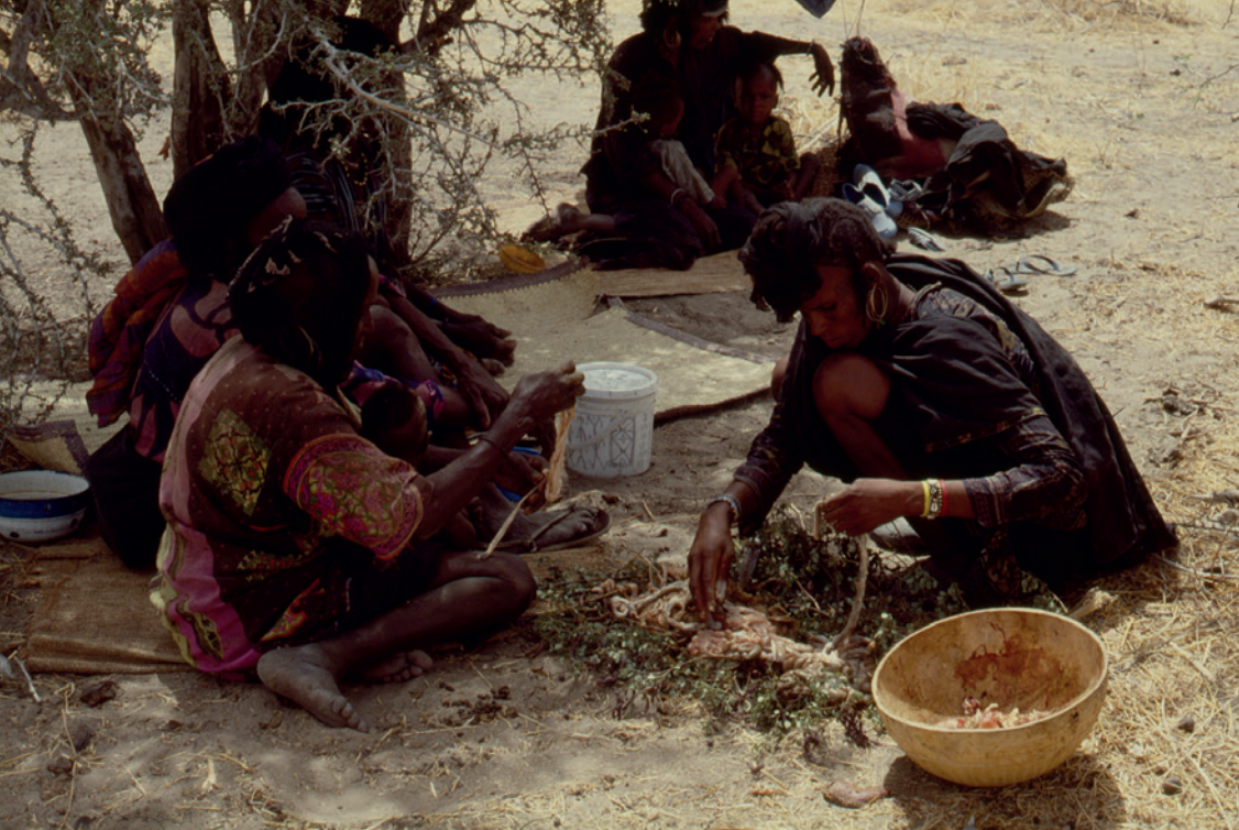
Mormor Daada og en niece tilbereder tarm-indvolde efter slagting af et får: en delikatesse. 1987.

prøve dragterne og holde tingene i hænderne: “De er ægte! Og fra Afrika!”. Børnene måtte også bruge den jernhakke, jeg havde købt i Nigeria, i den danske muld. Det syntes eleverne var herligt, og jeg syntes, det var herligt.