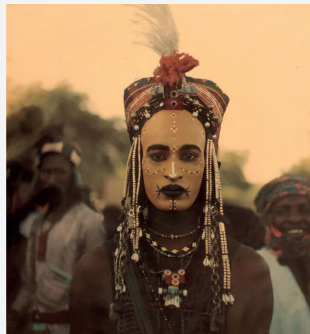
Vinderen af Djuulde Gaani -ceremonien, november 1990.