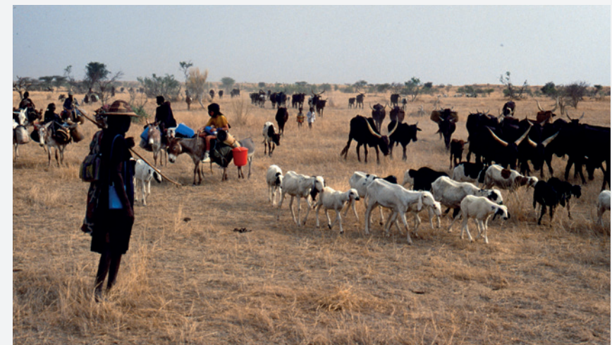
Storfamilien har vandret 25 km til den nye boplads på en dag. Kvinder og børn rider på æsler, mænd er til fods.