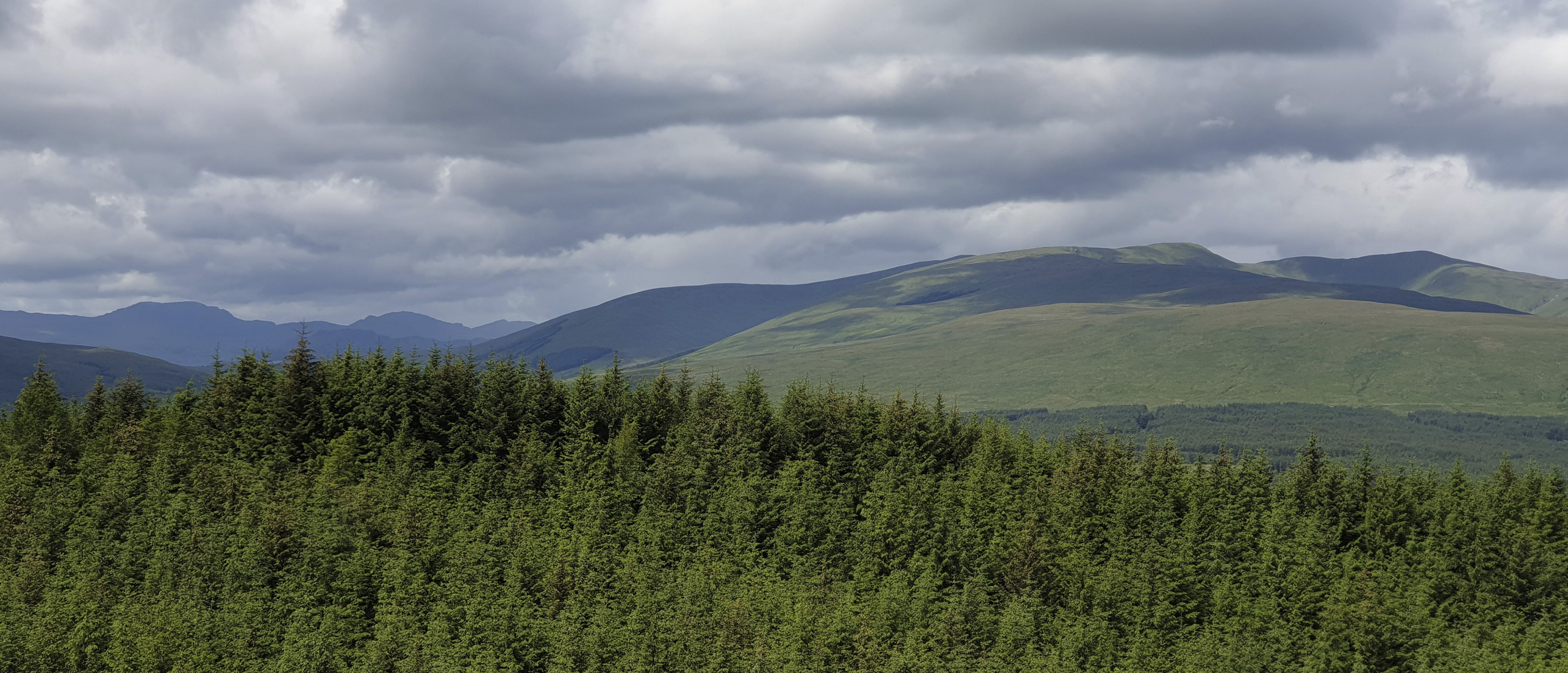
Udsigten over det åbne højland ved Loch Lomond.

leord. Webcrawlers fungerer ved, at man indtaster en kæde af ord og internetadresse, hvorefter webcrawleren afsøger disse webadresser. Her identificerer onlineværktøjet alle hyperlinks og nøgleord på hjemmesiderne og tilføjer dem til en liste over nye webadresser med relation til den oprindelige liste.