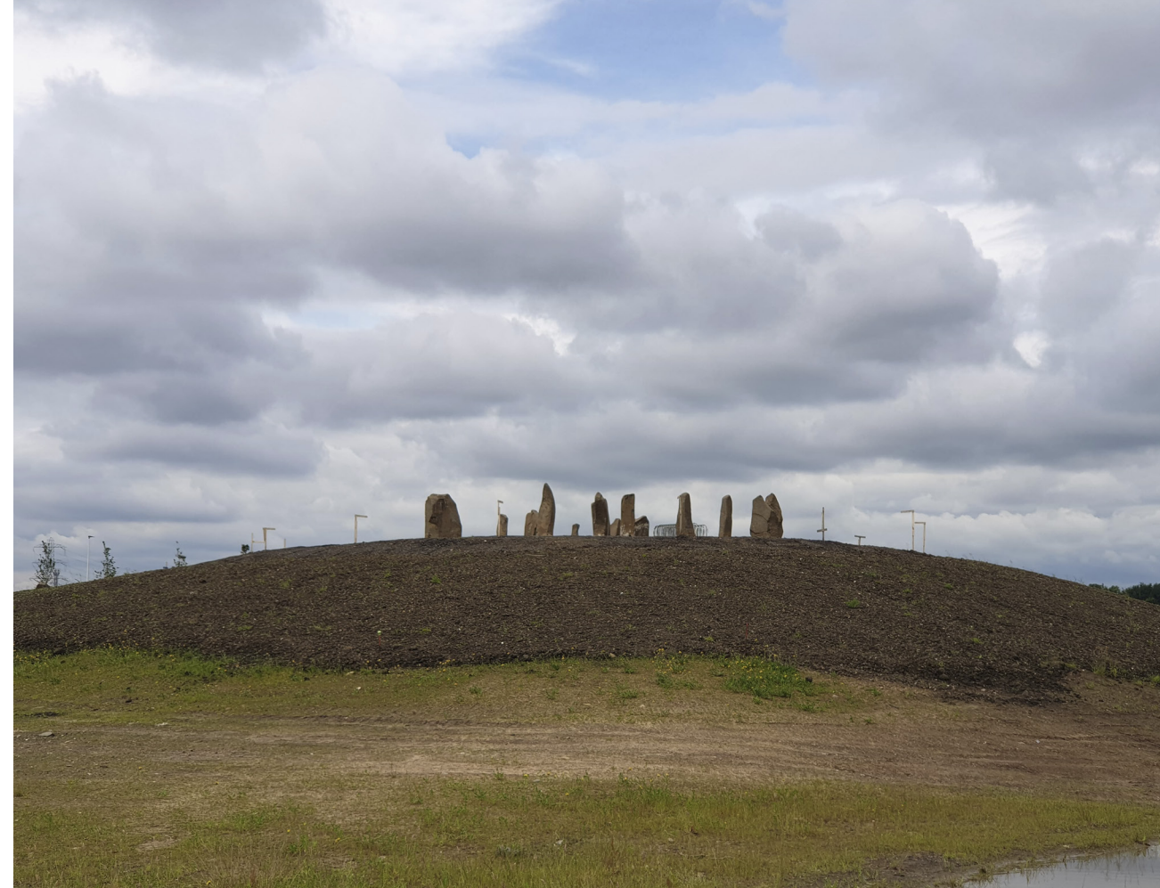
Den nyligt opførte stencirkel i Sighthill, der ligger i den nordlige del af Glasgow.

Hvordan benytter man den kontekstuelle og situerede analyse og metode, der er central for antropologien, når ens feltarbejde foregår online? Den antropologiske metode med deltagerobservation, hvor jeg røg cigaretter, lærte at lægge tarotkort, var på festival og gik ture med mine informanter, skabte en specifik viden, der bidrog til en forståelse af paganisterne fra Glasgows hverdagsliv. Som mit feltarbejde skred frem, fandt jeg imidlertid ud af, at størstedelen af de magisk-centrerede interaktioner mellem paganisterne, fandt sted online. Paganisterne har ugentlige gruppesamlinger kaldet moots . Her mødes de på pubs, i private hjem eller på cafeer og diskuterer forskelli-