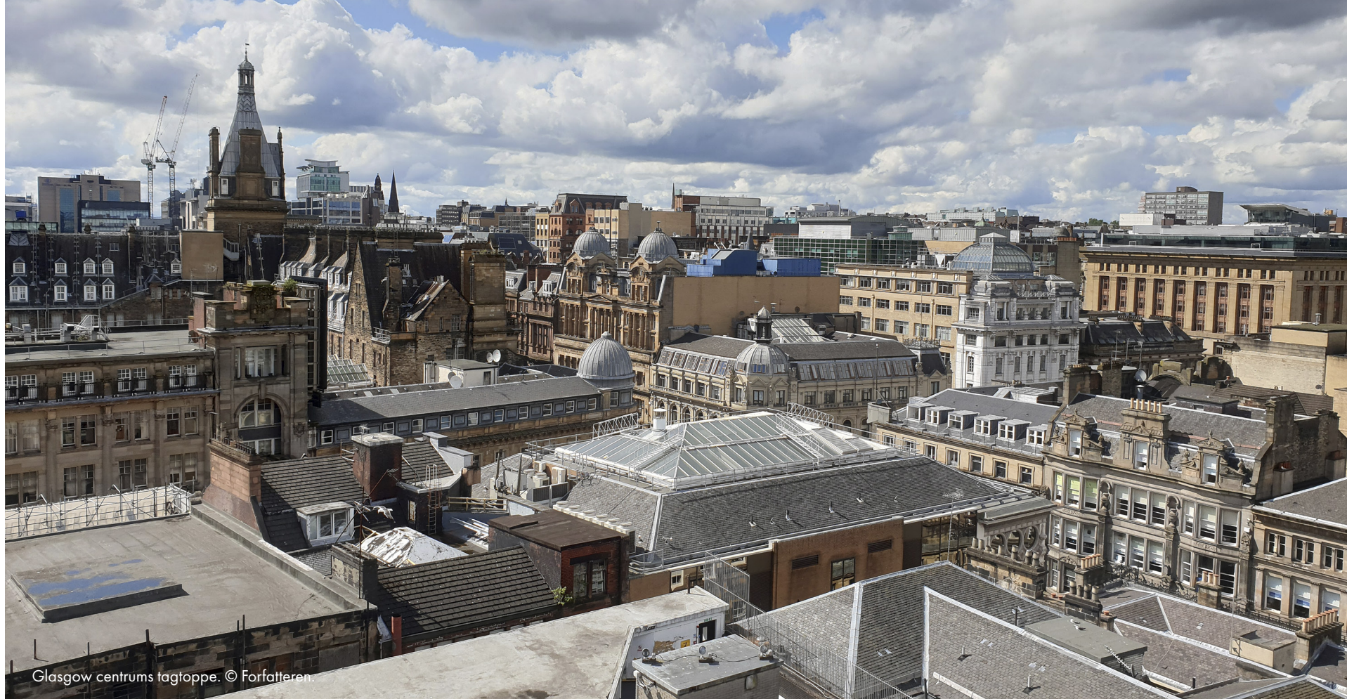
Glasgow centrums tagtoppe.

“ Nye magiske interaktioner og helt nye spirituelle udtryksformer blev pludselig en del af mit videre feltarbejde. På internettet kunne man lave magi!