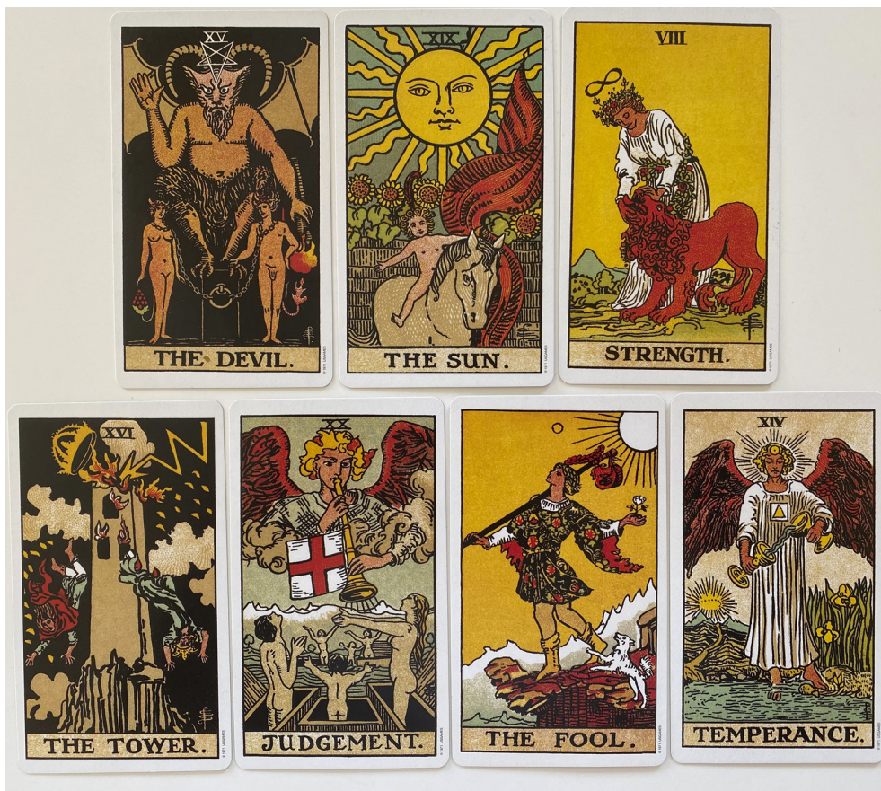
Et udsnit af mine tarotkort.