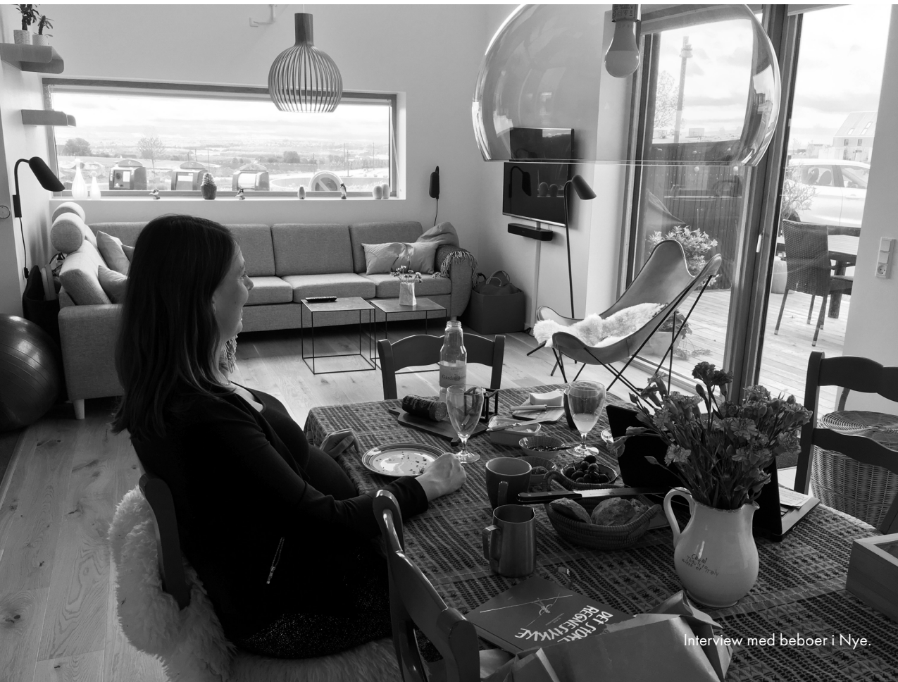
Interview med beboer i Nye.

Vi fik 38 besvarelser på spørgeskemaet, som gav os indsigt i, hvorvidt de tematikker, der var fremkommet i interviews, også havde en bredere relevans blandt beboerne.