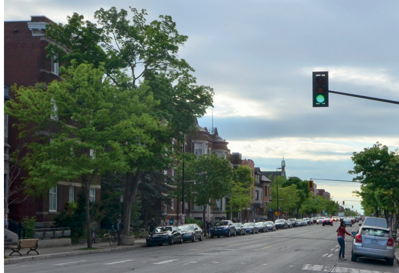
Avenue du Parc, Mile End, Montreal.