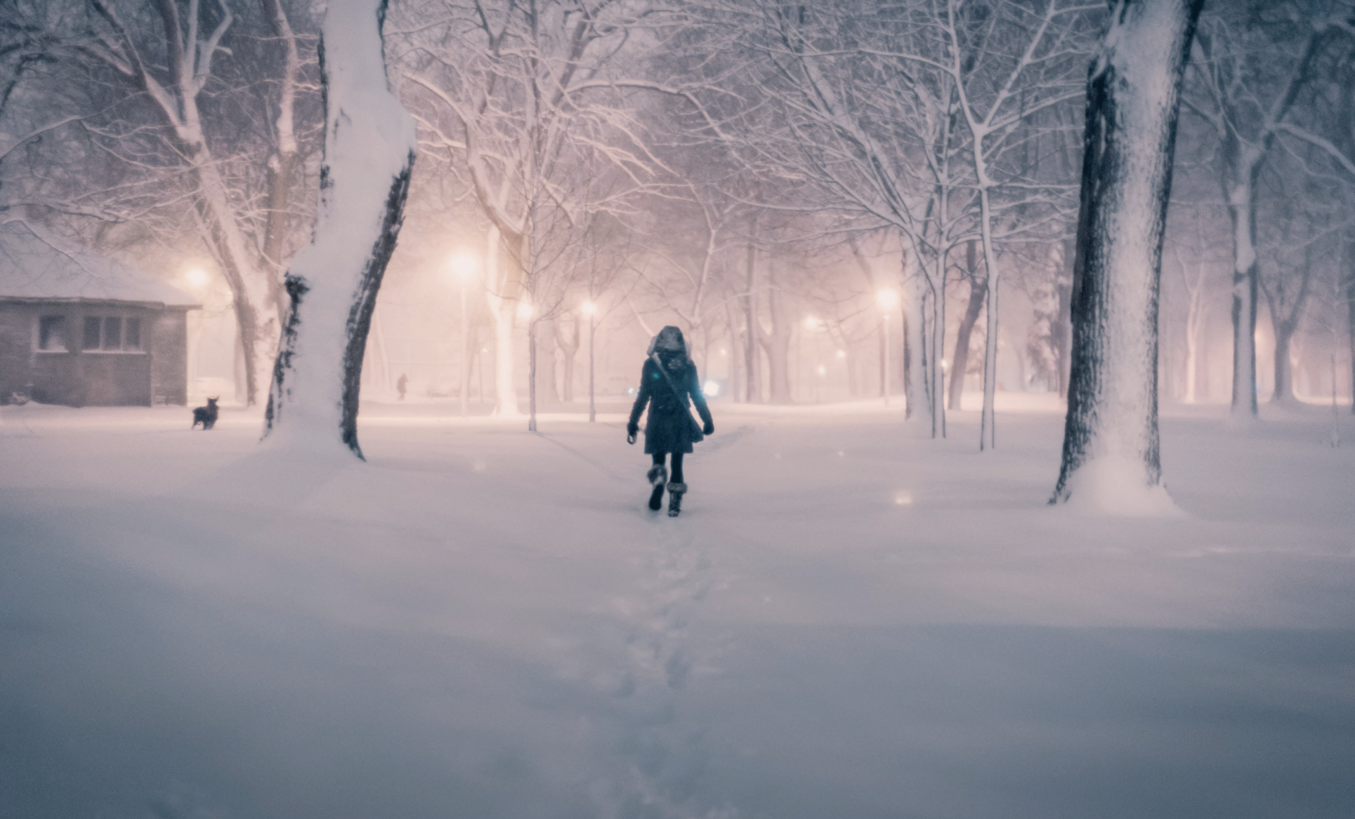
På vej hjem gennem Parc La Fontaine, Montreal.

hende til at gen(op)finde en identitet som et stærkere og mere selvstændigt menneske end tidligere. Hendes fortælling bringer hende på den måde ind i en fremtid, som den stærke og uafhængige kvinde, hun ser sig selv have “potentiale-for-at-være”.