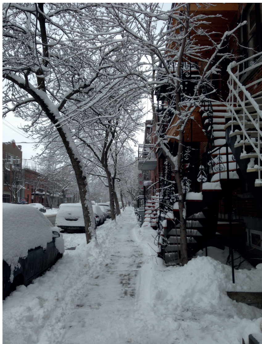
Le Plateau, Montreal.