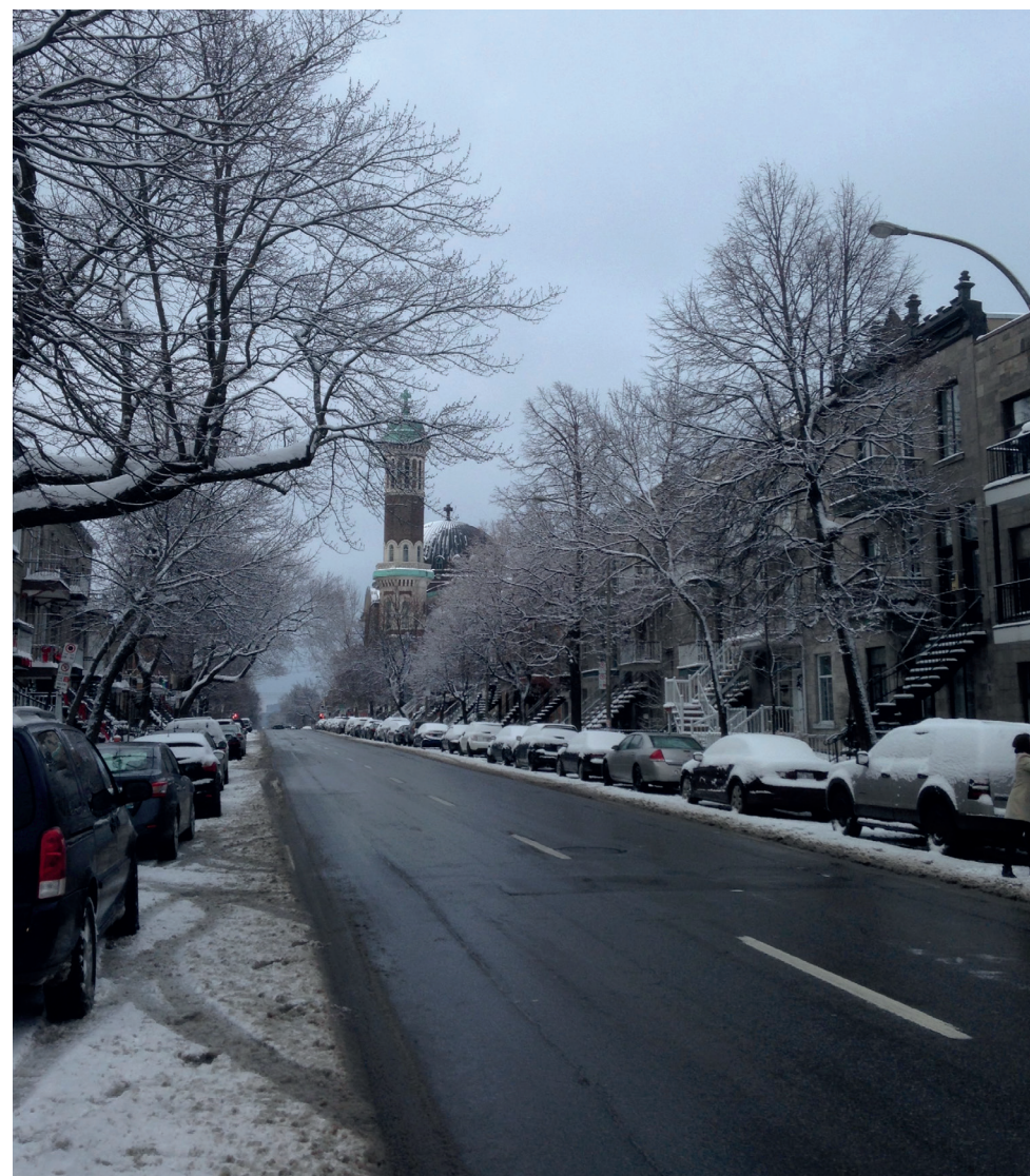
Mile End, Montreal, taget foran min lejlighed.