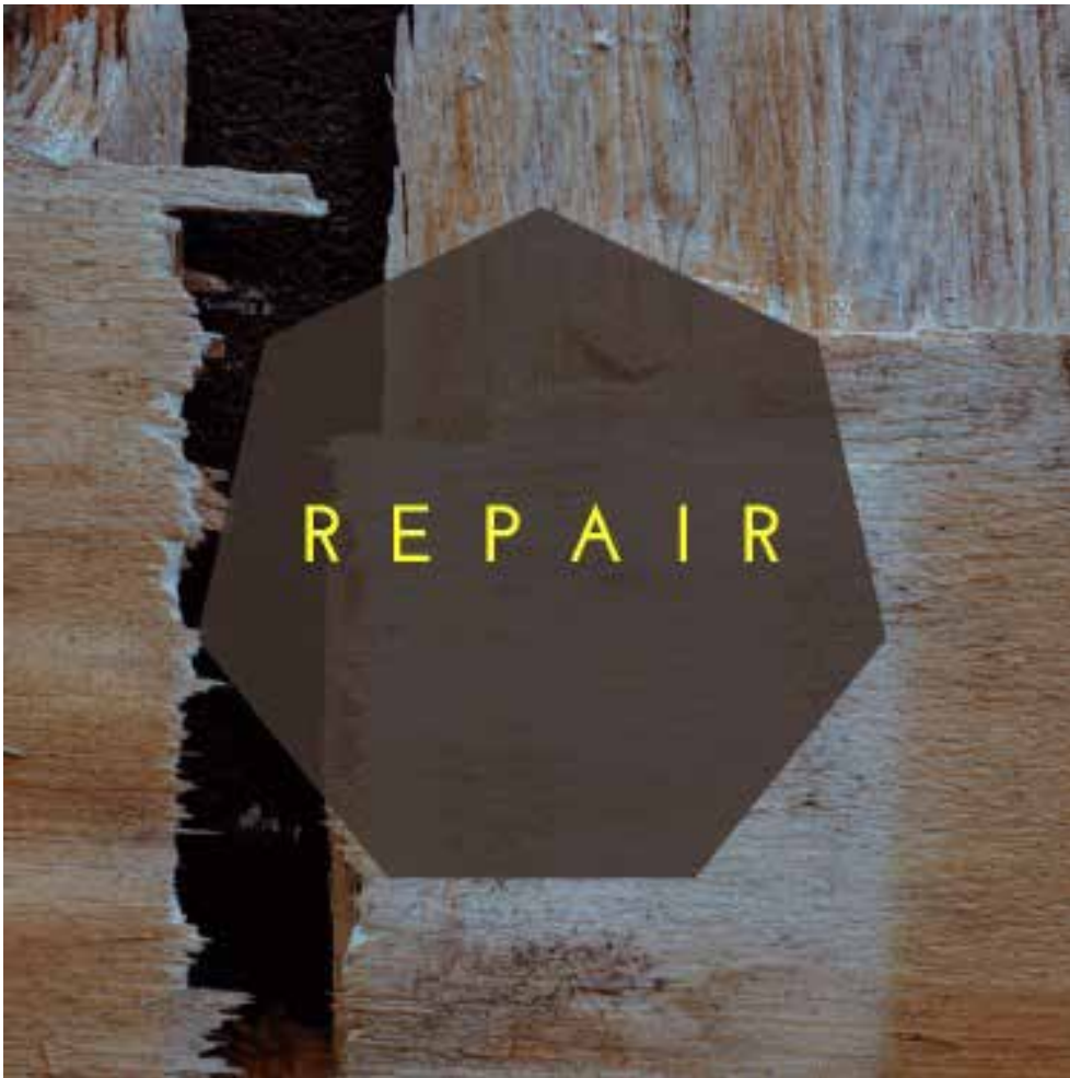
Udstillingens logo. Lavet af Nanna Raft Mikkelsen.

Hvorfor er et fokus på reparationer antropologisk relevant? Reparationer knytter an til en idé om normalitet. For at bestemme noget som ødelagt, må der også være en normaltilstand. Men hvad, der er 'normalt', er afhængigt af den specifikke sociale kontekst, hvori reparationen foregår. Derfor kan et fo-