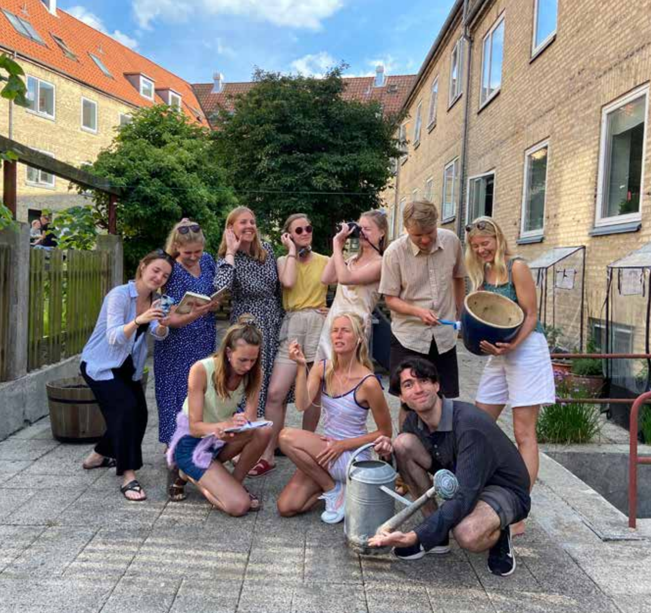
Gruppen bag udstillingsrummet ReBODIED.

sere og kuratorer, der har haft mange års erfaring inden for feltet. I år var formatet nyt og uden fortilfælde, og vi måtte derfor selv løbende finde ud af, hvad der kunne lade sig gøre inden for rammerne. Vi havde mange visioner og idéer til, hvad der kunne udstilles, men den begrænsede tid kombineret med manglende erfaring inden for det digitale endte med at blive afgørende for, hvad der kunne lade sig gøre. Hvor et museumsrum er begrænset af dets fysiske omfang, begrænsede vores digitale rum sig af tiden, vi havde til at skabe det.